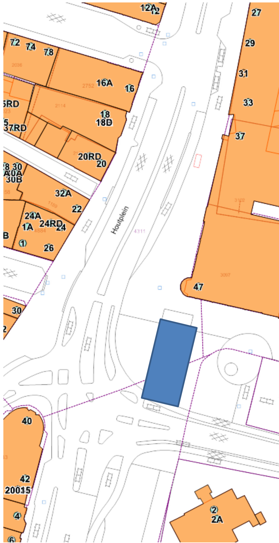
Houtplein – Uitbreiding 1 In het blauwe vlak op het Houtplein kunnen ca 9 kramen staan (twee zijden) met ca 5 auto's.

Themamarkten op de Dreef, incl uitbreiding naar het Houtplein en de Haarlemmer Hout - Totaal aantal kramen ca 100 stuks - Totaal aantal auto's ca 65 stuks