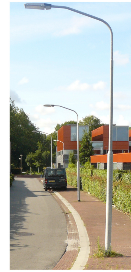
Standaard verlichtingsmasten in RAL 7016 grijs