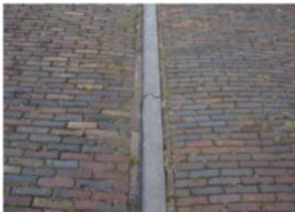
RUWEG / TROTTOIR FLORAPLEIN