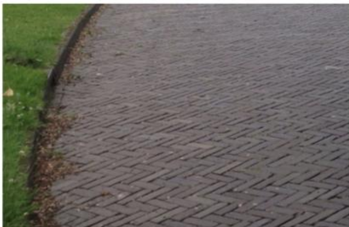
RIJWEG HAZEPATERSLAAN - FLORAPARK : GEBAKKEN KLINKERS (HERGEBRUIK), ROOD, DIK- OF KEIFORMAAT, KEPERVERBAND