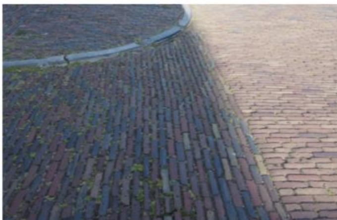
RIJWEG FLORAPLEIN : GEBAKKEN KLINKERS (HERGEBRUIK), ROOD, WAALFORMAAT, HALFSTEENSVERBAND