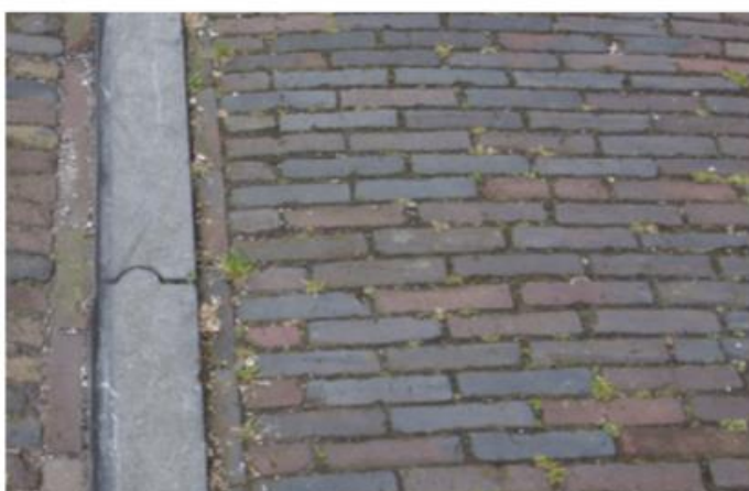
TROTTOIRS - GEBAKKEN KLINKERS (HERGEBRUIK EN NIEUW) ROOD, WAALFORMAAT, HALFSTEENSVERBAND