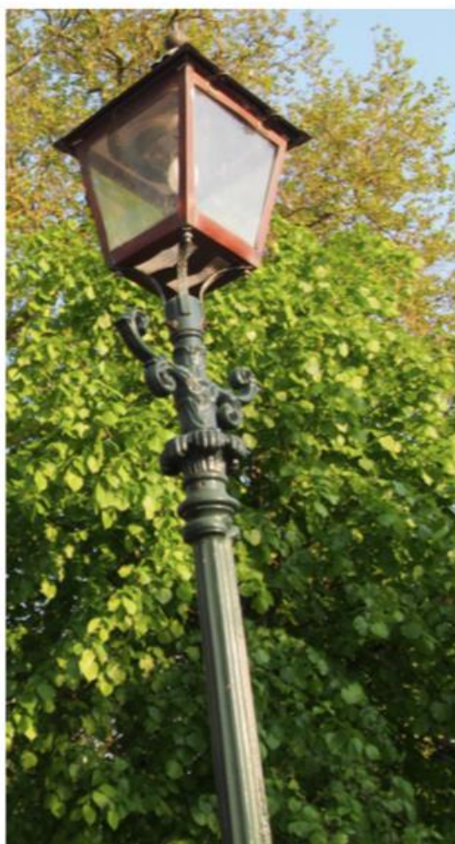
HISTORISCHE LICHTMAST (TYPE BAKENES)