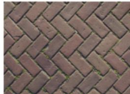
RUWEG FLORAPARK / HAZEPATERSLAAN

Bovenstaande afbeelding is 1 pagina uit een enquête (27 pag) die alle bewoners hebben kunnen invullen. Daarin staat als uitgangspunt heel duidelijk de bestaande gebakken klinkers en trottoirbanden te hergebruiken. Hierop zijn geen zienswijzen ingediend en dit is danook VO en DO geworden.