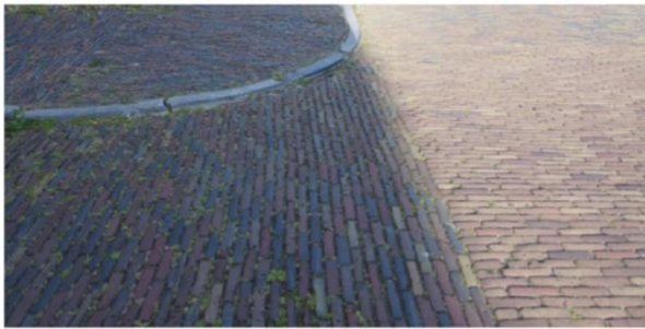
HERGEBRUIK GEBAKKEN KLINKERS EN HARDSTEENBANDEN