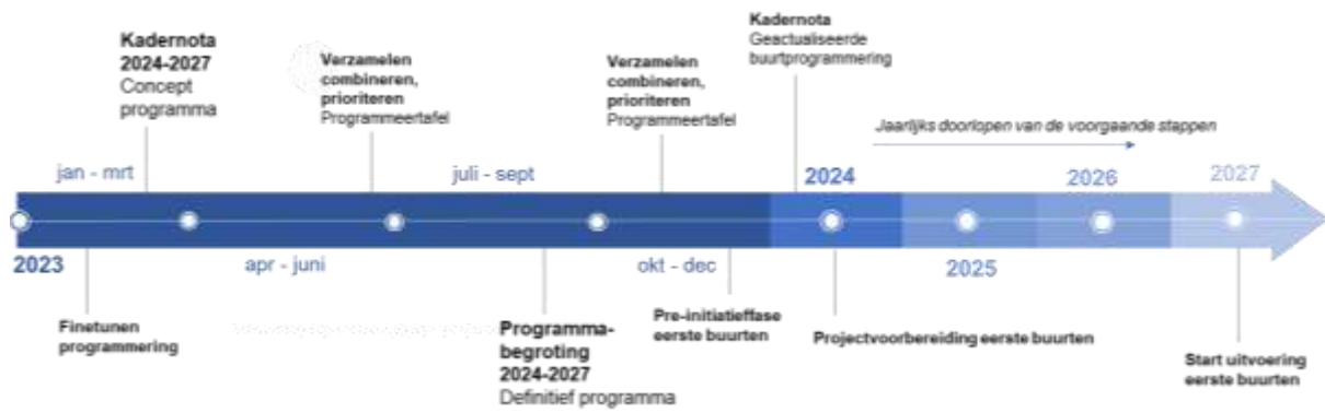
Figuur 3: Tijdspad programmering