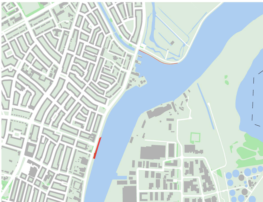
Afbeelding 1 Plangebied