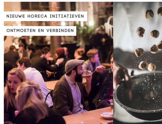
NIEUWE HORECA INITIATIEVEN