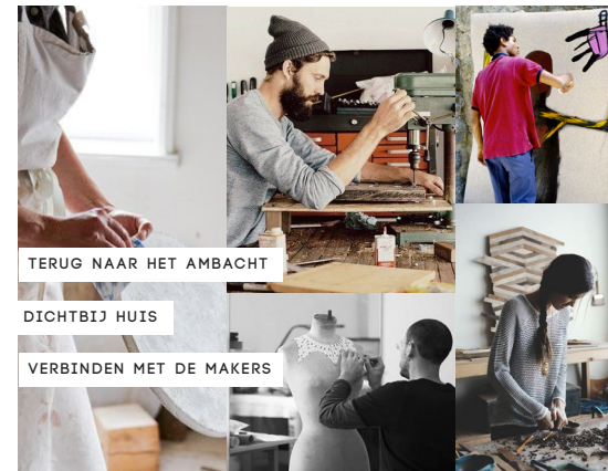
TERUG NAAR HET AMBACHT