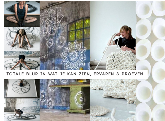
TOTALE BLUR IN WAT JE KAN ZIEN, ERVAREN & PROEVEN

Gather is een maatschappelijke organisatie. Een coöperatie. De leden zijn de vertegenwoordigers van de internationale top van de nieuwe kleinschalige creatieve maakindustrie. Kleine merken en labels, jonge ontwerpers, creatieve ambachtslieden en innovatieve horecaconcepten die deels hun ateliers in de cellen zullen vestigen en deels in de Waarderpolder. Doel van Gather is deze creatieve maakindustrie het podium te bieden waar zij kunnen schitteren. Reputatie kunnen verwerven.