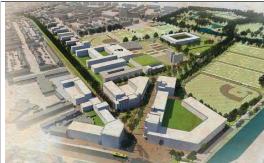
Visualisatie zichtlijn richting sporthal uit de visie (blz. 30)

De sporthal ligt in de zichtlijn vanaf het nieuwe Stadionplein richting Schoterbos en is daarmee ook qua oriëntatie van belang. Daarnaast zal de ruimtelijke kwaliteit van de route door herinrichting toenemen en daarmee aantrekkelijker en toegankelijker worden voor gebruik en waardoor de sociale veiligheid zal toenemen.