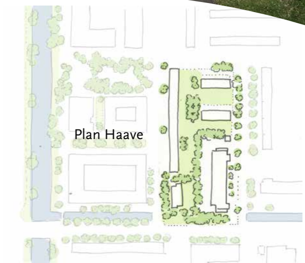
Huidige situatie met aan de westkant het plan Haave.