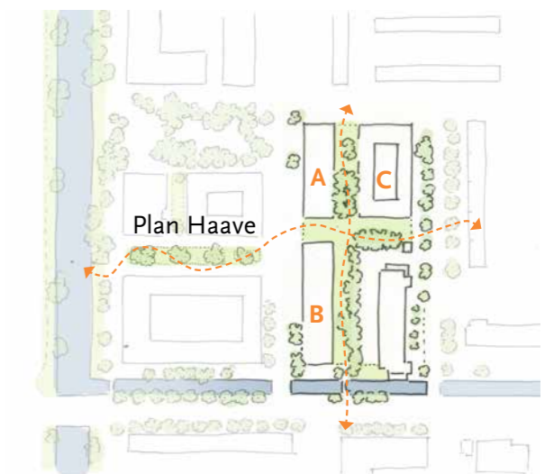
De groene zone in het plan Haave wordt verbonden met het groen in Project Pasteur. De toekomstige gracht wordt doorgetrokken.