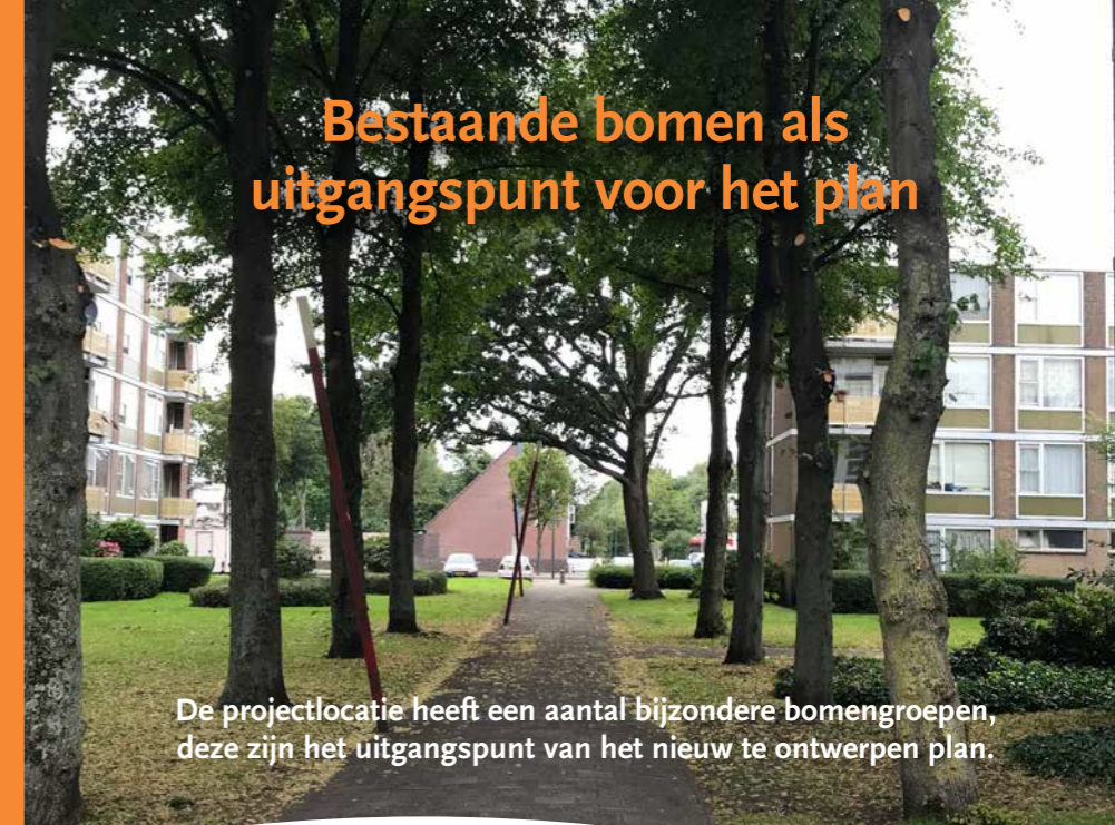
De projectlocatie heeft een aantal bijzondere bomengroepen, deze zijn het uitgangspunt van het nieuw te ontwerpen plan.