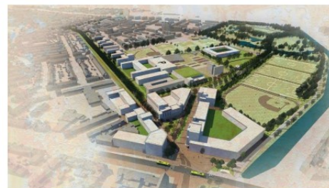
Afb: impressie nieuw Stadionplein (uit 'visie ontwikkelzone Orionweg/ Planetenlaan')

De ruimtelijke kwaliteit van een gebied is goed als de bestaande locatie duurzaam wordt gebruikt en de belevingswaarde, de gebruikswaarde en de toekomstwaarde in balans zijn. Een herkenbaar landschap, aantrekkelijk gebruik van het gebied en mogelijkheden om in te spelen op toekomstige veranderingen spelen daarbij een rol.