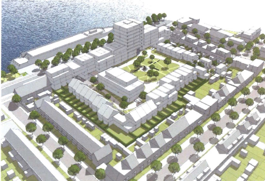
Afbeelding voorlopig ontwerp stedenbouwkundig plan

heeft vanaf 25 augustus tot en met 5 oktober 2022 ter inzage gelegen. In die periode heeft iedereen de gelegenheid gekregen een inspraakreactie in te dienen. Er zijn 15 reacties ingediend. De inspraakreacties en ambtshalve wijzigingen hebben tot aanpassingen geleid (zie bijlage c). Het SPvE is nu gereed voor vaststelling.