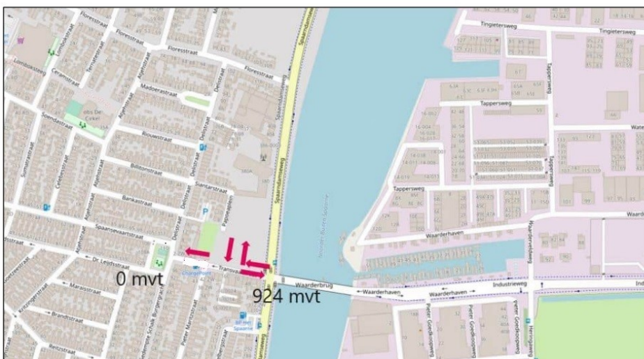
Variante 9 (ondergrond open streetmap, aantal mvt niet onderzocht want is afhankelijk van toegestane rijrichtingen bij Waarderbrug)