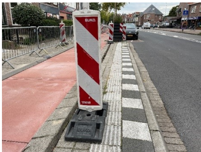
Situatie Rijksweg halte Zaanenlaan

Vorige week zijn we in het kader van de 'Week van de Toegankelijkheid' de stad ingegaan om te kijken hoe het daarmee in Haarlem gesteld is. Helaas hebben we gezien dat in sommige situaties niet alleen de toegankelijkheid in het geding is, maar het zelfs gevaarlijk kan worden. Zo is de bushalte 'Zaanenlaan' voor mobiele mensen slecht bereikbaar en voor mensen met een beperking al helemaal ondoenlijk, terwijl dit nota bene een rolstoeltoegankelijke bushalte is met in de directe omgeving voorzieningen zoals een gezondheidscentrum. Hetzelfde geldt voor de situatie rond de Publiekshal aan de Wilhelminastraat. Ook de verbouwing aan de Amsterdamstraat waarbij de gehele stoep onbegaanbaar is geworden, levert risicovolle situaties op. En zo zijn er meer van dit soort gevallen waarbij zowel de toegankelijkheid als de veiligheid onnodig in het gedrang komen.