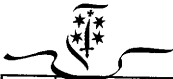
Bijlage 1: Afspraken over Midterm Review Stad: Haarlem (versie 28 juni)