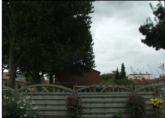
Uitzicht vanuit de woonkamer.