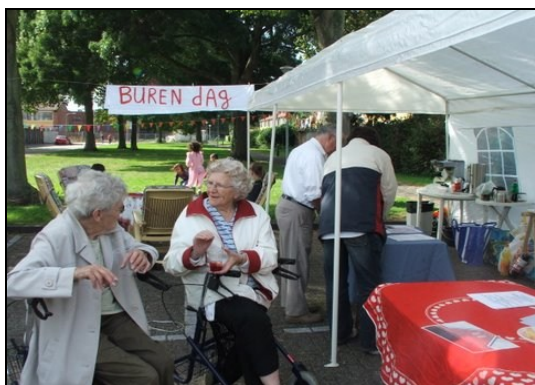
Oudere bewoners praten over de wijk. Vereenzaming van ouderen die nauwelijks buiten komen omdat ze niet weten hoe ze nog in contact met hun medemens kunnen komen.