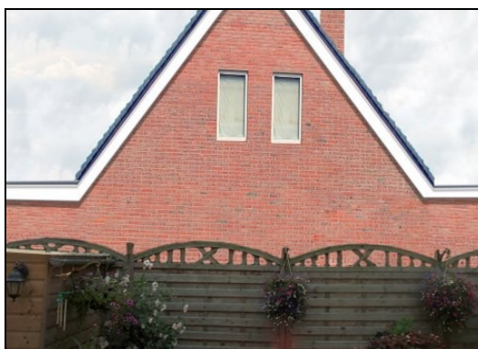
Ons uitzicht na het bouwen van de huizen.