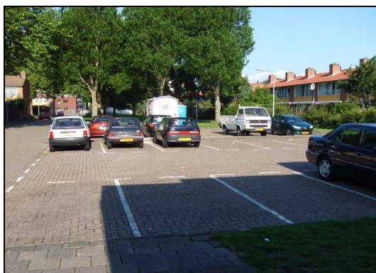
Wat gebeurt er als parkeerplaatsen verdwijnen ?