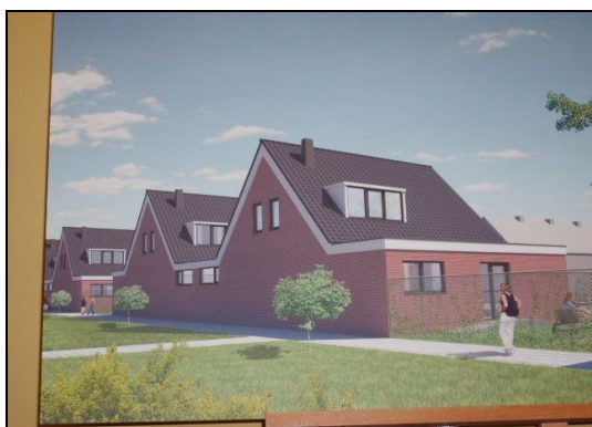
Valse weergave van de realiteit: op de voorgrond "onze tuinen zonder de schuttingen"

De bedoeling van de woningbouwverenigingen is, dat de groene strook achter de tuinen van de bewoners aan de Stockholmstraat en Athénestraat bebouwd worden met ieder 16 nieuwbouwwoningen. De woningbouwverenigingen willen een achterom looppad creëren voor de huidige bewoners. De breedte van dit looppad zou 1.20 meter worden. Direct grenzend aan dit pad zou een 9 meter hoge blinde muur komen te staan van de nieuwbouwwoningen. Volgens de bouwtekeningen zouden de bewoners nauwelijks last hebben van de schaduwval in de tuin van deze 9 meter hoge gevels. Wat er niet bij verteld wordt is hoe het uitzicht vanuit de tuin zal zijn.