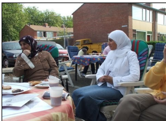
Allochtone bewoners willen meer speelplekken. Een nieuwe generatie bewoners in de buurt die niet altijd de financiële middelen hebben om naar een pretpark of om op vakantie te gaan.