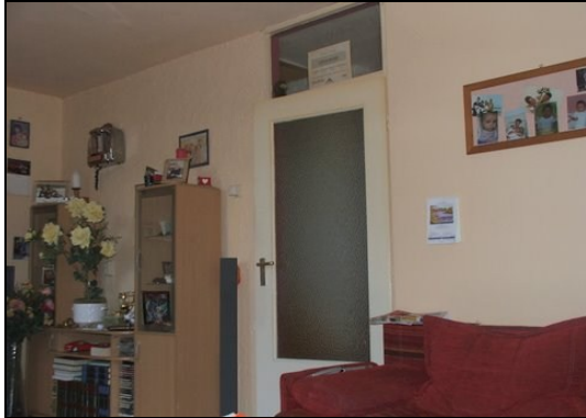
Woonkamer zonder direct straat contact.

Buurtbewoners zijn erg boos over de intimiderende houding die de woningbouwverenigingen hebben ten opzichte van de bewoners. Het project is nog niet in de gemeente raad besproken en artikel 19 procedure is niet opgestart. Deze groenvoorziening is er niet voor niets destijds aangelegd. De woonkamers van de woningen aan de Stockholmstraat en de Dublinstraat kijken uit op de groenstrook en er is geen direct straatcontact vanuit de woonkamer mogelijk.