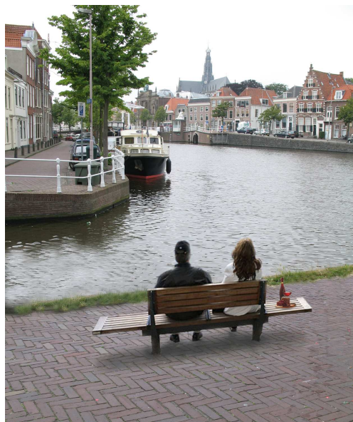
de Visschersbocht als terras van Haarlem