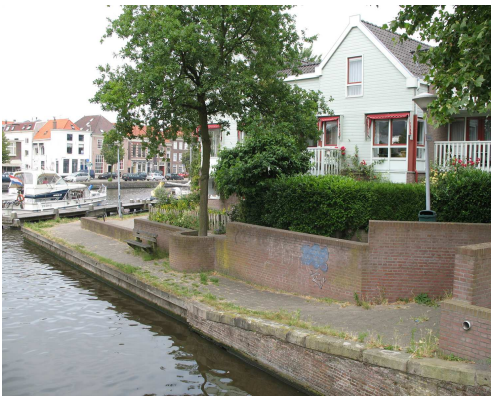
de huidige Visschersbocht

De Visschersbocht is misschien wel de plaats waar je het mooiste uitzicht over de stad hebt. De straatgroep Spaarnwouderstraat heeft zich ingezet voor het veranderen van de inrichting van de Visschersbocht. Het muurtje aan de waterkant verdwijnt en hiervoor in de plaats komen treden, zoiets als bij de Verfroller in het klein. Het wordt een mooi open overzichtelijke plek met bestrating en verlichting á la de Oude Groenmarkt. Heerlijk om te zitten en van het mooiste uitzicht van Haarlem te genieten.