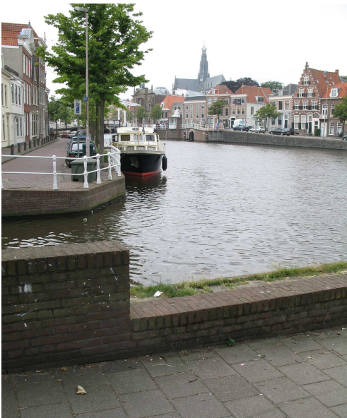
de huidige versnipperde Visschersbocht