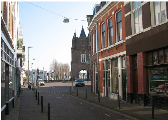
de huidige kale, versteende straat