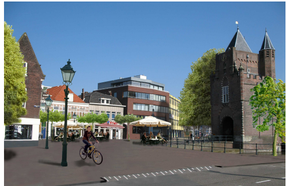
Visie van het plein met meer groen, passende verlichting, bestrating en pleininrichting