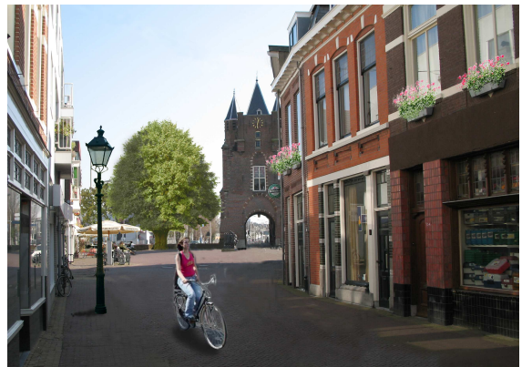
de straat voorzien van plantenbakken, bomen, passende straatverlichting en gelijkvloerse bestrating

Hier zijn twee voorbeelden hoe de omgeving van de Amsterdamse poort er nu uitziet en hoe het door herprofilering van het plein omgedoopt kan worden tot een mooi en aantrekkelijk plein. De meest opvallende zaken zijn: