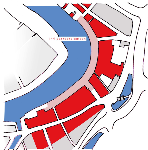
144 parkeerplaatsen aan de Houtmarkt gebruikt door bewoners uit de Spaarnwouderstraat, de Houtmarkt e.o.