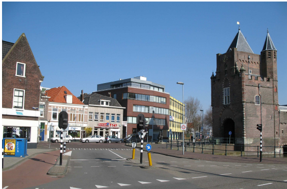
het huidige kale en onsamenhangende plein

Hieronder sferbeelden van een ander ingerichte omgeving rond de Amsterdamse poort en het omvormen van de bestemming van de Amsterdamse poort.