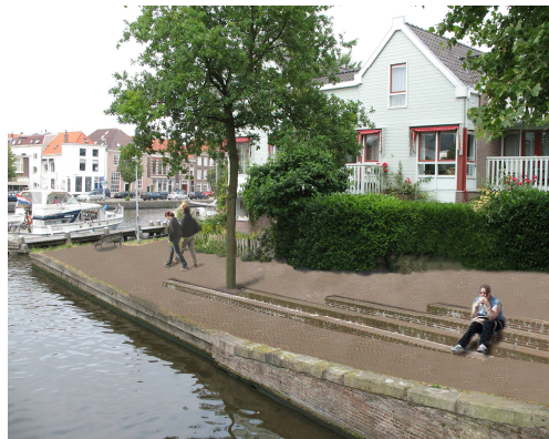
de Visschersbocht als terras van Haarlem