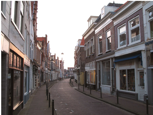
de huidige kale, versteende straat

Hieronder sfeerbeelden van de Spaarnwouderstraat hoe het nu is en hoe het kan zijn.