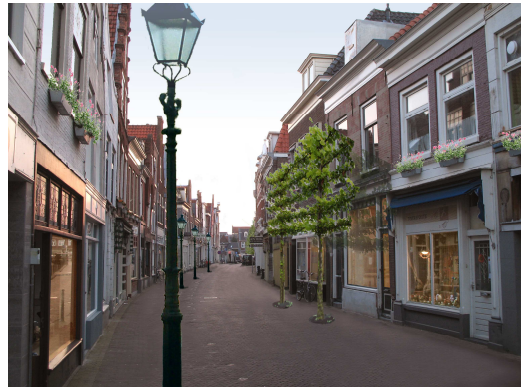
de straat voorzien van plantenbakken, bomen, passende straatverlichting en gelijkvloerse bestrating

Meest opvallende zaken zijn dat er een heel andere, gezellige sfeer uitstraalt die de historische sfeer recht doet. Door de aanwezigheid van: