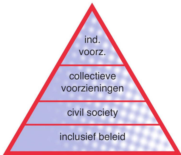
Figuur 1: Verschillende vormen van maatschappelijke ondersteuning

Burgers kunnen behoefte hebben aan maatschappelijke ondersteuning op verschillende levensgebieden, zoals wonen, ontmoeten, werk, inkomen, gezondheid en mobiliteit. Een dergelijke indeling van maatschappelijke ondersteuning biedt een ordening die aansluit bij de belevingswereld van mensen. Deze ordening correspondeert overigens voor een belangrijk deel met gangbare indelingen naar beleidsterreinen, maar bijvoorbeeld ook met de indeling van de programma's in de gemeentelijke programmabegroting (zie ook hoofdstuk 5).