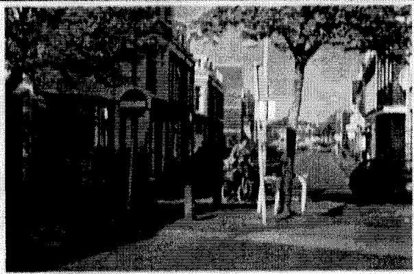
bocht Kennemerstraat/Frans Halsstraat' te krap voor tweerichtingsverkeer fietsers