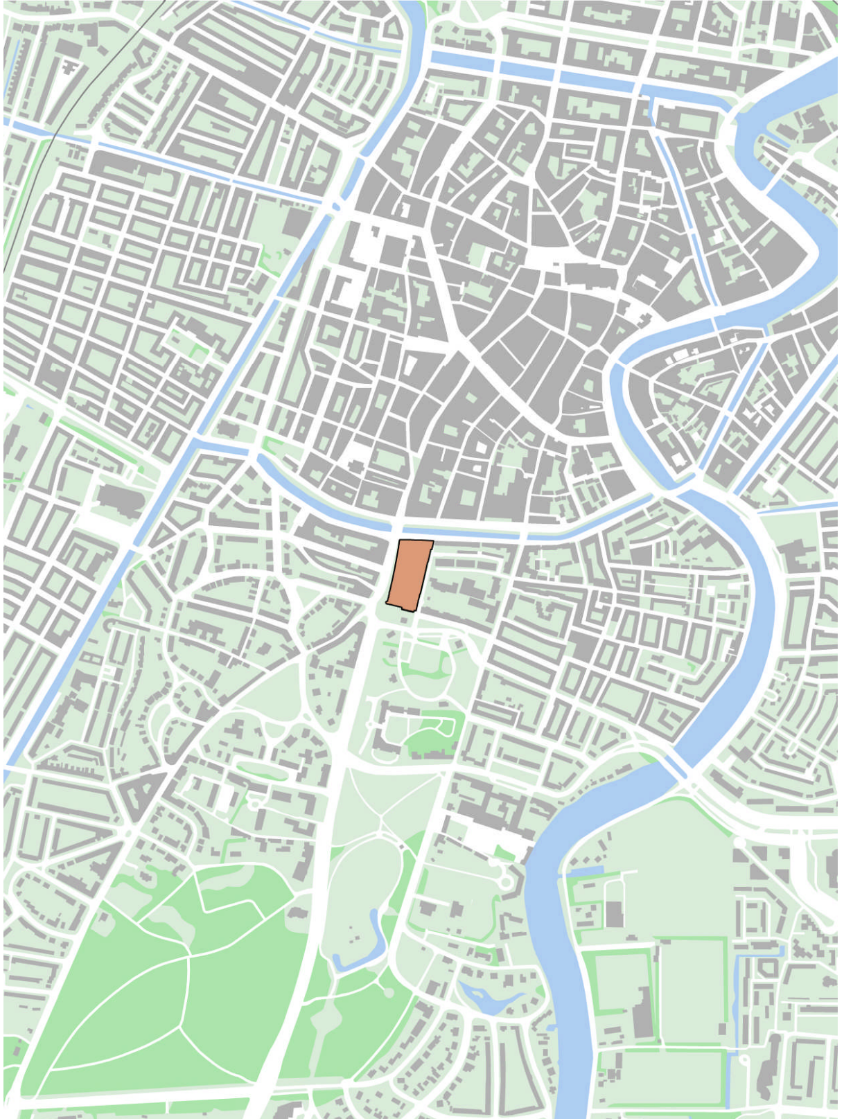
Afbeelding 1: Ligging van het bestemmingsplangebied