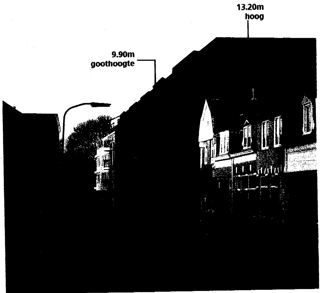
Voorbeeld 1: zicht op van Breementerrein vanuit de Schouwtsjeslaan.

Voordat wij allen als buurtbewoner een officieel bezwaar tegen een dergelijke massale bebouwing kunnen indienen, willen wij de gemeente nu al kenbaar maken dat wij een bestemmingsplan dat een dergelijke volumineuze bebouwing op van Breemen mogelijk maakt, ten sterkste afkeuren. Bovendien is het onjuist toekomstige bouw-