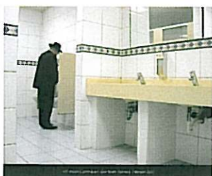
VIP Room Luchthaven Jose Marti, Havana, februari 2007