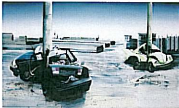
It Rocks Us So Hard Ho Ho Ho 1.0, 2002. Olieverf op doek, 160 x 280 cm.