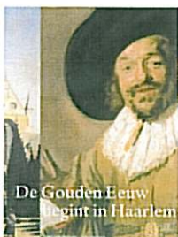
De Gouden Eeuw begint in Haarlem , Frans Hals Museum | NAI Uitgevers, 2008. Tekst Pieter Biesboer; 180 pagina's, vormgeving Bregt Balk.