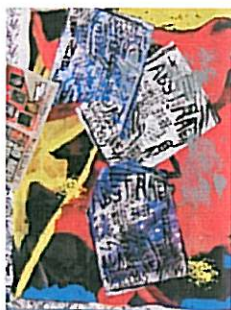
Zonder titel, 2008. Mixed media op paneel, 121,9 X 91,4 cm