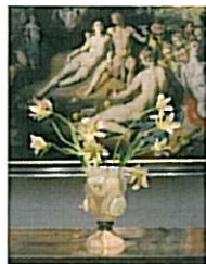
Bernard Heesen, Thetis vaas groot , 2009