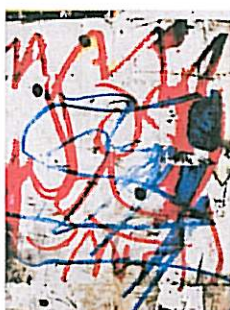
Zonder titel, 2008. Mixed media op paneel 121,9 X 91,4 cm