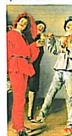
FRANS HALS MUSEUM MUSEUM Museumwandeling Kijken naar muziek

In het najaar van 2009 werden de museumwandelingen geherintroduceerd. In een nieuwe vorm (door Arthur Roeloffzen) verschenen na elkaar 'Kunst en kunstenaars uit Vlaanderen', 'De geschiedenis van het gebouw' en 'Kijken naar muziek'.