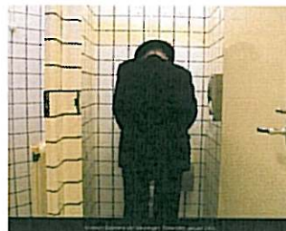
Museum Boijmans Van Beuningen, Rotterdam, januari 2006