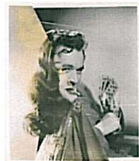
John Stezaker, Wedding (Film Portrait Collage) II , 2007