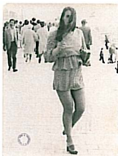
Zonder titel, circa 1965 - '75 Gelatine zilverdruk