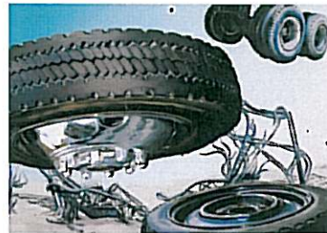
Killer Wheels 2.0, 2007. Olieverf op bedrukt vinyl, 120 x 180 cm. Privécollectie.

Dit was de eerste Nederlandse solotentoonstelling van de Duitse kunstenaar Dirk Skreber (Lübeck, 1961). Skreber brak internationaal door in de jaren '90 met figuratieve schilderijen van een door rampspoed getroffen wereld: overstroomde gebieden, wegzakkende huizen, op hol geslagen treinlocomotieven.