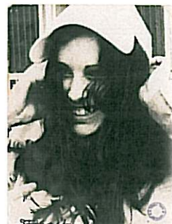
Zonder titel, circa 1965 - '75 Gelatine zilverdruk Collectie Gemeentemuseum Den Haag

Het werk van de onlangs overleden fotograaf Gerard Fieret (Den Haag, 1924 – 2009) is een inspiratiebron voor een toenemend aantal jonge kunstenaars en fotografen, vanwege zijn compromisloze en experimentele benadering van de realiteit en zijn speelse omgang met het klassieke thema van het vrouwelijk naakt. Eén van die jonge kunstenaars is Slater Bradley. Deze tentoonstelling bracht een twintigtal vrouwenportretten van Fieret uit de collectie van het Gemeentemuseum Den Haag bij elkaar. De selectie toont zijn directe omgang met zijn onderwerpen en wordt gekenmerkt door een lichtvoetige, terloopse erotiek.