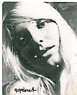
Zonder titel, circa 1965 - '75 Gelatine zilverdruk Collectie Gemeentemuseum Den Haag