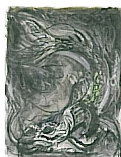
Zonder titel, 2009. Inkt op wand, 152,4 x 121,9 cm

Op de eerste Nederlandse solotentoonstelling van de Amerikaanse kunstenaar Josh Smith (1978) waren recente abstracte en figuratieve schilderijen te zien, alsmede een installatie die hij speciaal voor De Hallen Haarlem heeft ingericht.