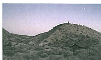
Nummer twaalf, 2009 Variations on a theme The king's gambit accepted, the number of stars in the sky and why a piano can't be tuned

Solotentoonstelling van de jonge, maar reeds internationaal gelauwerde Nederlandse kunstenaar Guido van der Werve (1977, Papendrecht).