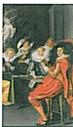
FRANS HALS MUSEUM MUSEUM Museumwandeling Kunst en kunstenaars uit Vlaanderen