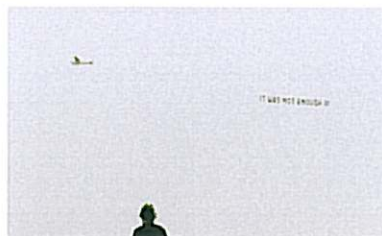
Nummer vier, 2005 I don't want to get involved in this I don't want to be part of this Talk me out of it 35 mm film, 11'49 minuten