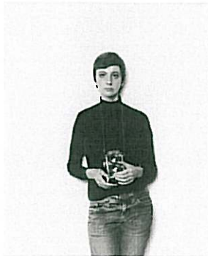
Gillian Wearing, Me as Arbus , 2008.