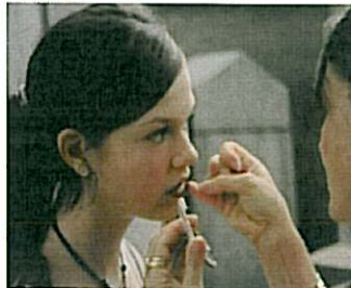
My conclusion/My necessity, 2006 Single channel video met geluid, 6'35 minuten Courtesy of Team Gallery, New York