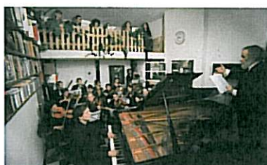
Nummer zes, 2006 Steinway grand piano Wake me up to go to sleep And all the colors of the rainbow 35 mm film, 17'09 minuten