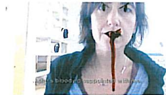
Erik van Lieshout, Sex is Sentimental , 2009