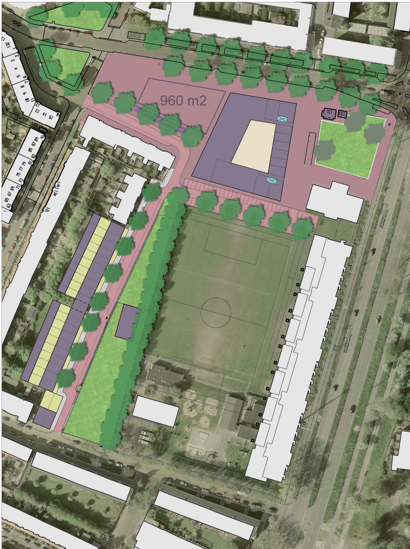
Totaalbeeld stedenbouwkundig ontwerp