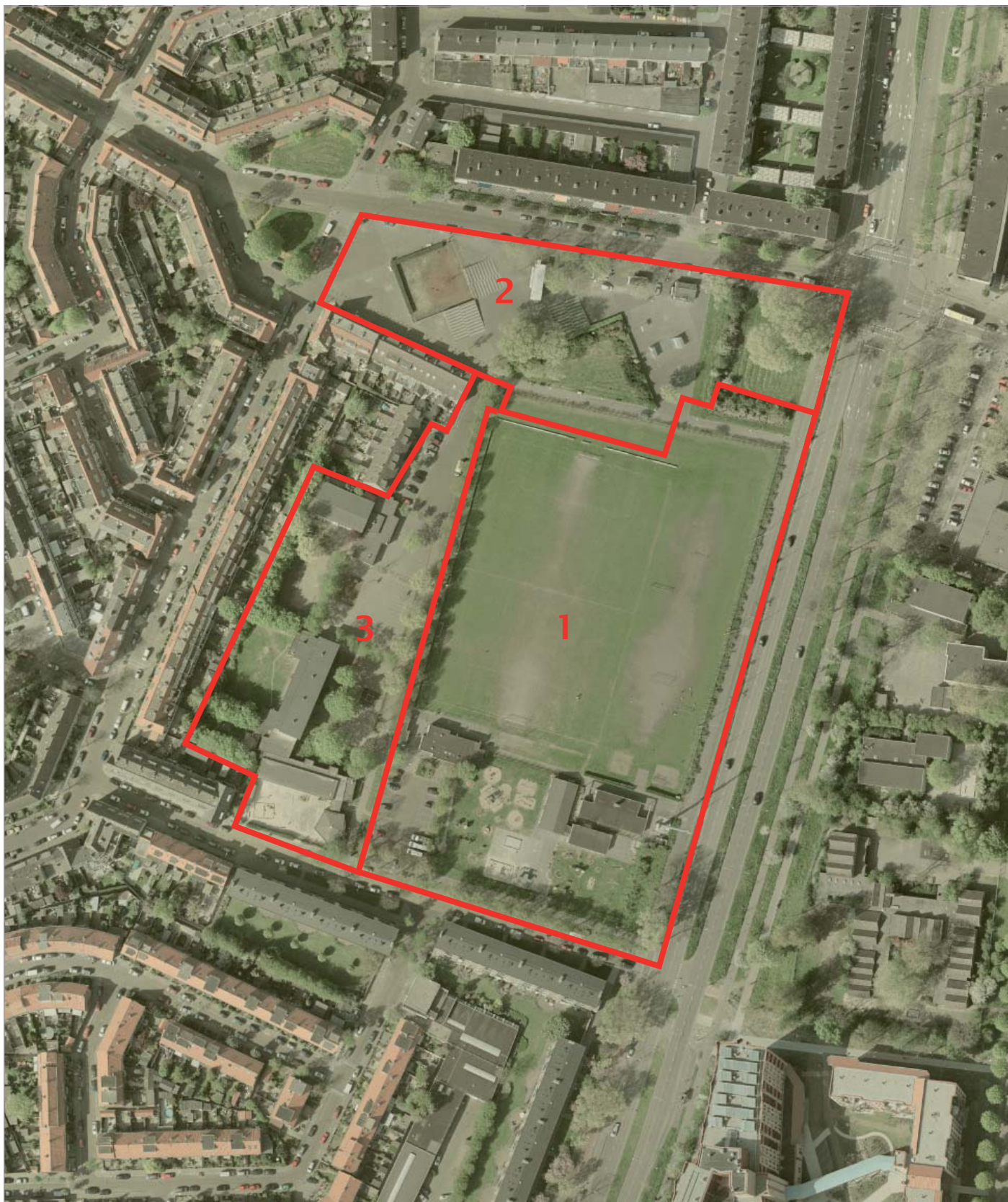
Fasering "Woningbouw rond DSK"