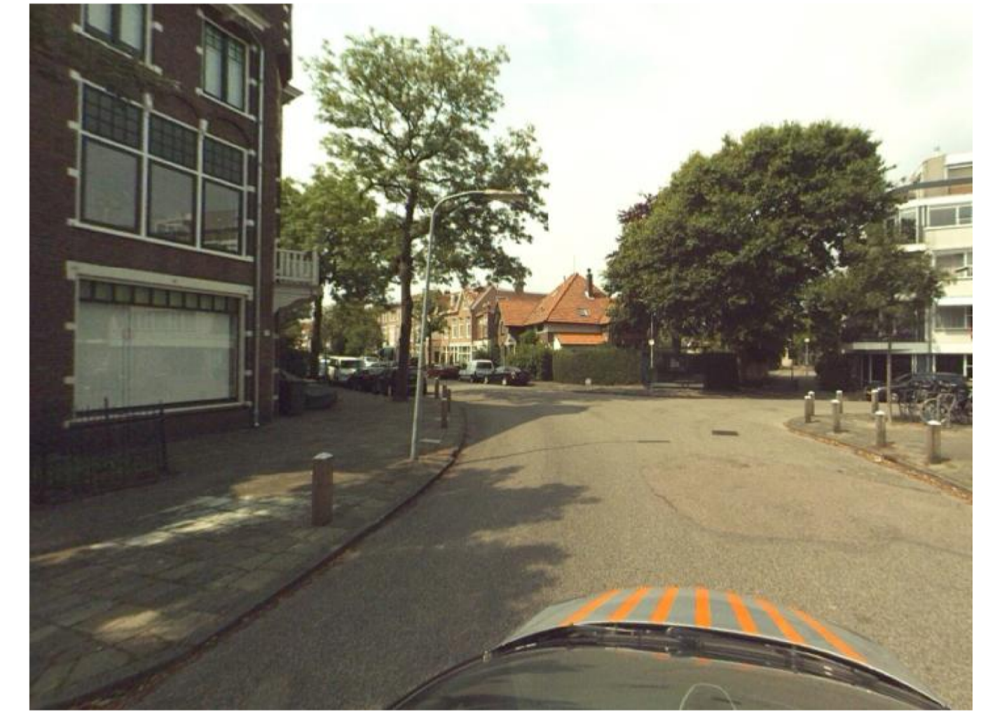
huidige situatie kruispunt Schouwteslaan met Uit Den Bosstraat