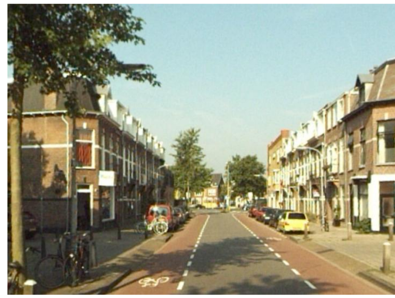
voorbeeld "30 met bus" inrichting