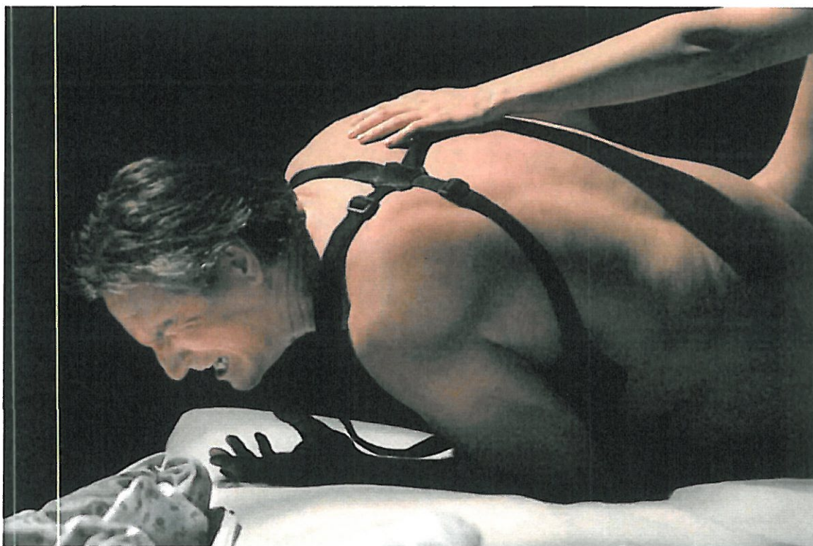
Blasted – Toneelschuur Producties, foto Sanne Peper

Wij bedanken met name het VSB Fonds voor hun ruimhartige ondersteuning van ons productiehuis.