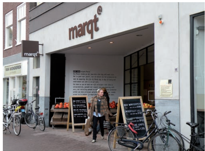
Fair trade: veel producten rechtstreeks afgenomen van producent.

Simon Lévelt zet zich al jarenlang in voor het verduurzamen van de koffie- en theeketen. Zij zorgt voor betere leef- en werk-omstandigheden van de arbeiders op koffieplantages en bevordert de biologische teelt (inmiddels is 55% van de koffie en 67% van de thee biologisch). Daarnaast hanteert het bedrijf de richtlijnen voor eerlijke handel. Ook kijkt Simon Lévelt naar verduurzaming van verpakkingen, energiezuinig transport, gebruik van groene stroom en de toepassing van duurzame energie in het magazijn.