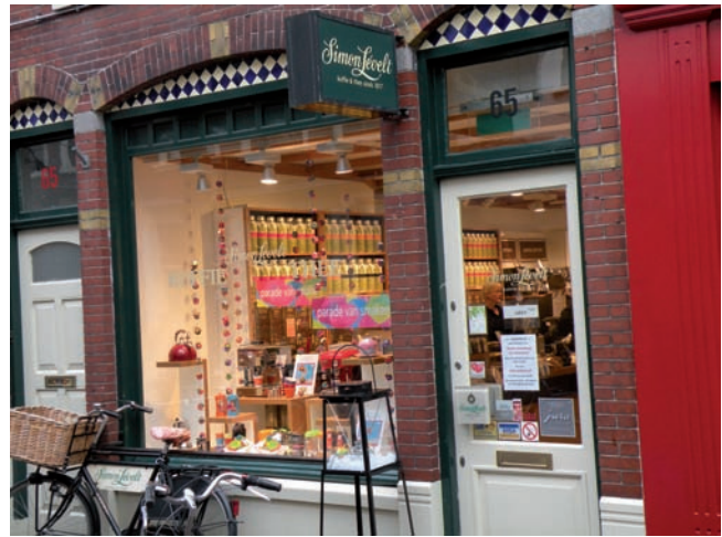
Winkel van Simon Lévelt.

NPSP maakt composietmateriaal van natuurvezels. Als enige in Nederland gebruikt NPSP, naast glasvezels, ook natuurlijke grondstoffen zoals vlas, jute, kokos en hennep. Natuurlijke vezels vergen minder energie om te produceren en minder chemicaliën om zich aan de hars te hechten. Omdat deze vezels meestal lichter zijn dan glasvezel, levert dit bij toepassingen in bijvoorbeeld treinen of auto's aanzienlijke besparingen in brandstof en CO 2 -uitstoot op. NPSP produceert haar producten met 100% groene stroom. Natuurlijke vezelversterkte composieten kunnen na de gebruiksfase door verbranding in groene stroom worden omgezet.