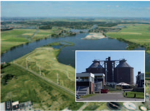
Schoteroog en AWZI leveren groen gas.

energie-adviezen verstrekt aan bedrijven en de samenwerking tussen bedrijven bevordert. De een heeft immers vaak een warmteoverschot en de ander een -tekort.