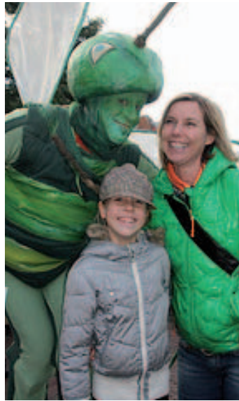
De Groene Mug, icoon van Haarlem.

De stad verandert in een duurzame richting als organisaties veranderen. Organisaties veranderen als mensen veranderen. Mensen veranderen alleen als ze daar goede motieven voor hebben. Er is een krachtig ontstekingsmechanisme nodig om deze drietrapsraket in de lucht te krijgen en houden. Het heet leiderschap. Een krachtige leidende coalitie brengt Haarlem Duurzaam tot leven en geeft er richting aan. Dit is minder een kwestie van controle en top-down management dan van verleiden, inspireren, stimuleren en verbinden. Ons uitgangspunt is dat duurzame ontwikkeling waar mogelijk vrijwillig en slechts waar nodig verplichtend moet zijn.