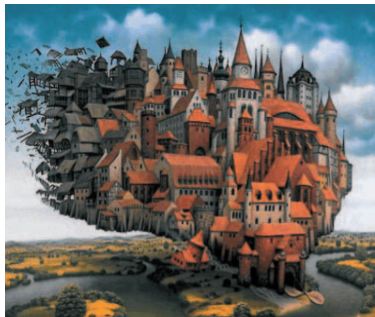
'Vaste kernwaarden' Werk van Jacek Yerka

Wat dat concreet betekent, is in iedere situatie anders. Het hangt af van de omstandigheden. In die zin is duurzame ontwikkeling een bewegend doel. Er bestaat geen recept voor