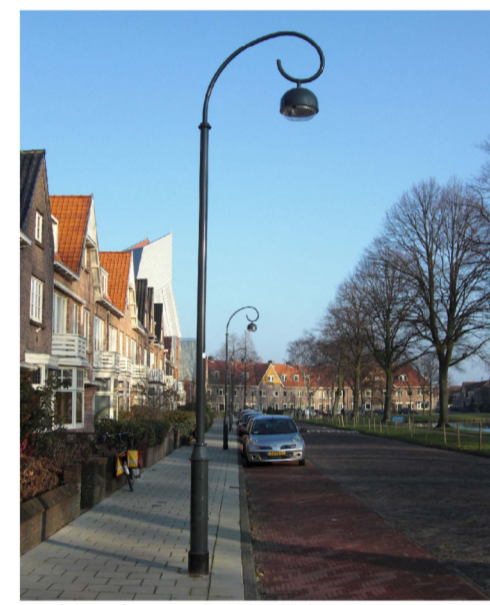
Patrimoniummast (LPH = 5m)