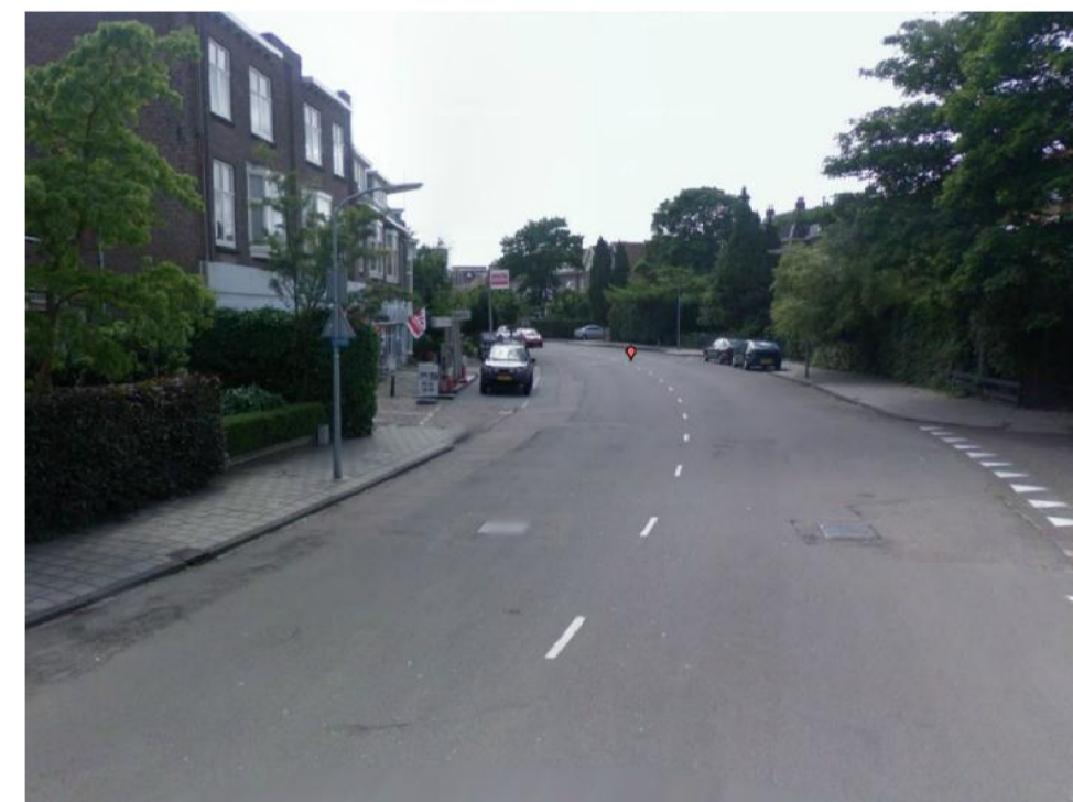
huidige situatie Julianalaan