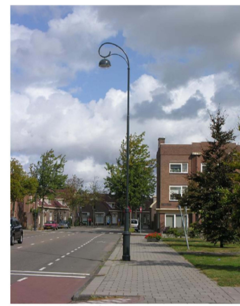
Spaarnemast (LPH = 8m)