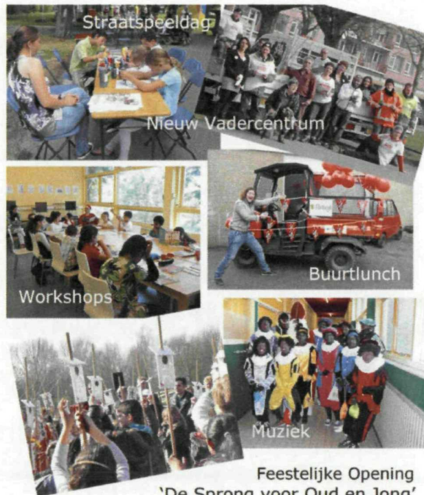
Opening Vadercentrum & De Sprong

Feestelijke Opening 'De Sprong voor Oud en Jong' woensdag 1 juni 2011 om 12.00u