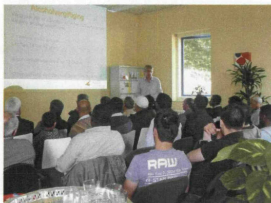
Opvoedingsvoorlichting Alcohol & Drugs