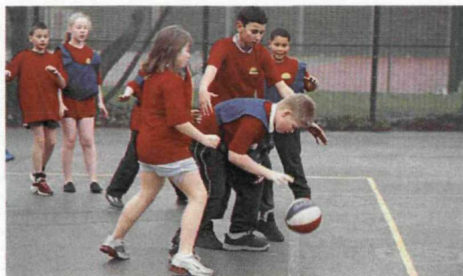
Sporten Vader & Kind