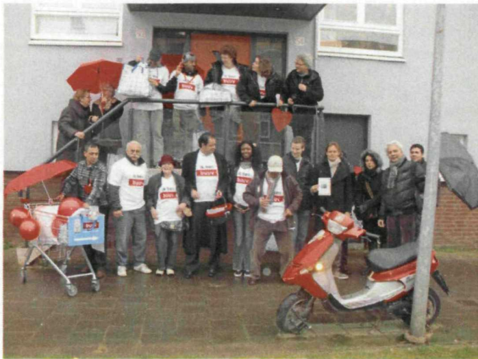
Valentijnsactie 'Hart voor de Buurt'