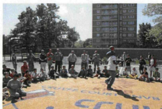
Voetbal Vader & Kind