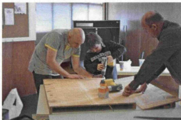
Knutselen Vader & Kind