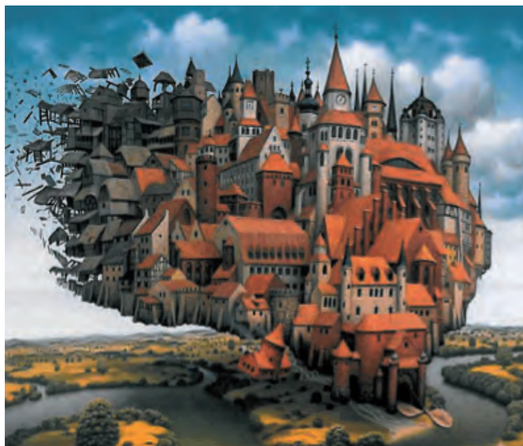
'Vaste kernwaarden' Werk van Jacek Yerka

Wat dat concreet betekent, is in iedere situatie anders. Het hangt af van de omstandigheden. In die zin is duurzame ontwikkeling een bewegend doel. Er bestaat geen recept voor