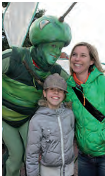
De Groene Mug, icoon van Haarlem.

De stad verandert in een duurzame richting als organisaties veranderen. Organisaties veranderen als mensen veranderen. Mensen veranderen alleen als ze daar goede motieven voor hebben. Er is een krachtig ontstekingsmechanisme nodig om deze drierupsrakete in de lucht te krijgen en houden. Het heet leiderschap. Een krachtige leidende coalitie brengt Haarlem Duurzaam tot leven en geeft er richting aan. Dit is minder een kwestie van controle en top-down management dan van verleiden, inspireren, stimuleren en verbinden. Ons uitgangspunt is dat duurzame ontwikkeling waar mogelijk vrijwillig en slechts waar nodig verplichtend moet zijn.