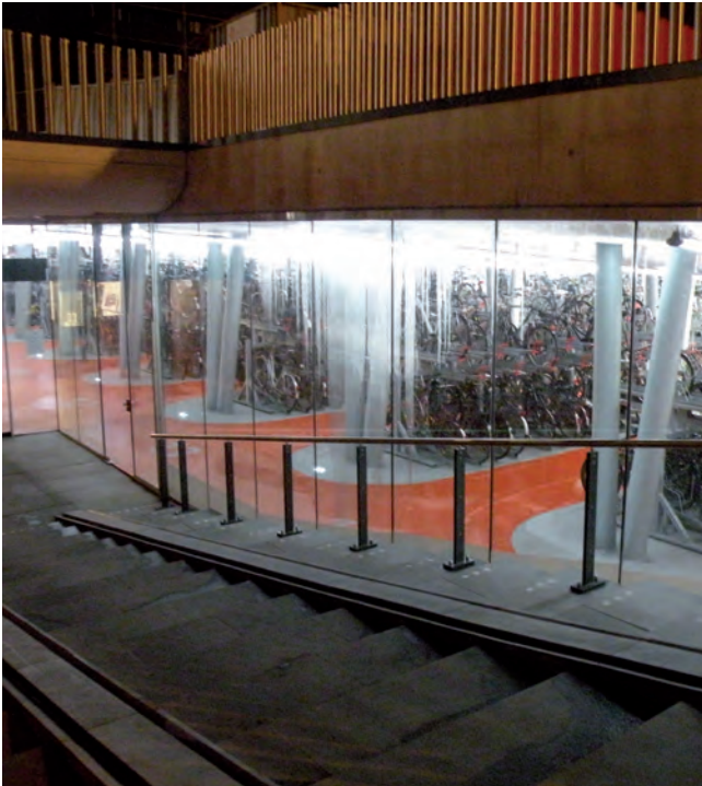
Het station beschikt over de grootste ondergrondse fietsparkeergarage van Europa.

Haarlem is geen groentje op het gebied van duurzame ontwikkeling. Er gebeurt al heel veel.