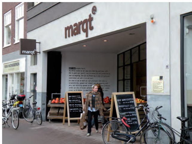
Fair trade: veel producten rechtstreeks afgenomen van producent.

Simon Lévelt zet zich al jarenlang in voor het verduurzamen van de koffie- en theekeeten. Zij zorgt voor betere leef- en werk-omstandigheden van de arbeiders op koffieplantages en bevordert de biologische teelt (inmiddels is 55% van de koffie en 67% van de thee biologisch). Daarnaast hanteert het bedrijf de richtlijnen voor eerlijke handel. Ook kijkt Simon Lévelt naar verduurzaming van verpakkingen, energiezuinig transport, gebruik van groene stroom en de toepassing van duurzame energie in het magazijn.