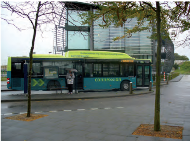
Bussen rijden op groen gas.

Bedrijven lopen (inter)nationaal voorop. Zo is datacentrum EvoSwitch door het Duitse ministerie van Milieu uitgeroepen tot een van de elf meest energiezuinige datacenters in de wereld.