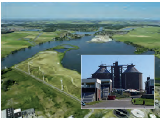
Schoterog en AWZI leveren groen gas.

stand te brengen. Er is daarnaast dringend behoefte aan ‘makelaars’ die projecten van idee naar uitvoering kunnen brengen door net zo lang te duwen, te trekken, sleuren en desnoods zeuren tot het project is gerealiseerd. Een goed voorbeeld van zo’n makelaar is de Energiecoach die gratis energie-adviezen verstrekt aan bedrijven en de samenwerking tussen bedrijven bevordert. De een heeft immers vaak een warmteoverschot en de ander een -tekort.