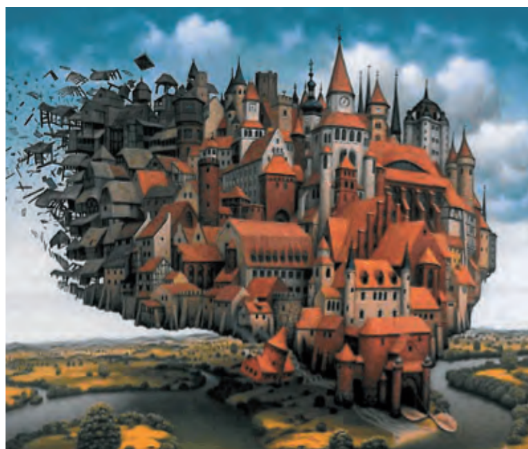
'Vaste kernwaarden' Werk van Jacek Yerka

Wat dat concreet betekent, is in iedere situatie anders. Het hangt af van de omstandigheden. In die zin is duurzame ontwikkeling een bewegend doel. Er bestaat geen recept voor