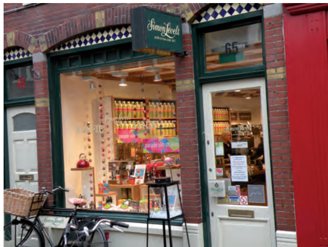
Winkel van Simon Lévelt.

NPSP maakt composietmateriaal van natuurvezels. Als enige in Nederland gebruikt NPSP, naast glasvezels, ook natuurlijke grondstoffen zoals vlas, jute, kokos en hennep. Natuurlijke vezels vergen minder energie om te produceren en minder chemicaliën om zich aan de hars te hechten. Omdat deze vezels meestal lichter zijn dan glasvezel, levert dit bij toepassingen in bijvoorbeeld treinen of auto's aanzienlijke besparingen in brandstof en CO 2 -uitstoot op. NPSP produceert haar producten met 100% groene stroom. Natuurlijke vezelversterkte composieten kunnen na de gebruiksfase door verbranding in groene stroom worden omgezet.