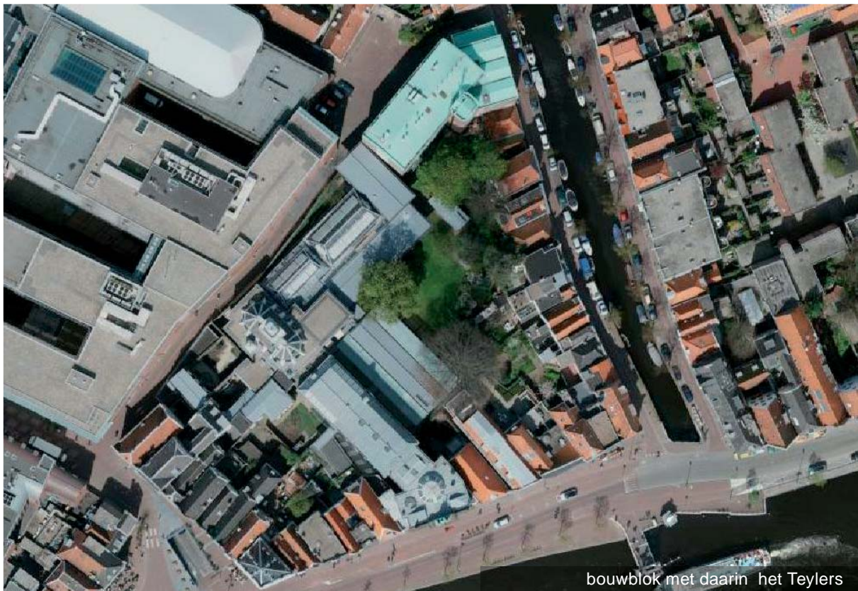
bouwblok met daarin het Teylers

Startpunt bij de zoektocht naar de grenzen van de invloedssfeer van Teylers is het zicht vanaf het museum zelf. Het hoogste punt van het Teylers Museum is de sterrenwacht. Dit is een klein gebouwtje dat gebouwd is boven de ovale zaal. Vanuit de sterrenwacht is er een heel vrij uitzicht op Haarlem en zijn omgeving. Van de karakteristieke binnenstad van Haarlem tot de buitenwijken met meer grootschalige bebouwing daaromheen tot aan de duinen, de hoogovens van IJmuiden en Schiphol. Dit hele gebied is de ruimere context van het museum, zijn habitat. Dit is echter geen bufferzone. Het bepaalt de plaats van een object, maar is er niet direct van invloed op. Ontwikkelingen hier, hoe grootschalig ook, vormen geen bedreiging voor de cultuurhistorische waarden van het Teylers Museum.