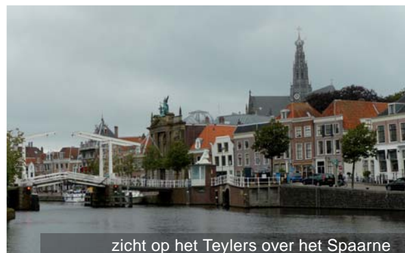
zicht op het Teylers over het Spaarne

Aan het Spaarne springt de gevel van Teylers, zowel wat schaal al verschijningsvorm betreft er onmiskenbaar uit. De openheid van het Spaarne zorgt ervoor dat de gevel ook vanaf grote afstand is te zien. Het Spaarne is zo'n belangrijke drager van de identiteit van Haarlem, met lange zichtlijnen, bruggen en de gevel historische bebouwing, waaronder het Hodshonhuis dat hier de invloed van het Teylers op zijn omgeving en vice versa het grootst is. Hier ligt het Teylers als een toonaangevend element in de gevelwand omringd door historische bebouwing met op de achtergrond de Bavokerk.