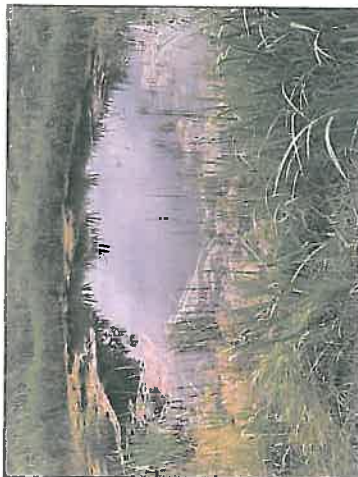
natuur krijgt weer een kans

Het Stadsnatuurpark als 'groedemod'! In het bestemmingsplan is de dertig meter brede strook grond ten noorden van de Brouwersvaart 'positief bestemd' als Stadsnatuurpark. Dit betekent dat deze strook, nadat de Provincie het Bestemmingsplan heeft goedgekeurd, aangekocht kan worden om het te richten als Stadsnatuurpark. Dit gebied is ongeveer één hectare groot. Om het Stadsnatuurpark in de toekomst zonder ingewikkelde planologische procedures uit te kunnen breiden heeft van de Zijlweg een zogenaamde 'wijzigingsbevoegdheid' gekregen. Dit schept ruimte om op basis van particulier initiatief het Stadsnatuurpark te vergroten. Mogelijkheid daarbij is dat de Gemeente over een aantal jaar nog extra grond aankoopt om het park uit te breiden.