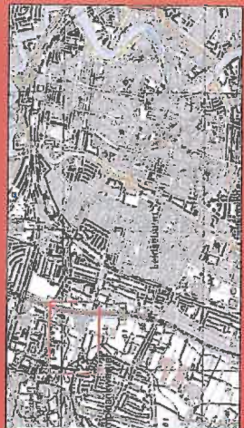
Stadsnatuurpark van Stadsnatuurpark ten oosten van het centrum van Haarlem