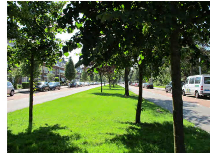
Orionweg met middenberm