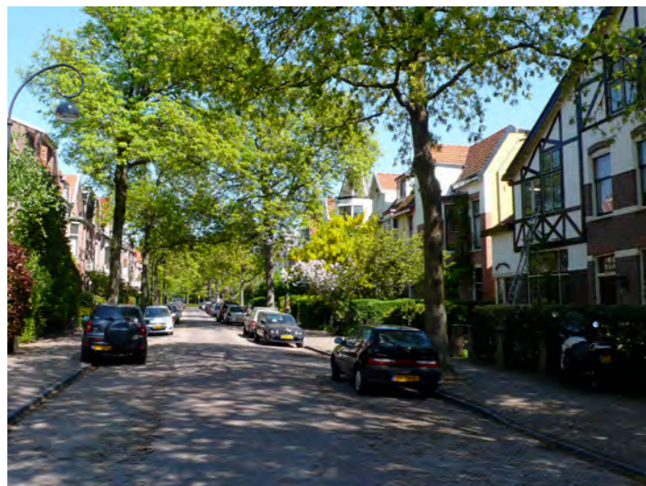
villa's in de Koninginnebuurt