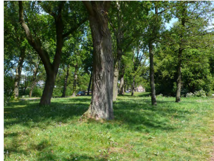
zicht naar begraafplaatsen, Haarlem-Noord