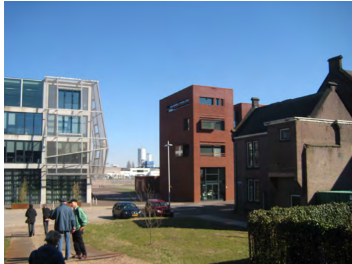
Historische panden en nieuwbouw langs het Spaarne