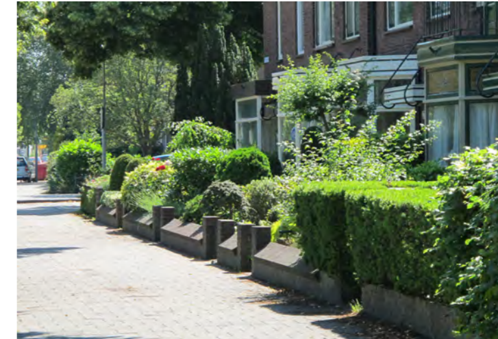
karakteristieke overgang tussen tuin en straat