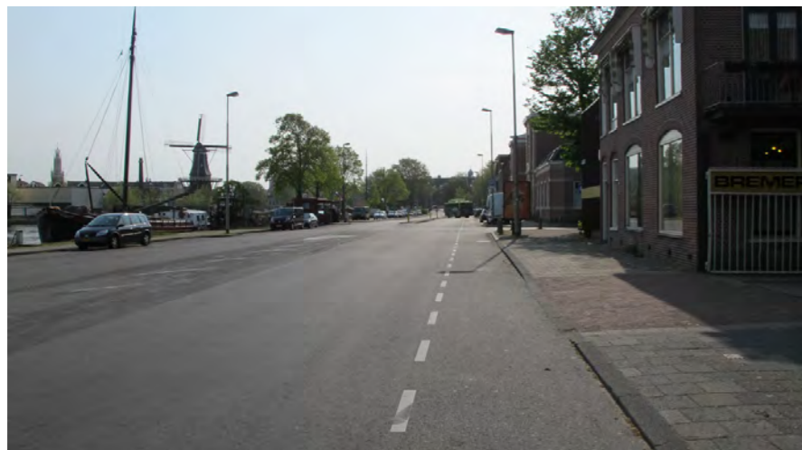
inrichting van het openbaar gebied, niet des binnenstads