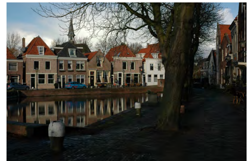
zicht op de Kolk