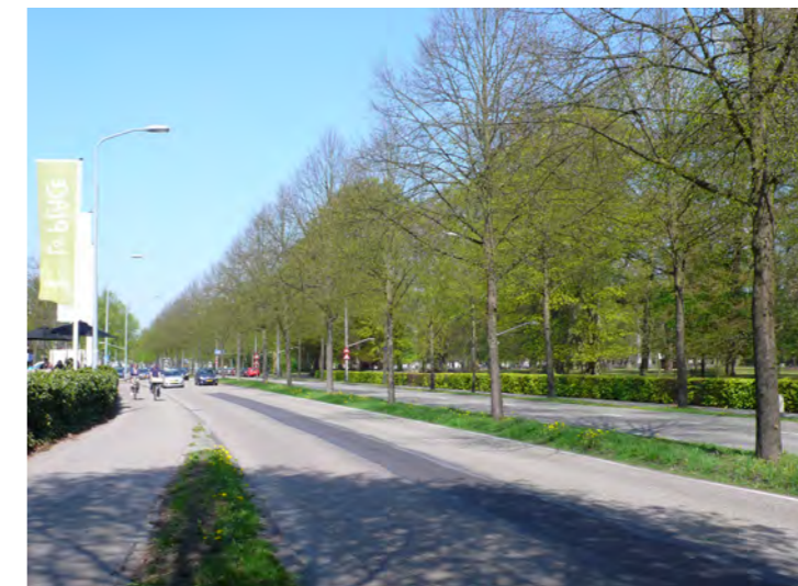
gezicht op de Dreef, bij Dreefzicht