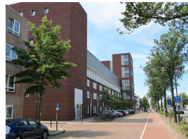
complex 'De Triangel'