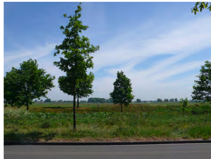
zicht op het onbebouwde gebied