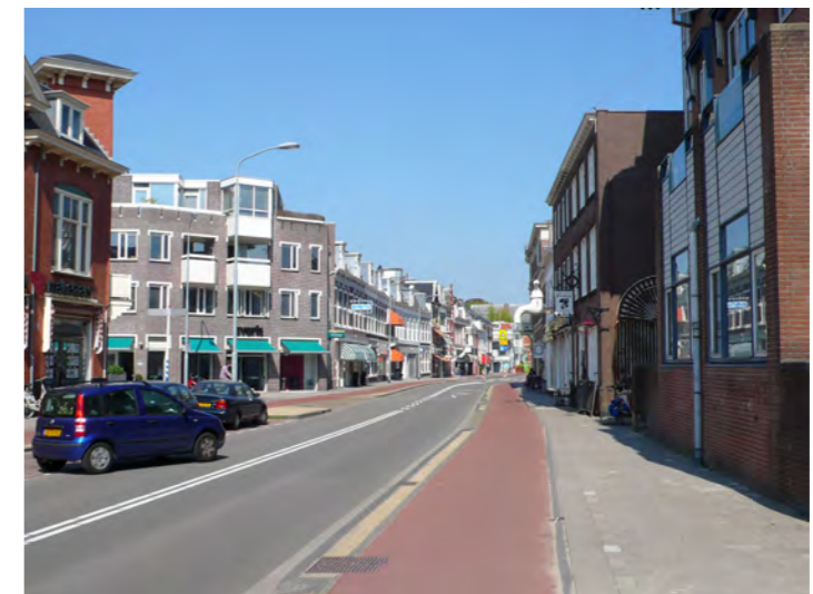
Wagenweg met fietspad