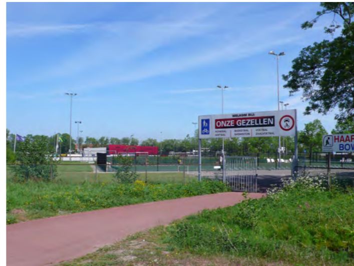
Van der Aart-sportpark