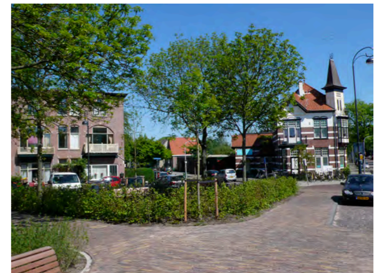
villa's in de Koninginnebuurt