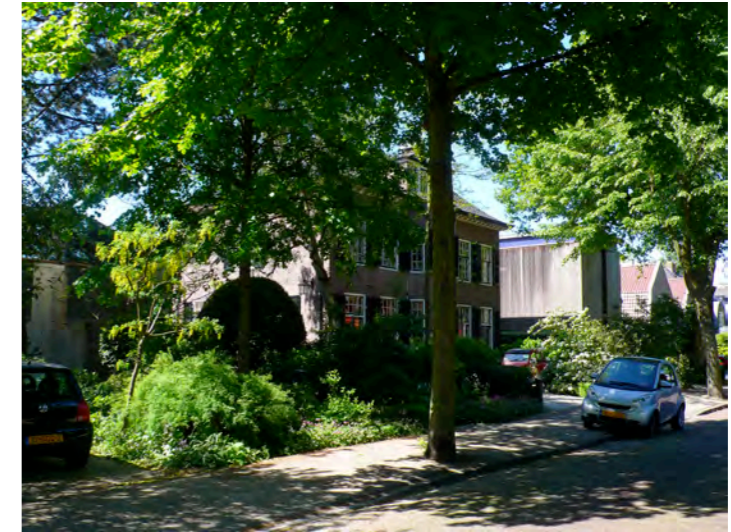
individuele villa's, Haarlem Zuid