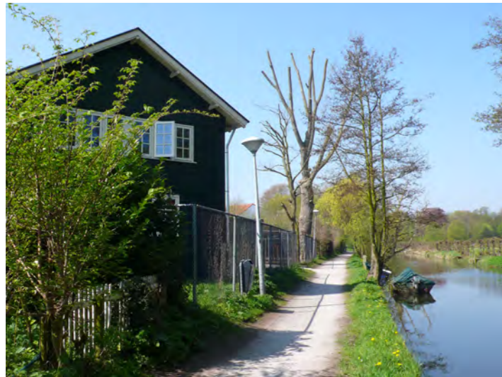
woonbebouwing in het binnenduintrandgebied