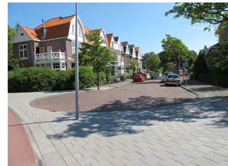
meer vanzelfsprekende aansluiting