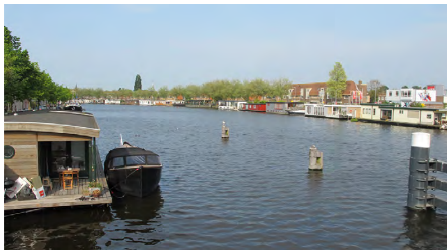
zicht over het Spaarne, richting Slachthuisbuurt