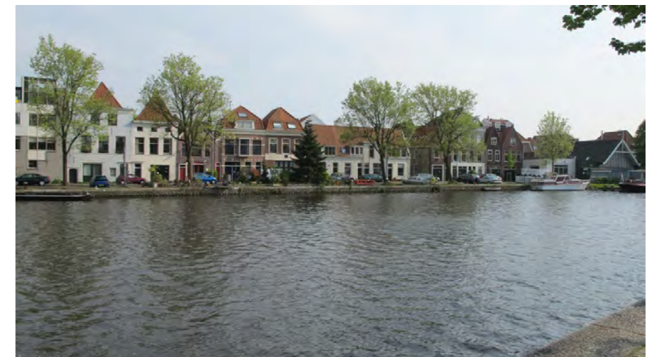
gevelbeeld langs het Binnen Spaarne, met informele inrichting van de kade oever