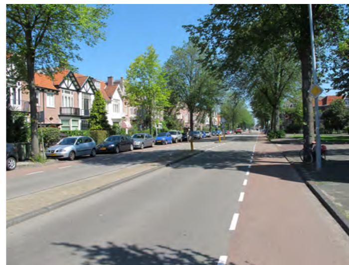
royaal profiel met groene voortuinen