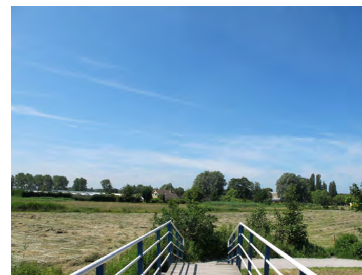
zicht naar het Ramplaankwartier