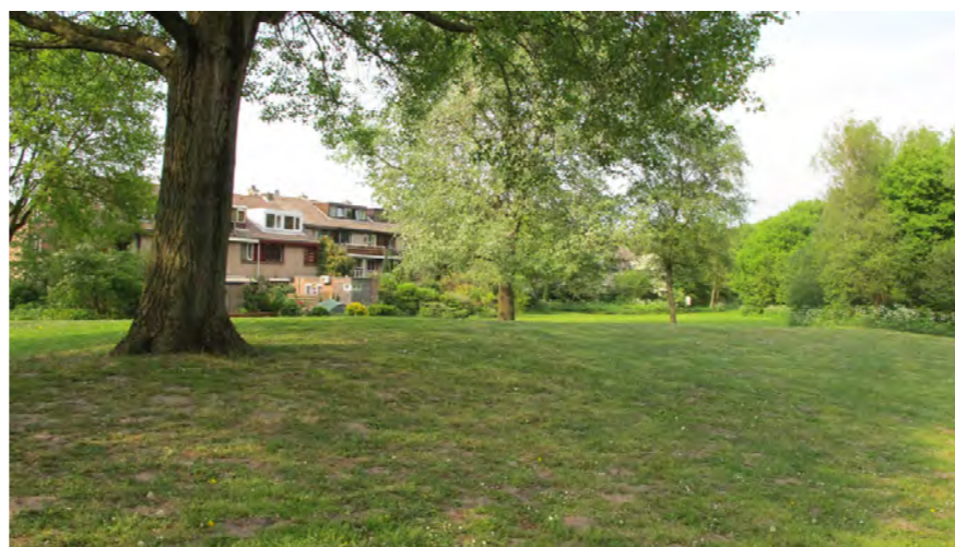
bebouwing langs parkstrook Molenwijk