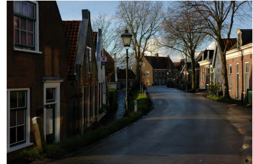
panden aan de noordzijde van de Spaarndammerdijk staan hoger

De Spaarndammerdijk is geen onderdeel van de in het Bomenbeleidsplan omschreven hoofdboomstructuur.