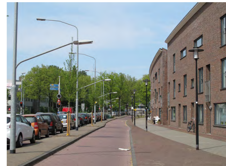
overgang buurt naar structuurlijn; conflict in verlichting