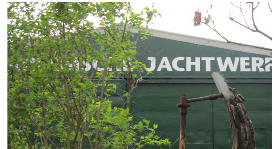
Spaarne-gerelateerde ficties, o.a. jachtwerf