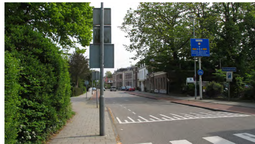
Zijlweg bij Overveen