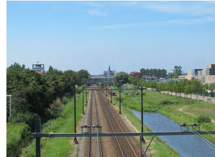
zicht op de St. Bavo; beëindiging waterloop

De Zuid-Schalkwijkerweg wordt beschreven bij de waterloop 'Tuinstad aan het Spaarne'.