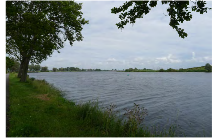
uitzicht over het Buiten Spaarne bij Spaarndam