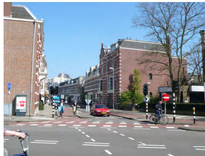
stedelijke wand in de rooilijn