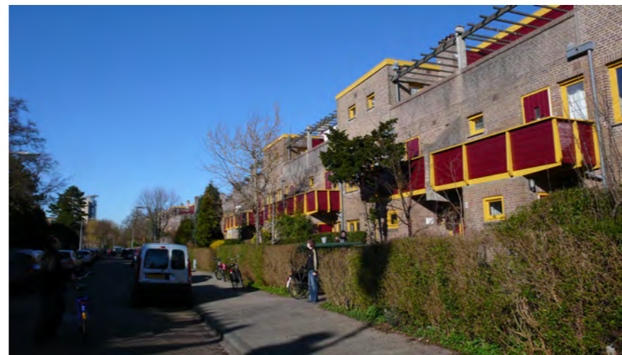
Tuinwijk, Haarlem Zuid