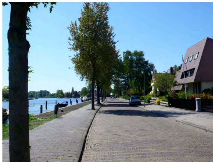
woningen langs het Spaarne