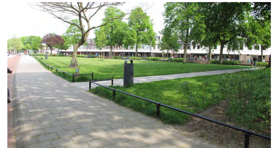
Julianapark als beëindiging Cronjéstraat