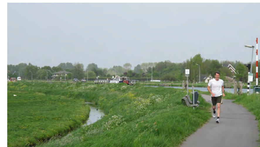
recreatieve route langs de dijk