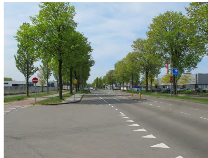
kenmerkend profiel met bomen in grasberm