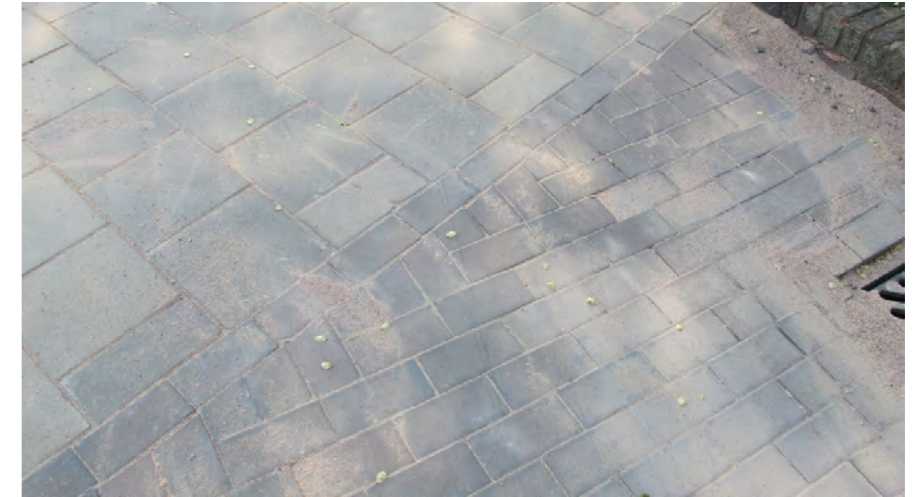
materiaalovergang op de Spaarndamseweg