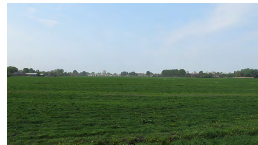
beeld bebouwing Zwemmerslaan vanaf de Ringdijk