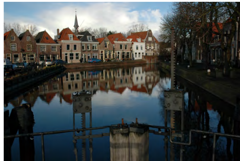
de Kolk in Spaarndam