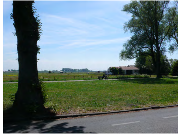
zicht op het landschappelijke groen aan de oostrand van Haarlem