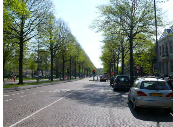
Dreef, bij Provinciehuis

De route is in het Bomenbeleidsplan 2009-2019 onderdeel van de hoofdboomstructuur. De aanwezigheid van de Hout vormt daar de basis voor. De bomenstructuur wordt gevormd door minimaal twee rijen lindenbomen, op sommige plekken uitgebreid met lindenbomen in de middenberm aangevuld met bomen in de zijbermen. Hierdoor ontstaat een monumentaal beeld met vier rijen bomen. Het kunstwerk de Lindenbogen langs de Fonteinlaan is een groen accent in het profiel. Met de opeenvolging van verschillende groene ruimtes van bos tot park tot villatuin is een lommerrijk, groen en afwisselend beeld ontstaan.