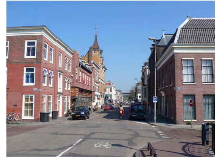
Nieuwe Gracht, zicht op de binnenstad