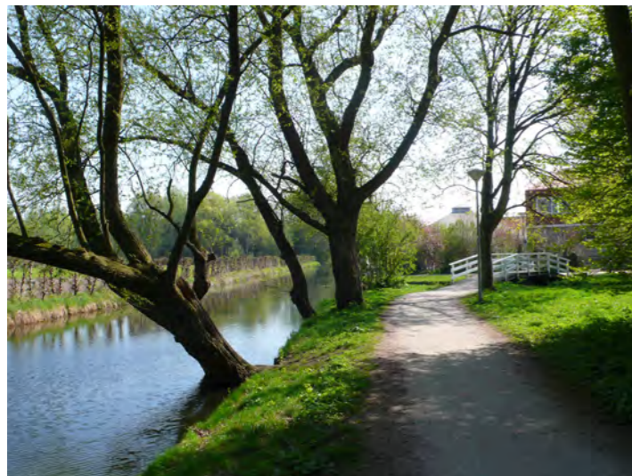
woonbebouwing en groenstructuur