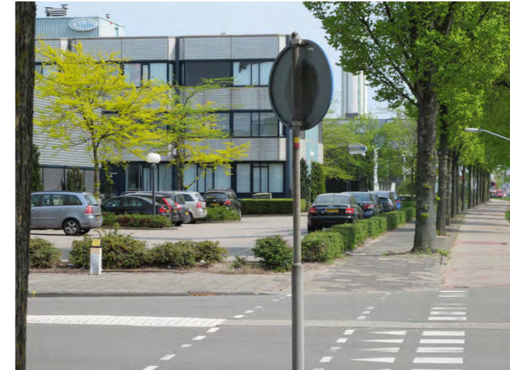
overgang openbaar-privé met haag

De Oudeweg is in het Bomenbeleidsplan 2009-2019 onderdeel van de hoofdboomstructuur. Op de Oudeweg zijn de royale doorgaande grasbermen naast de bomen bepalend voor het groene karakter van de weg.