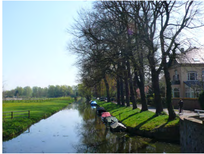
villa's in het binnenduintrandgebied