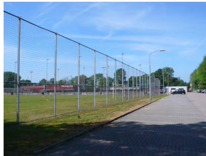
Van der Aart-sportpark