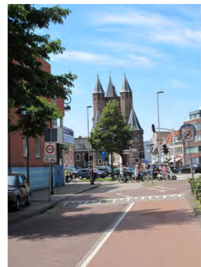
zicht op de Amsterdamsepoort