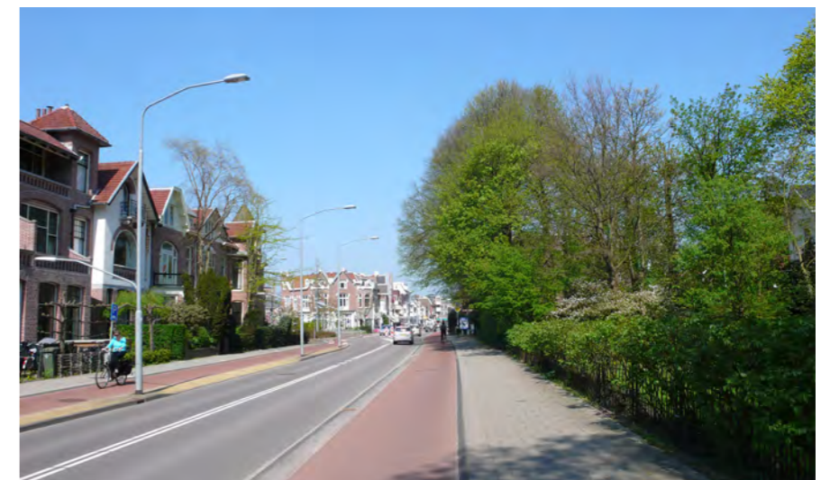
villagegebied met monumentaal groen