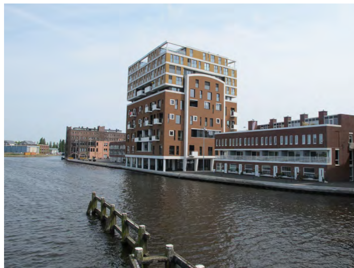
nieuwbouw op voormalig Droste-terrein