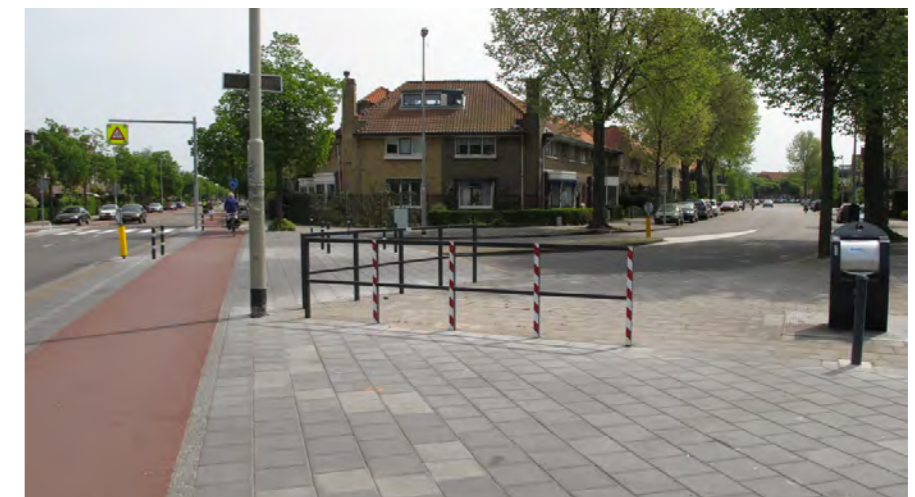
meer ontwerpaandacht voor aansluiting zijstraten