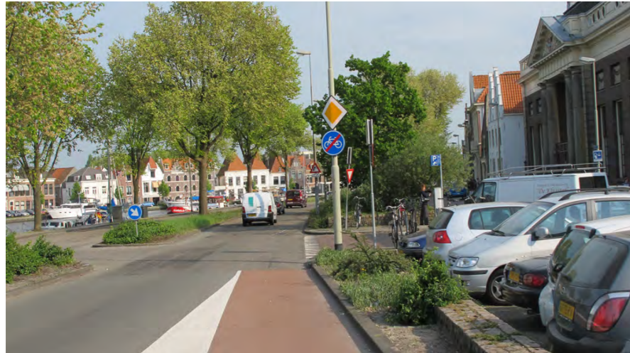
verkeerskundige inrichting langs het Binnen Spaarne