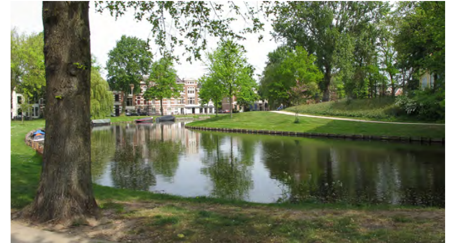
groene oevers met monumentale bomen

De bolwerken zijn in het Bomenbeleidsplan 2009-2019 onderdeel van de hoofdboomstructuur.