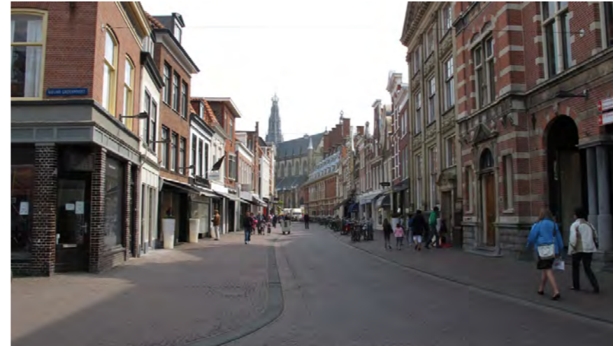
Zijlstraat in Centrum met uitzicht op St. Bavo

De Zijlweg is in het Bomenbeleidsplan 2009-2019 onderdeel van de hoofdboomstructuur. De Zijlweg-Oost heeft twee rijen bomen in de parkeerstrook. In de Zijlweg-West ontbreekt aan de zuid-zijde de bomenrij.