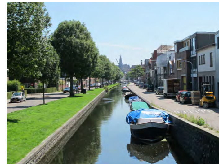
Brouwersvaart met zicht op St. Bavo

De Brouwersvaart is in het Bomenbeleidsplan 2009-2019 onderdeel van de hoofdboomstructuur. De Houtmankade en het Houtmanpad vormen een mooie verbinding met het veenweidegebied en de landgoederen. Een meer landelijke inrichting met elzensingels en ruige grasbermen is hier op zijn plaats.