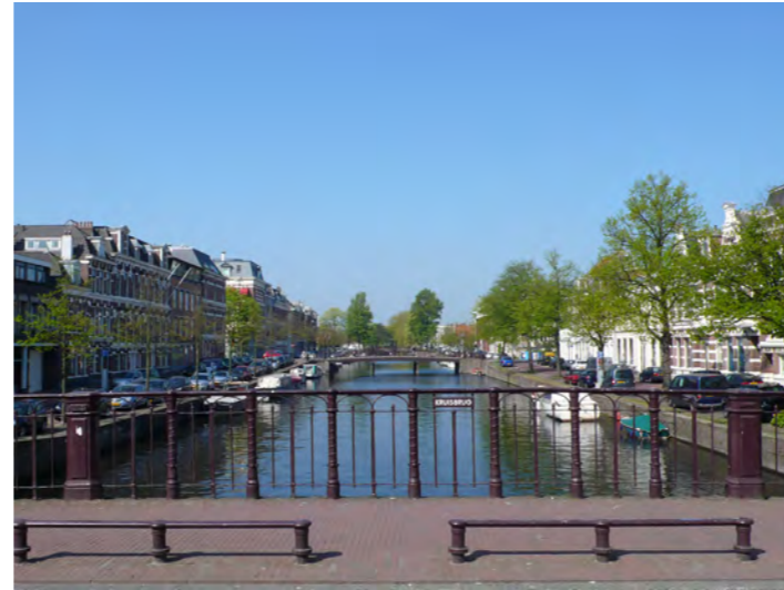
zicht over de Nieuwe Gracht