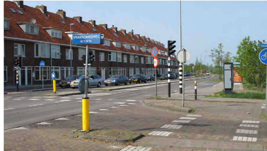
kromming in gevellijn

De route is in het Bomenbeleidsplan 2009-2019 onderdeel van de hoofdboomstructuur. Er zijn twee rijen bomen (eiken): in de grasberm aan de buitenzijde van het profiel en in de grasberm tussen ventweg en hoofdrijbaan. De laatste rij ontbreekt in het meest zuidelijk deel van de Vondelweg. In het langspand zijn de kronen van de bomen in de zijstraten als groene clusters zichtbaar. Tussen het straatprofiel en de polder is in het zuidelijk deel een 50m een vrij natuurlijk ingerichte brede groenzone aanwezig. Het fietspad en verschillende recreatieve functies zijn hier gesitueerd. Aan de noordzijde wordt het profiel begrensd door bosschages waarachter de sportvelden en begraafplaats zijn gesitueerd. Deze bosschages en de begeleidende bomenrij ontbreken bij het laatste deel van de weg in aansluiting op het Delftplein.