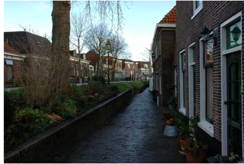
onderstraatje aan de Spaarndammerdijk