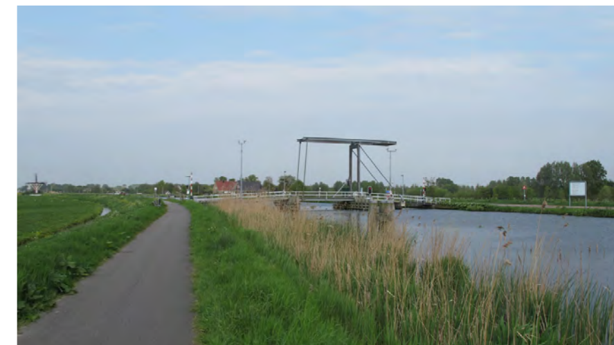
brug over Ringvaart verbindt Haarlem met Haarlemmermeer