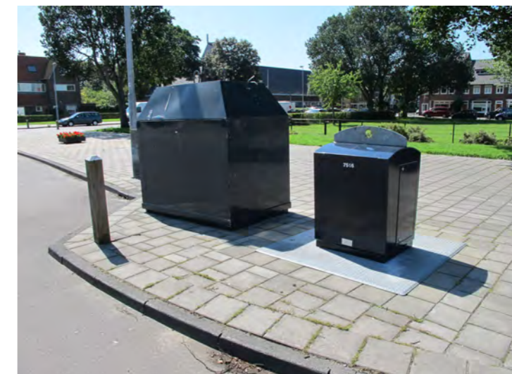
containers op plein