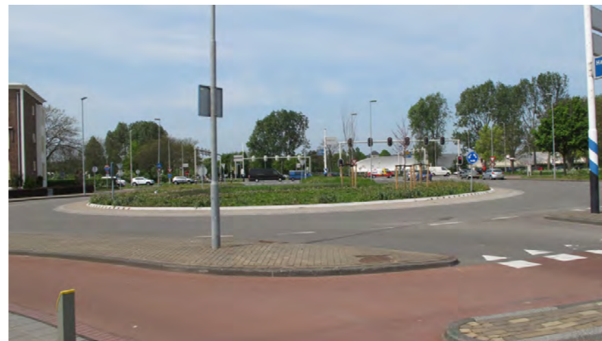
rotonde bij Kleverlaan en Westelijke Randweg