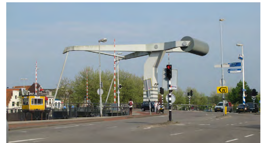
de Lange Brug