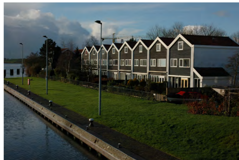
20e eeuwse invulling met zadeldak