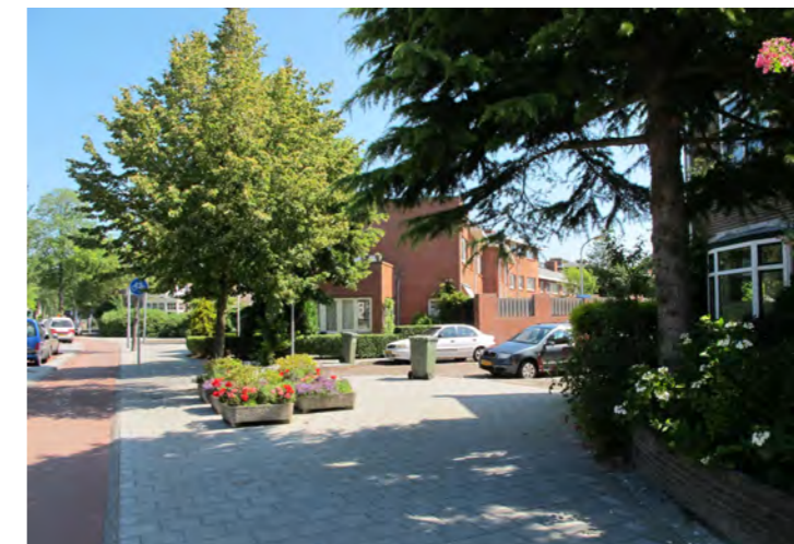
geforceerde aansluiting Zijlstraat