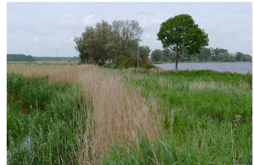
veenweidegebied bij Spaarndam