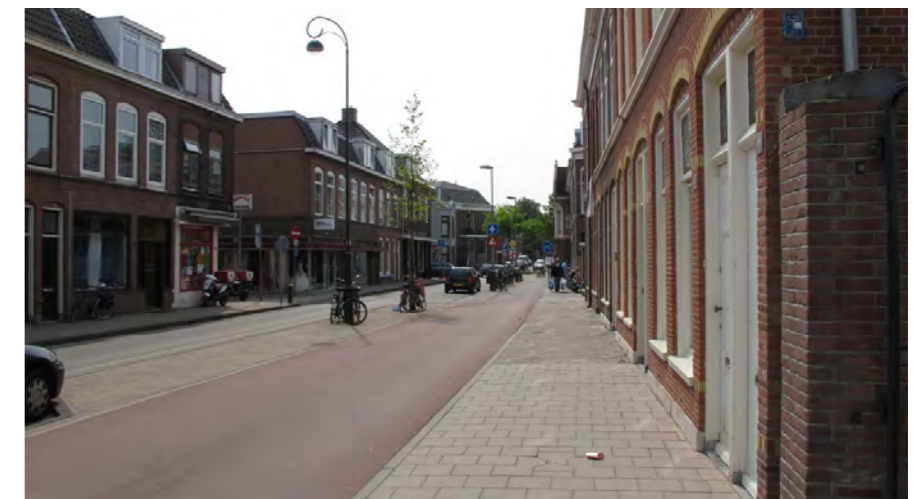
smalle stadsstraat in Frans Halsbuurt