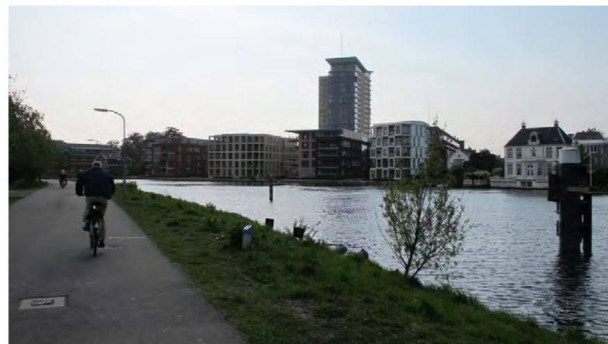
Mariastichting, een nieuwe ontwikkeling aan de oever van het Spaarne