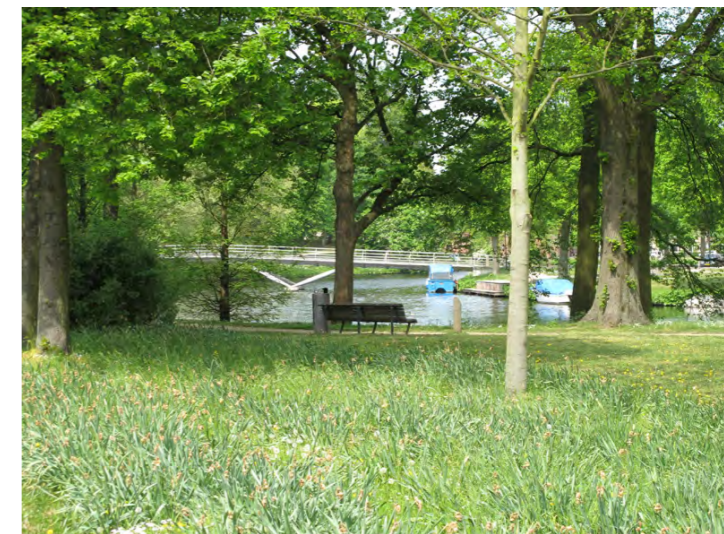
nieuwe brug over kloppersingel