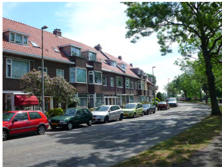
Dietsveld, Jan Gijzenkade