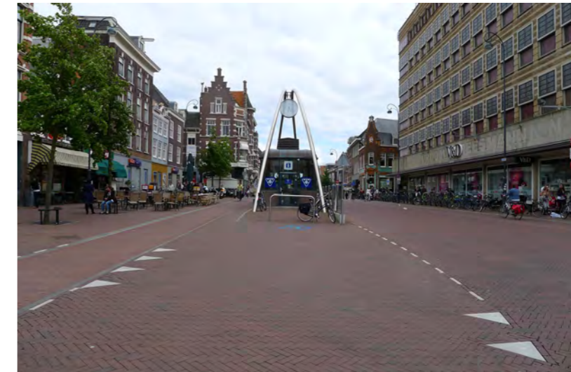
Gedempte Oude Gracht

De route heeft een 30km/h regime maar is ook onderdeel van de hoogwaardig openbaar vervoerlijn. Dit vraagt om een specifieke vormgeving van het straatprofiel. De breedte varieert van 18 tot wel 28m. Het profiel heeft vrijliggende fietspaden in een soort streetprint en een brede asfalt rijbaan met twee richtingen bus en één richting auto.