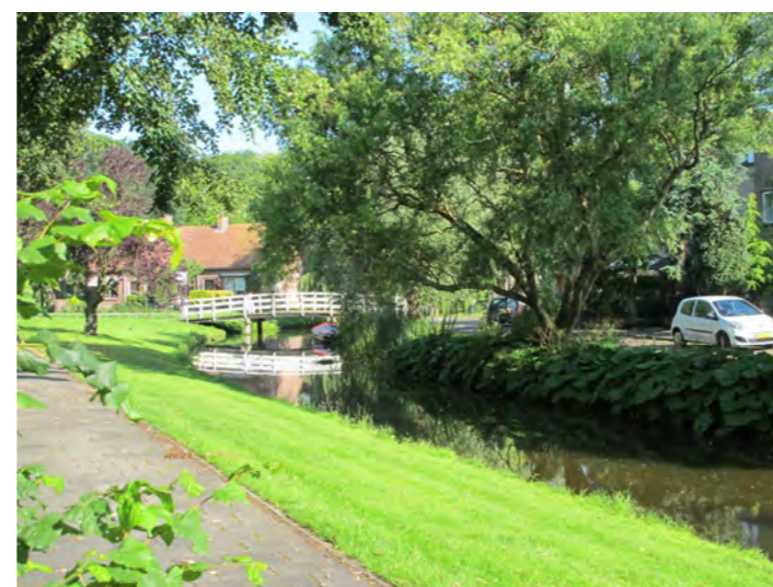
lommerrijk beeld langs de Zomervaart