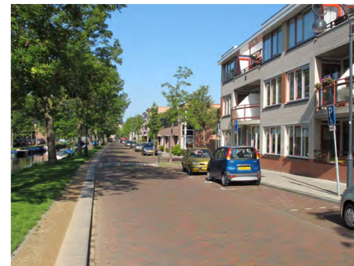
gevarieerde bebouwingstypologie langs de Zomerkade

deel bepalen de plantsoenen het groenbeeld, deels begeleid door rijen bomen, deels door solitaire bomen in de glooiende oevers met heesterbeplanting.