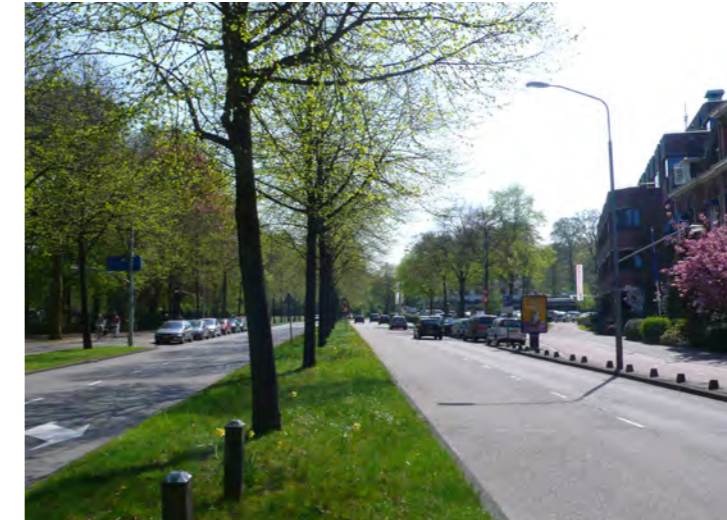
lindebomen in de middenberm