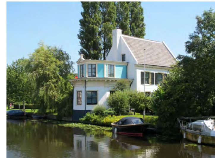
hofstede Vaartzicht (voormalige kwekerij Tubbergen)