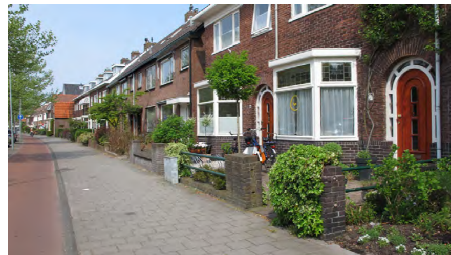
bebouwingsbeeld met voortuinen, Rijksstraatweg