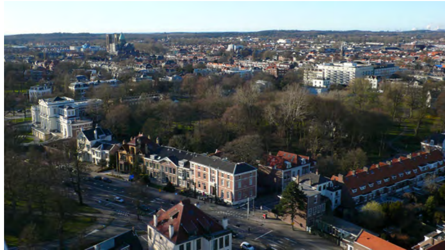
zicht op de binnenstad