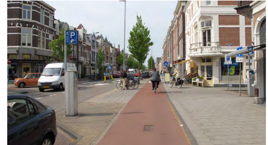
stadsstraat met winkelfuncties in plint