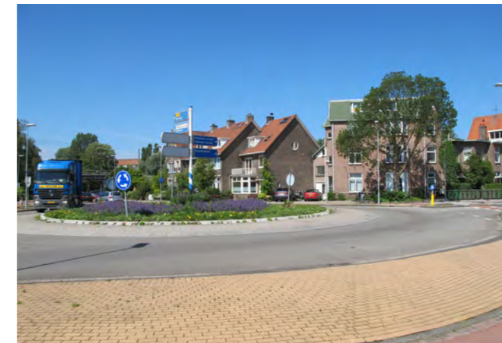
rotonde naar Korte Verspronckweg