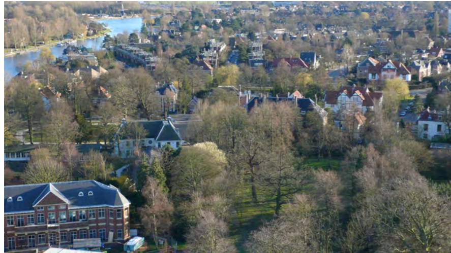
zicht over Haarlem Zuid