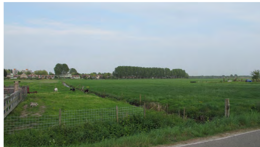
zicht over de Vereenigde Polder, richting Molenwijk