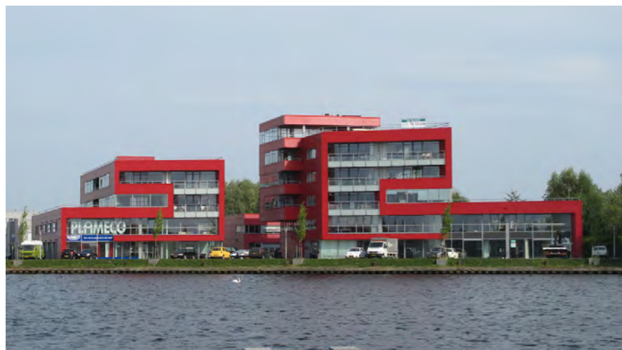
nieuwbouw Waarderpolder aan het Spaarne