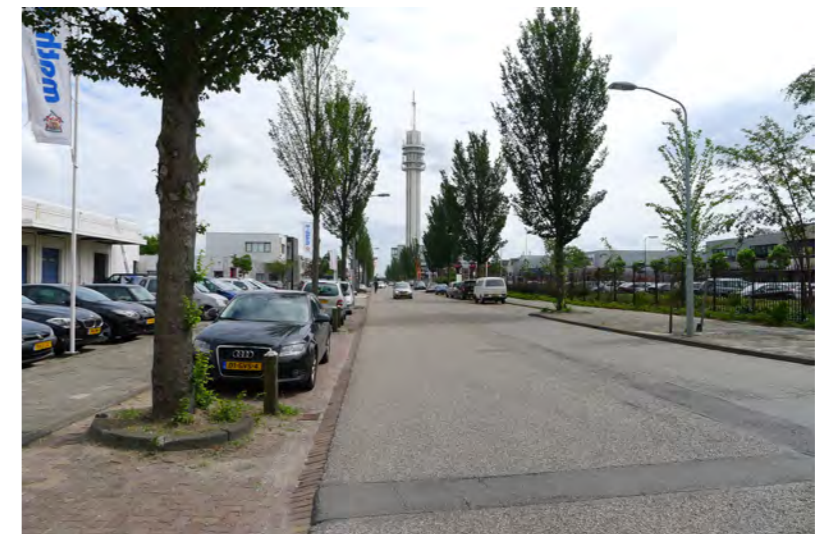
Straatprofiel in de Waarderpolder