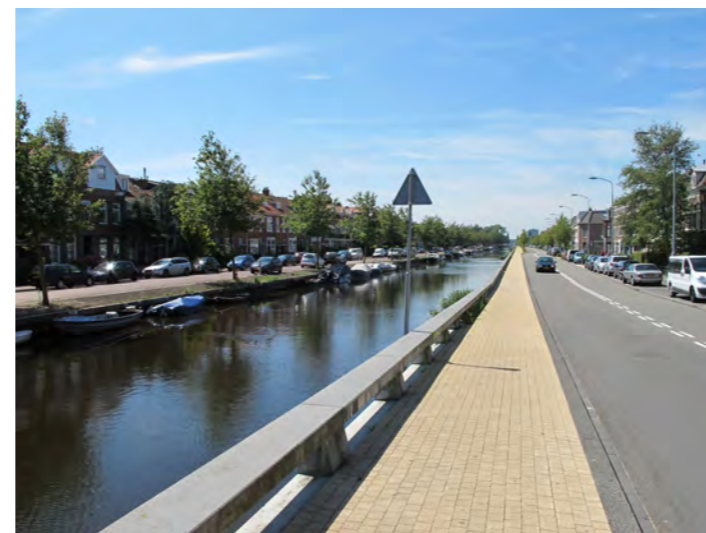
vaart met nieuwe kade

De vaart is in het Bomenbeleidsplan 2009-2019 onderdeel van de hoofdboomstructuur. Langs de vaart in de kaderand staat één rij bomen. Bij het smalle deel bij de Leidsevaartbuurt ontbreekt de rij deels.