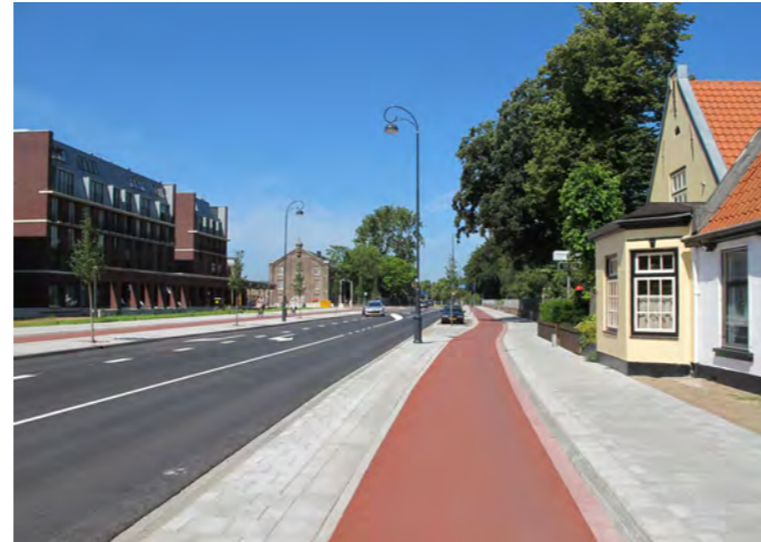
nieuwe inrichting ter hoogte van Ripperda

De route is in het Bomenbeleidsplan 2009-2019 onderdeel van de hoofdboomstructuur. De combinatie van voortuinen met straatbomen is van belang in het totaalbeeld. De bomen staan in twee rijen op sommige delen in de parkeerstrook, op andere delen in het trottoir. Daarnaast vormt de structuurlijn met zijn een aaneenschakeling van verschillende groengebiedjes - de stadkwekerij, de begraafplaats en de relictten van de oude Veerpolder met de molen - de brede groene dwarsverbinding tussen Spaarne en binnenduintrand. Een gebiedsvisie is voor deze groene dwarsverbinding is in voorbereiding.