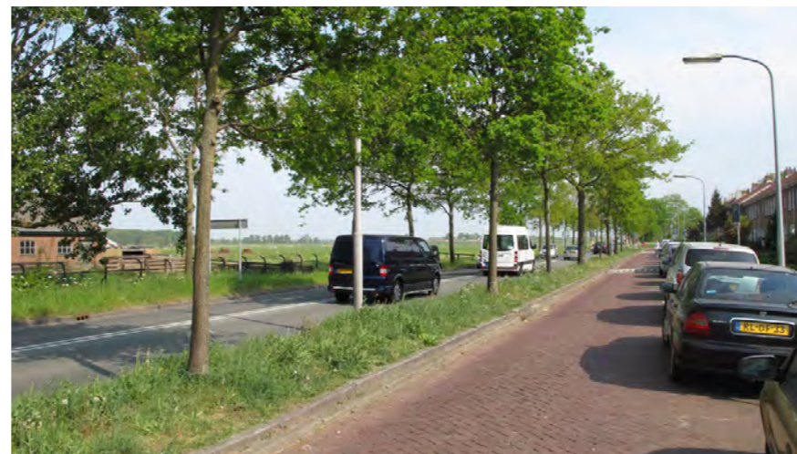
doorzicht vanaf Vondelweg naar open polder