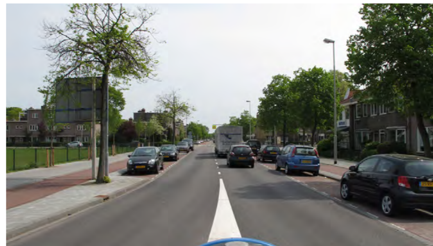
ruim opgezet profiel Kleverlaan