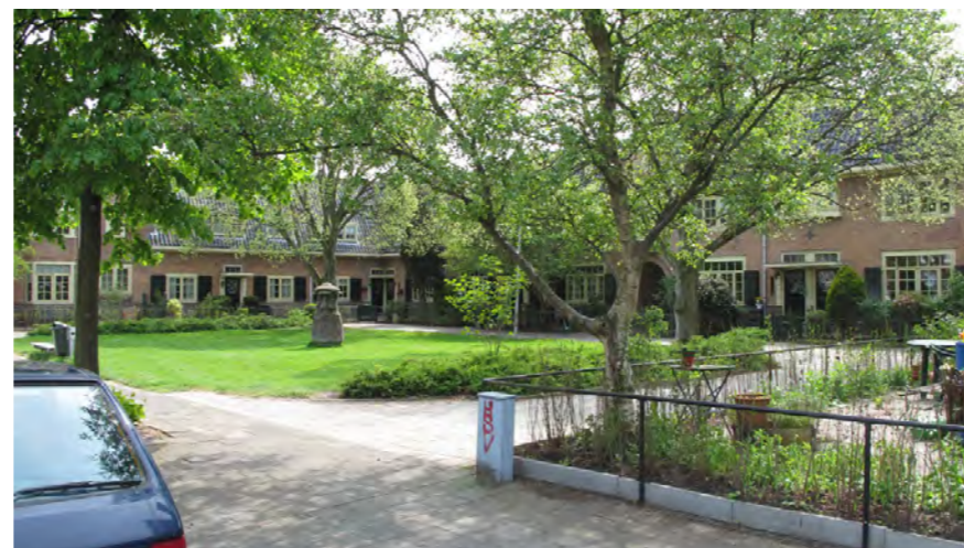
typische hofjes met sobere, maar gedetailleerde inrichting openbare ruimte