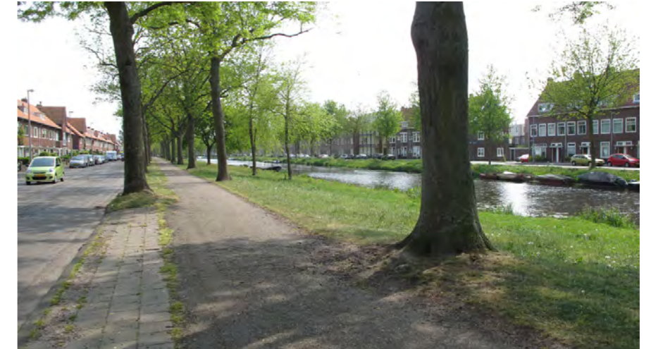
profiel Jan Gijzenvaart met wandelpad

De Jan Gijzenvaart is in het Bomenbeleidsplan 2009-2019 onderdeel van de hoofdboomstructuur. Er worden ecologische waarden gegeven aan de oevers. Langs de rijbaan in de groene oever zijn rijbomen geplaatst. In het oevertalud zijn aan de noordzijde groepjes boombeplanting in verschillende soorten geplaatst.