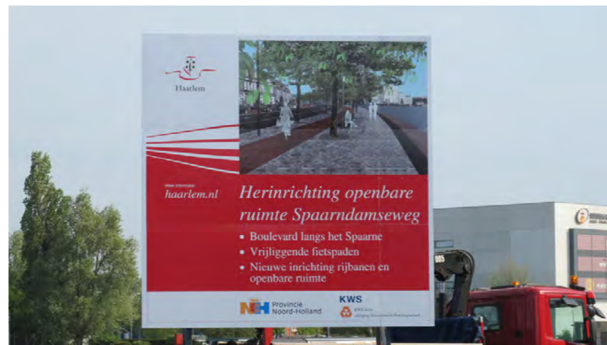
herinrichting van de Spaarndamseweg