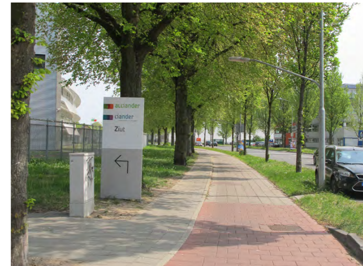
borden en andere objecten in grasberm