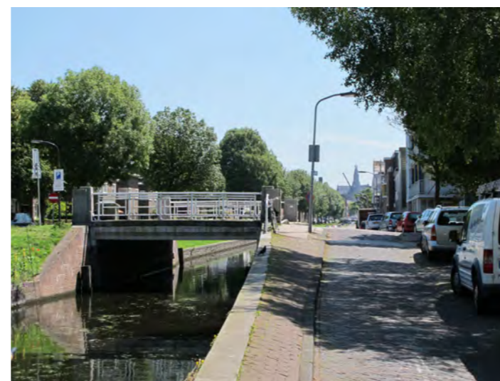
brug over Brouwersvaart