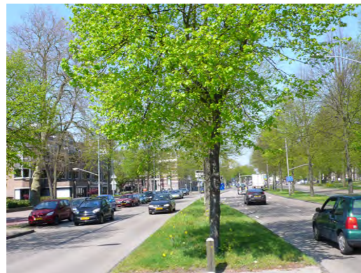
bomenstructuur in de middenberm