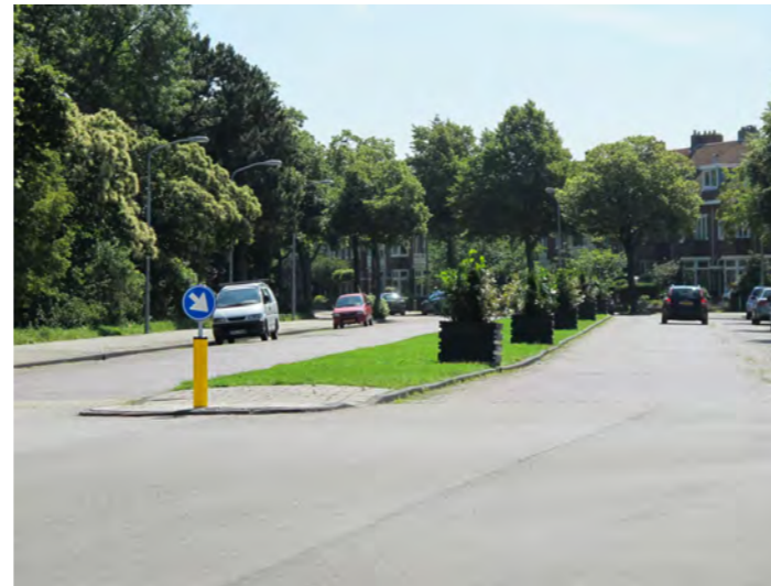
royaal profiel met middenberm