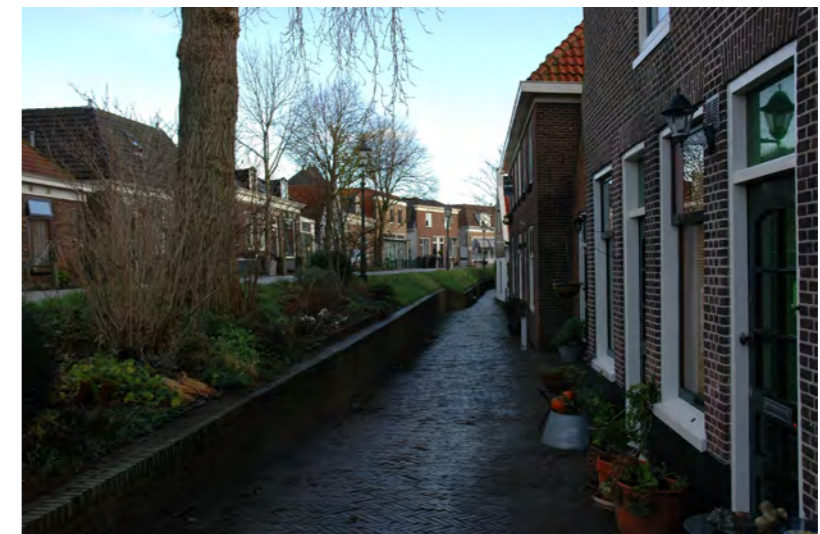
onderstraatje aan de Spaarndammerdijk