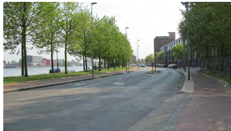
Spaarndamseweg, oude/huidige profiel