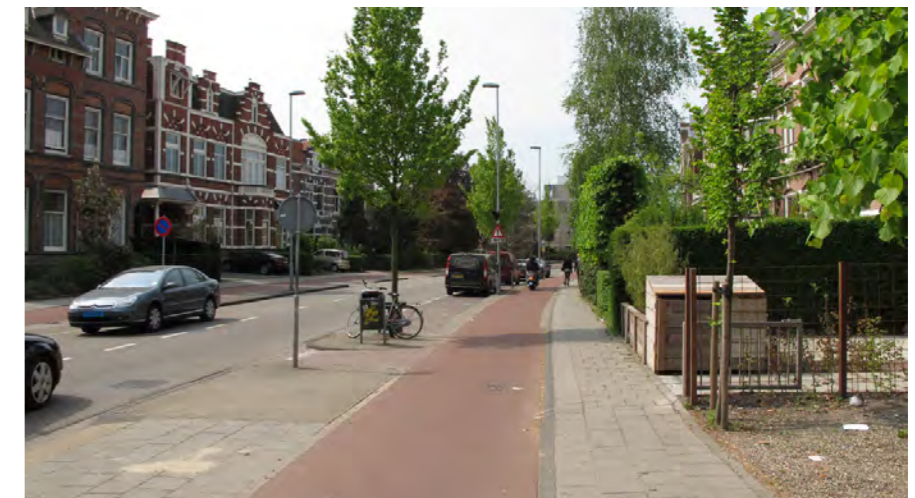
stadsstraat met voortuinen