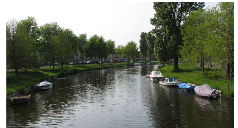
kromming in vaart