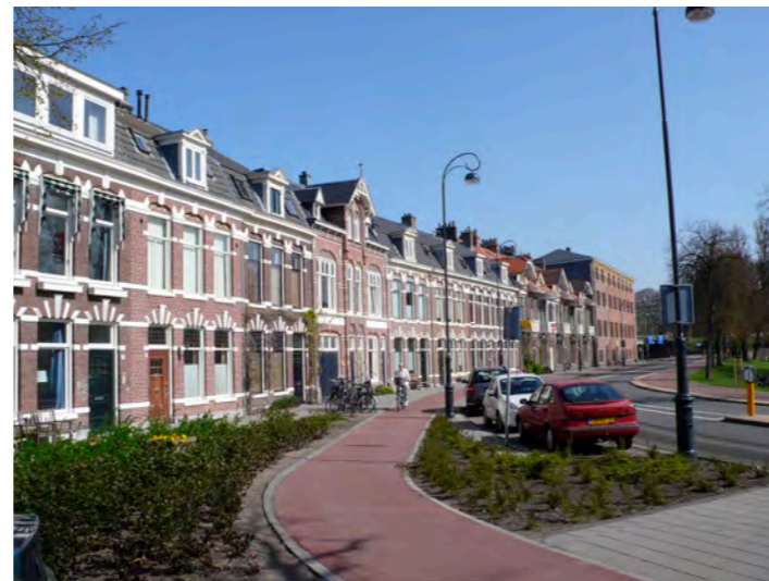
Garenkokerskwartier, langs de Vestinggracht