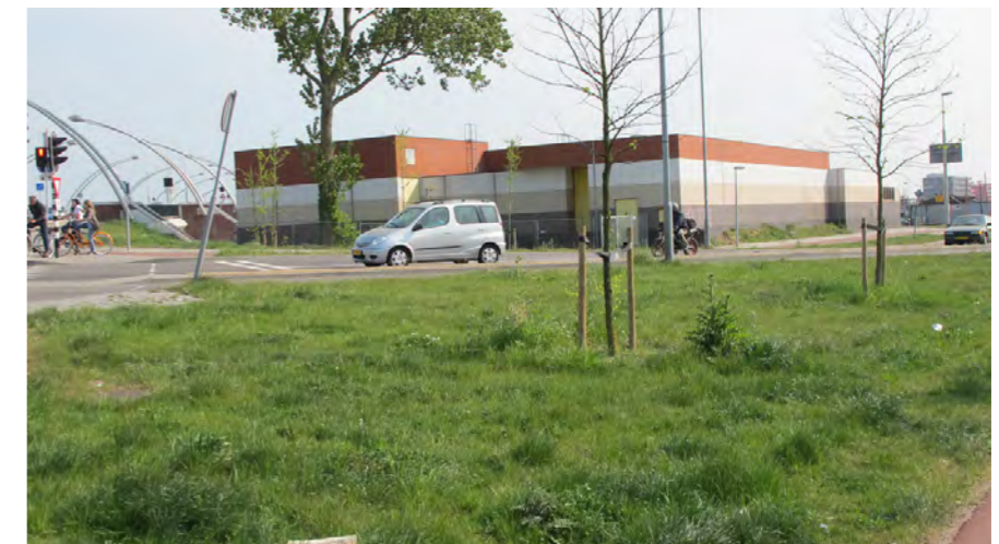
aansluiting Schoterboog met Spaarndamseweg