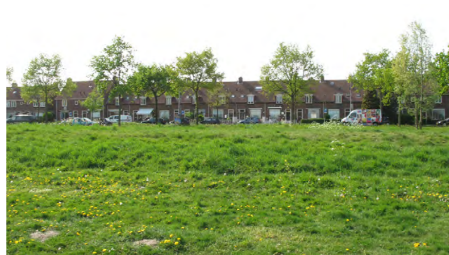
zicht naar bebouwingwand