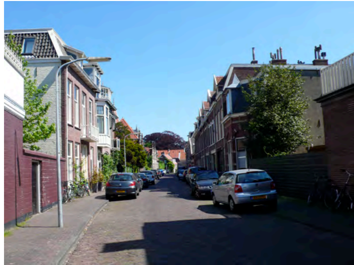
noordelijk deel Koninginnebuurt