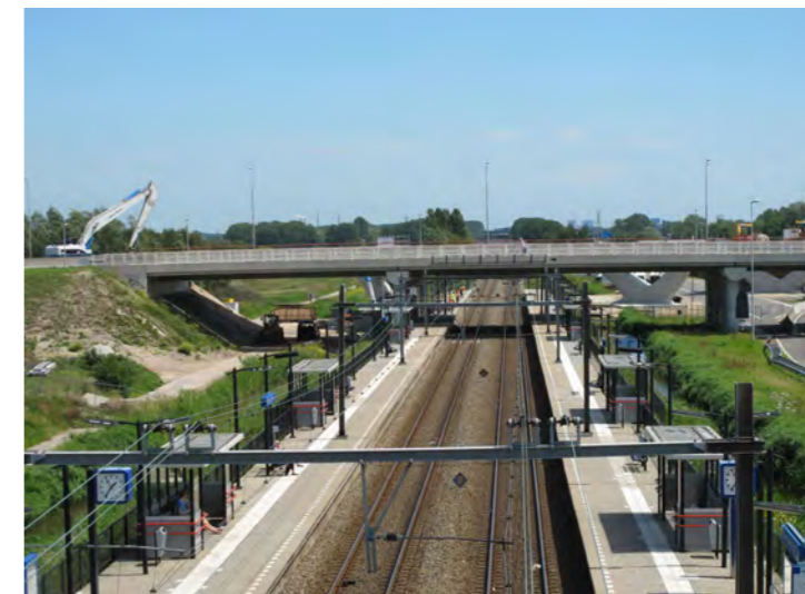
nieuwe ontwikkelingen langs de vaart