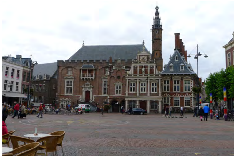
Stadhuis aan de Grote markt