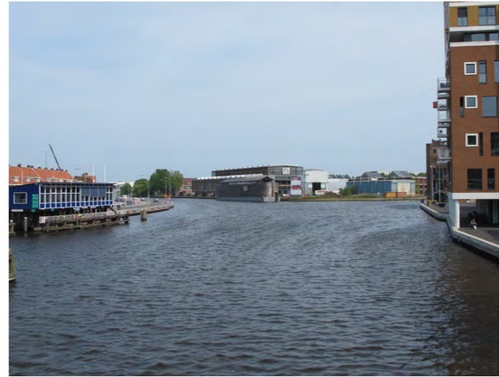
zicht over het water vanaf de Prinsenbrug