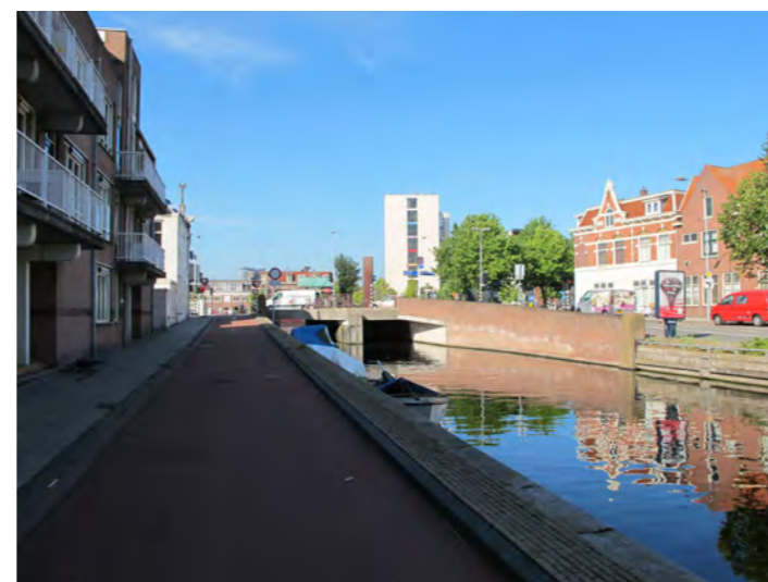
aansluiting op het Spaarne