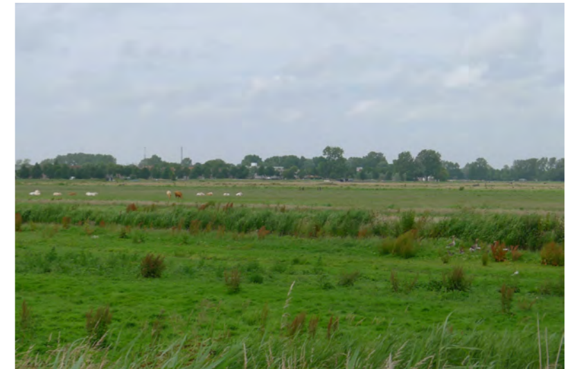
Oude Spaarndammer Polder