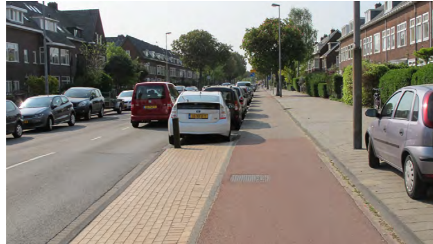
aansluiting Zaanenstraat met Spaarndamseweg

Zaanenstraat- Zaanenlaan is in het Bomenbeleidsplan 2009-2019 onderdeel van de hoofdboomstructuur. De bomen zijn wisselend van kwaliteit. Karakteristiek is de plaatsing van de bomen in trottoirs in plaats van in de parkeerstroken. Ter plaatse van het Huis te Zaanen heeft de Zaanenlaan een middenberm. De Orionweg heeft een royale middenberm met gegroepeerde solitaire boombeplanting.