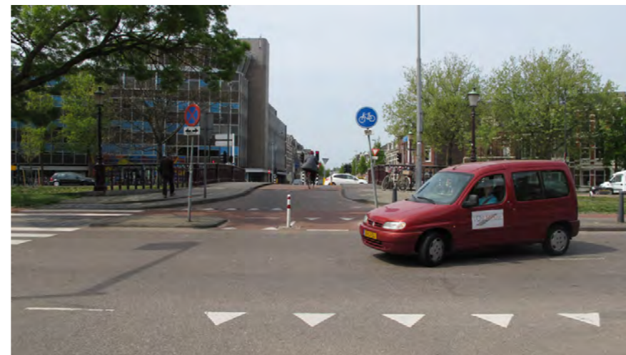
Zijlbrug; verbinding tussen Zijlstraat en Zijlweg