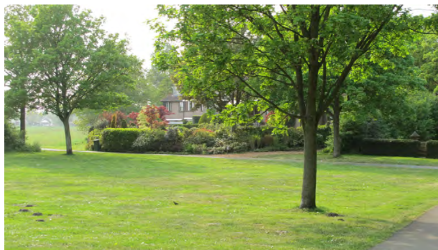
achtertuinten grenzen aan parkstrook

De vaart is 35 tot 39m breed. De vaart wordt aan de Haarlemmermeerzijde begeleid door een rijbaan. Aan de Haarlemse zijde ligt gedeeltelijk een recent aangelegd recreatief fietspad (het Hommelpad) dat de Schalkwijkerweg verbindt met Schalkwijk. Over de vaart is vanaf de Schalkwijkerweg een fietsbrug over de ringvaart. Er staan twee molens: de Kleine Molen (Molen de Hommel) en Molen de Vijfhuizen die tot 1938 in gebruik waren. Verder is er aan de Haarlemse kant geen begeleidende bebouwing langs de vaart. De zuidelijke rand van Schalkwijk wordt gevormd door twee zandafgravingsplassen: de Molenplas en Meerwijkplas. De bebouwingsrand wordt gecamoufleerd door parkachtige begroeiing.