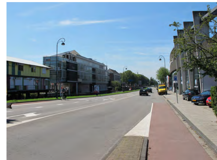
grote schaal aan de Zijlvest