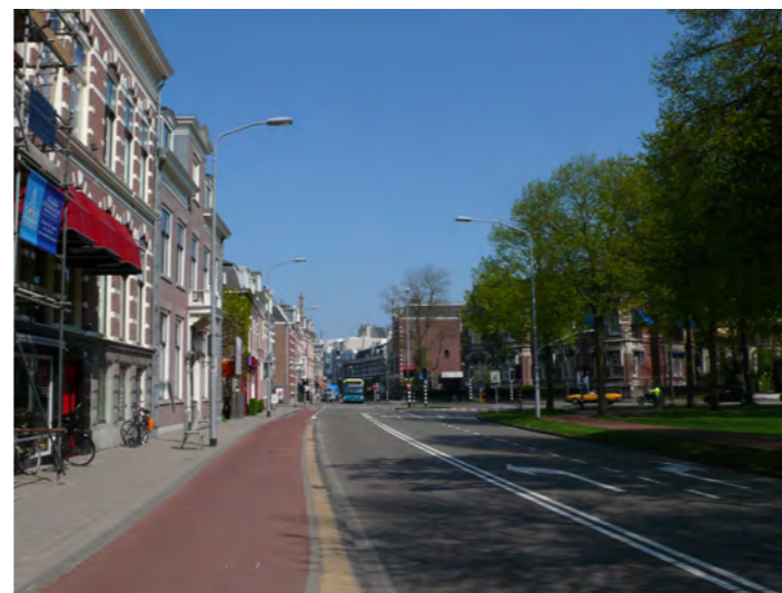
Wagenweg ter hoogte van fietspad