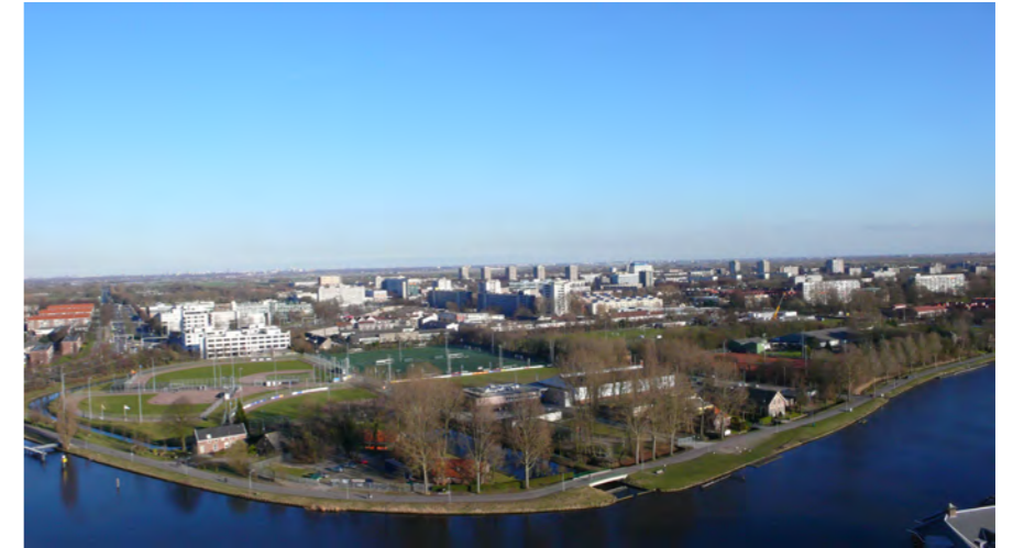
zicht op sportpark overhout