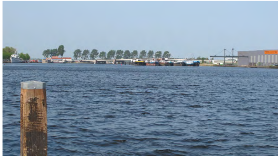
doorzicht over het Noorder Buiten Spaarne