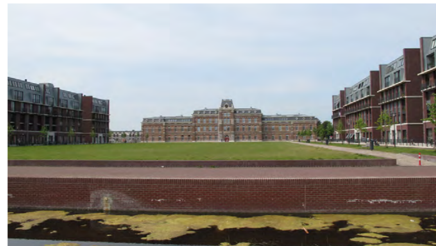
St. Joriseveld, Ripperdakazerne