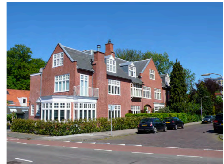
villa in Zuiderhout