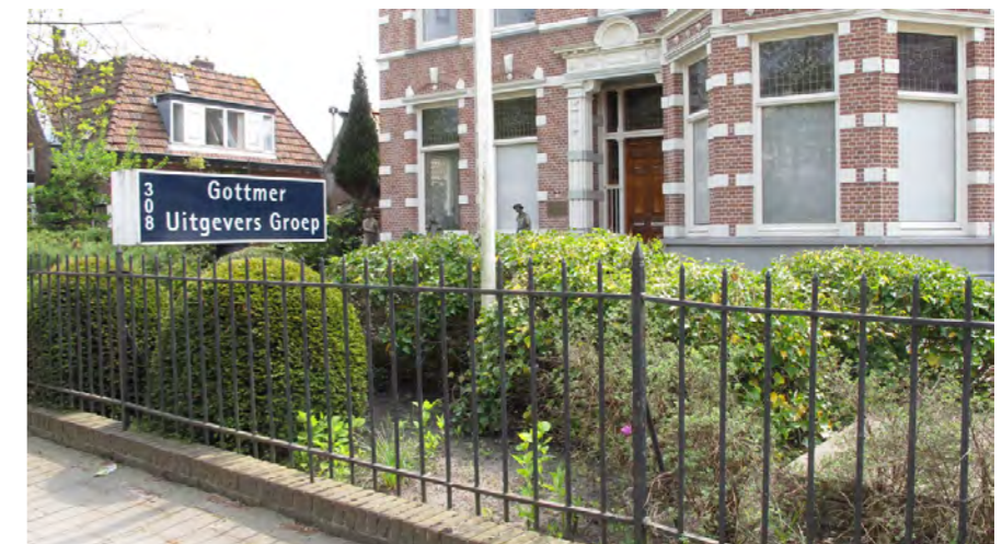
reclame-uitingen in voortuin