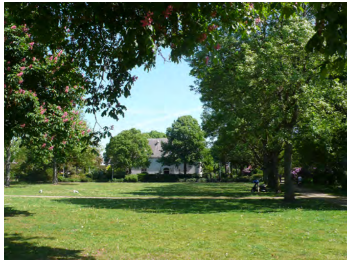
Bomenbuurt, Huis te Zaanen