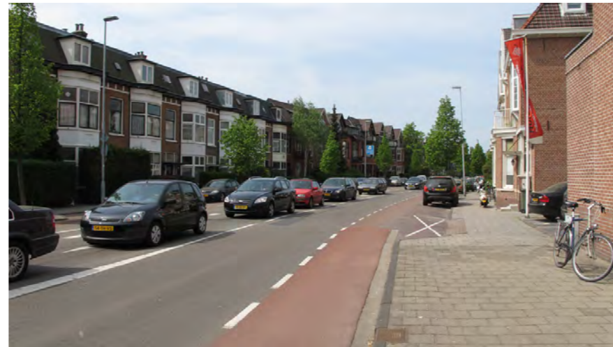
gekromde loop Verspronckweg

De Verspronckweg is in het Bomenbeleidsplan 2009-2019 onderdeel van de hoofdboomstructuur.