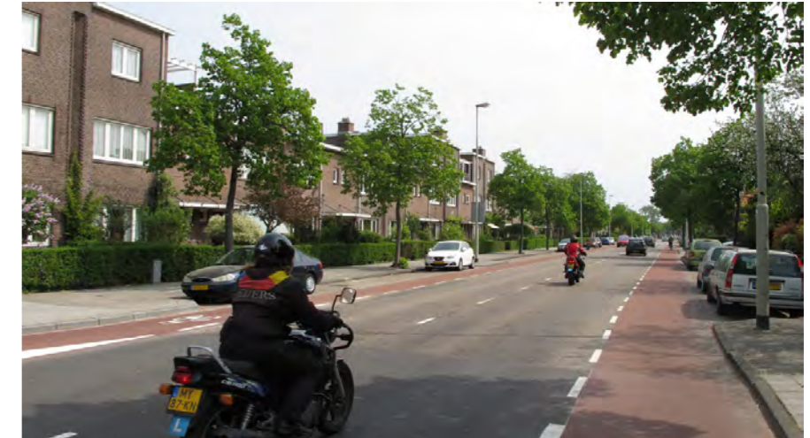
wooncomplex J.B. van Lochem, met 3-laagse hoogte-accenten