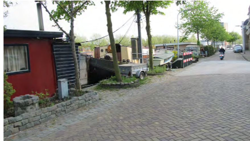
oever bij Rozenprieel, bepaald door woonboten