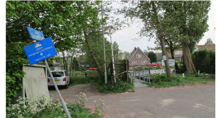
eindpunt van de Zuid-Schalkwijkerweg