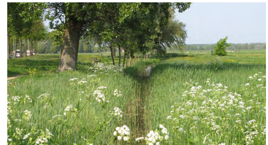
landschappelijk beeld groene rand