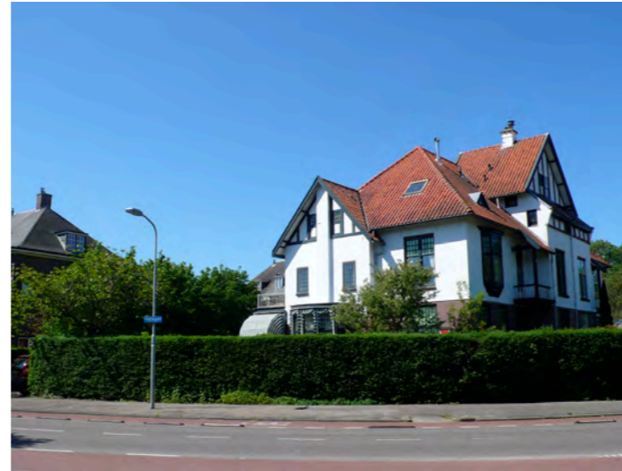
individuele villa aan de Churchillaan