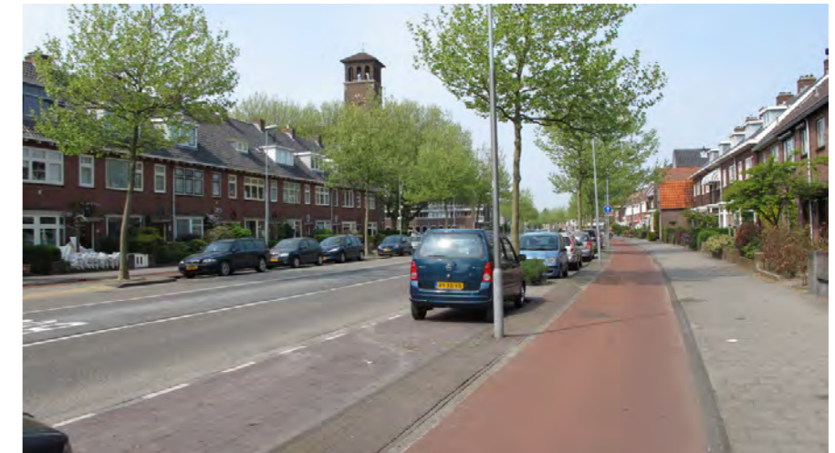
Rijksstraatweg met busbaan

plek naast de parkeerstrook. Aanvullen van de bestaande boomstructuur is uitgangspunt.