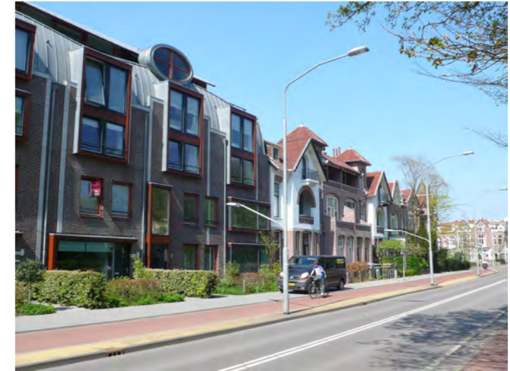
nieuwe invulling aan de Wagenweg