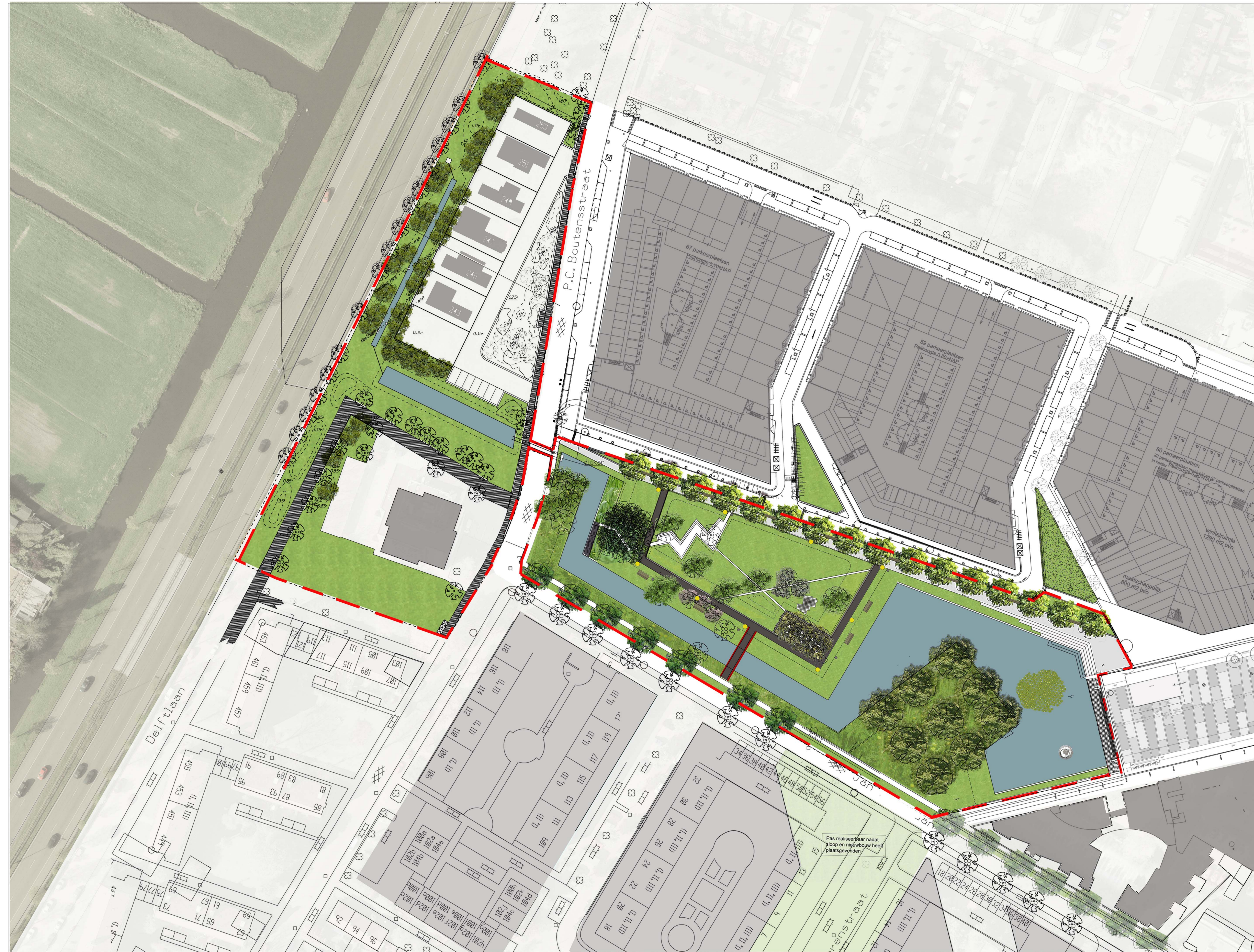
WIJKPARK DELFTWIJK VOORLOPIG ONTWERP