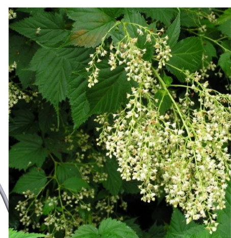
haag, Stephanandra tanakae