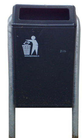
Afvalbak type Bammens