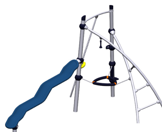
speeltoestel type Mizar