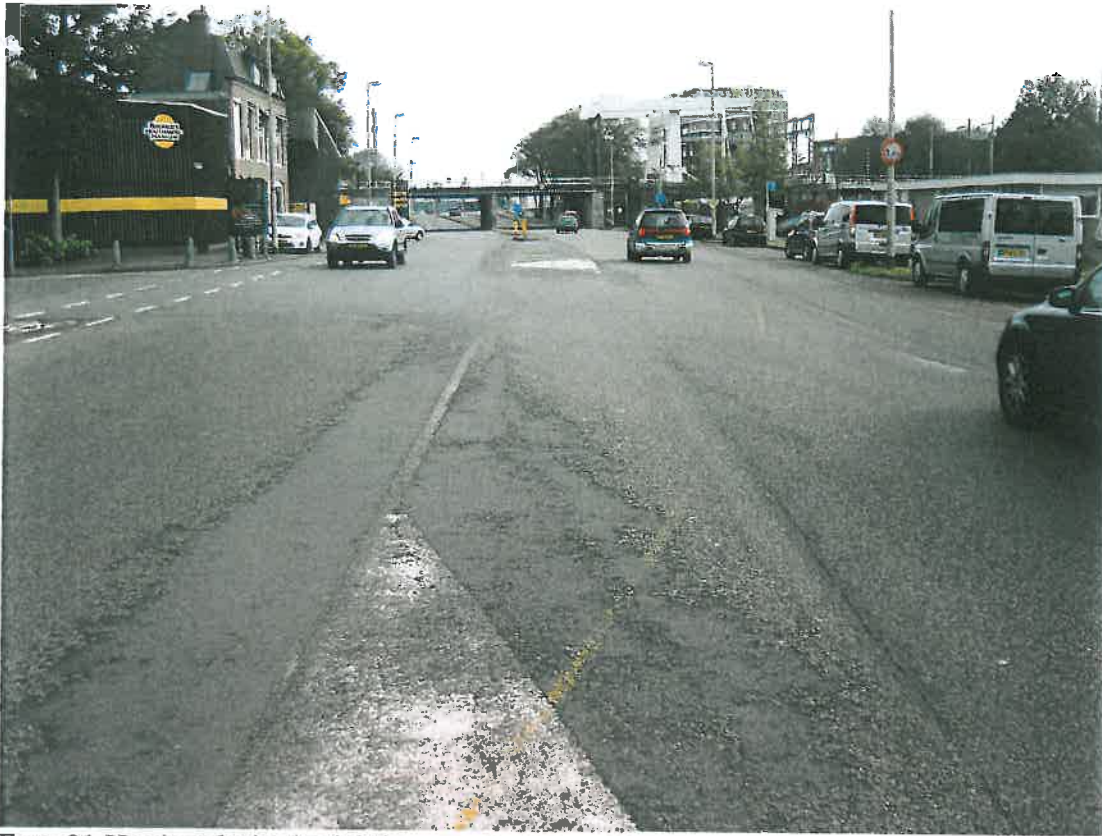
Foto 01 Hooimarkt in de richting van de Friese Varkensmarkt