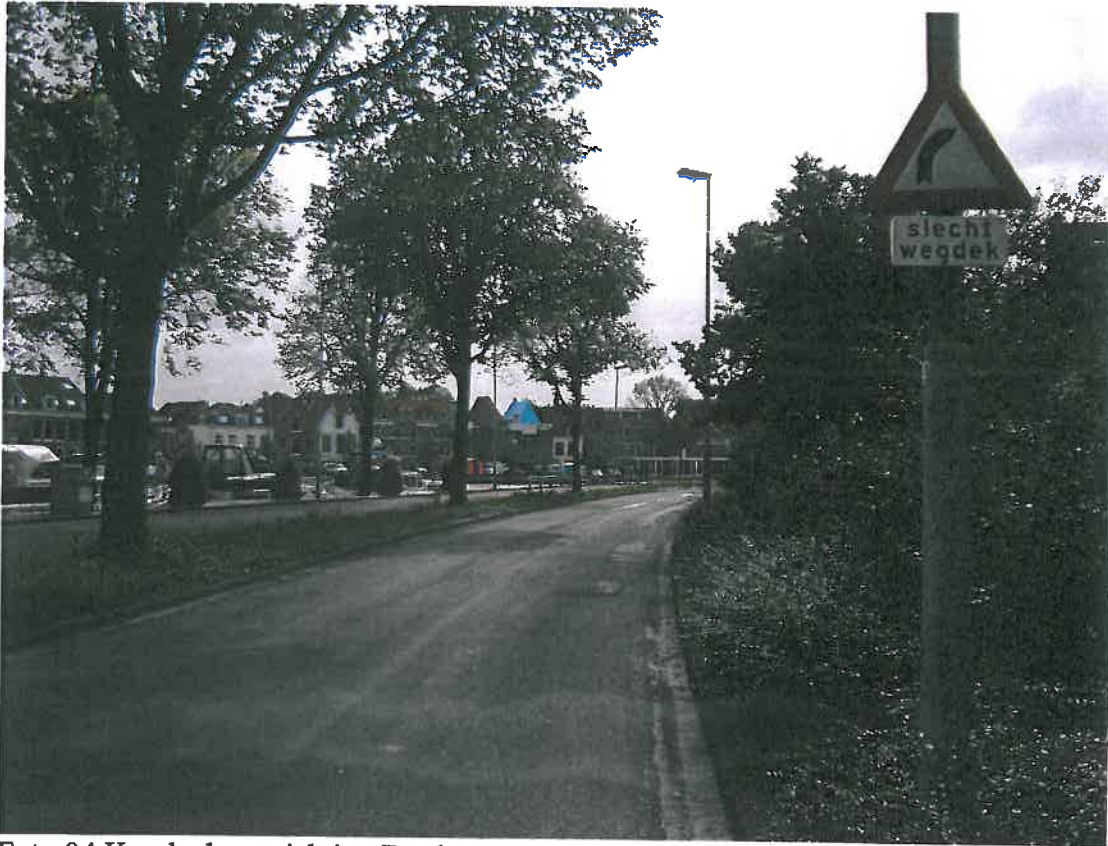
Foto 04 Koudenhorn richting Donkere Spaarne