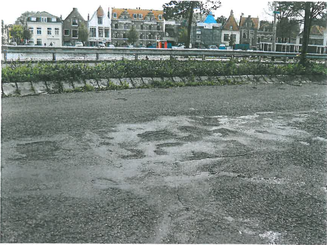
Foto 05 Koudenhorn/Donkere Spaarne schadebeeld