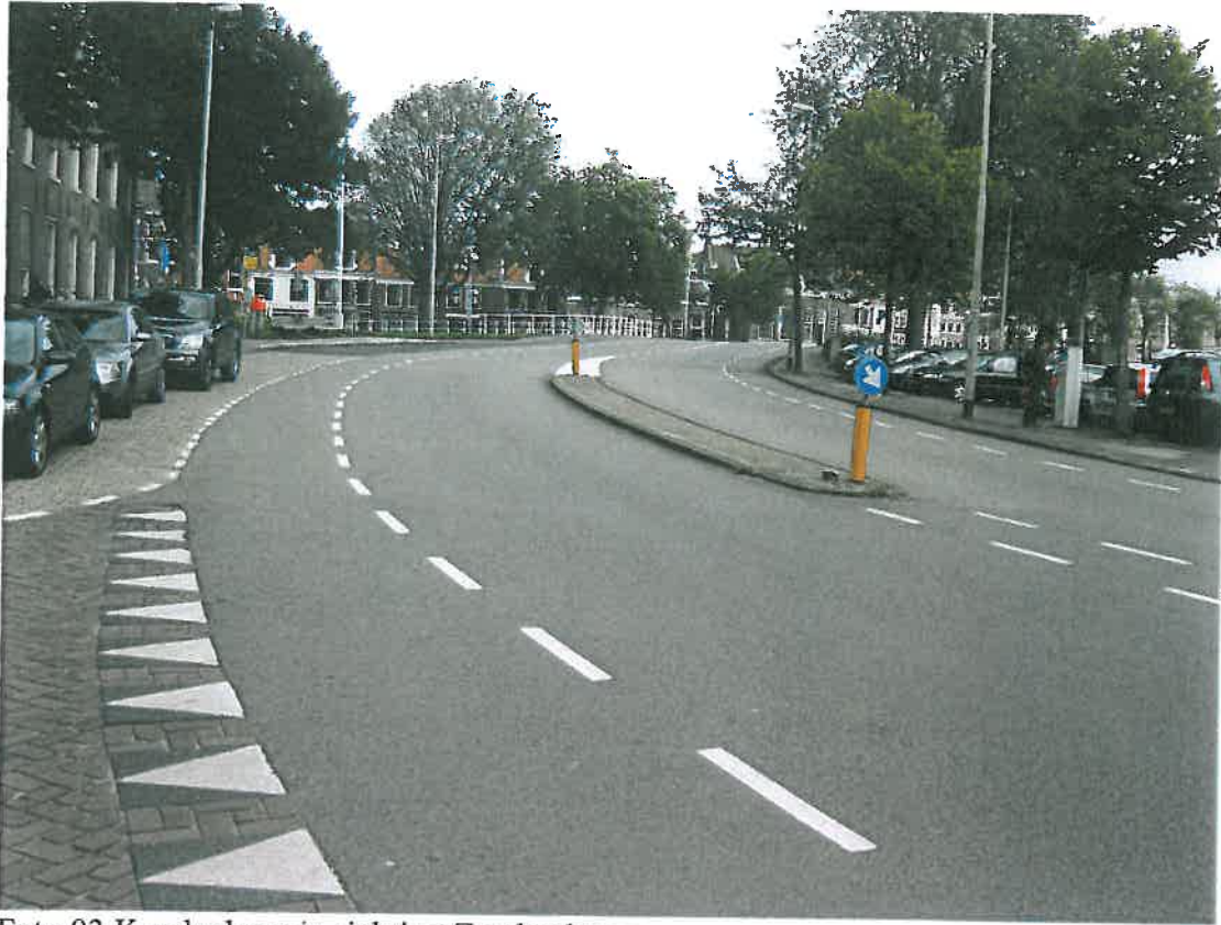
Foto 03 Koudenhorn in richting Zandersbrug