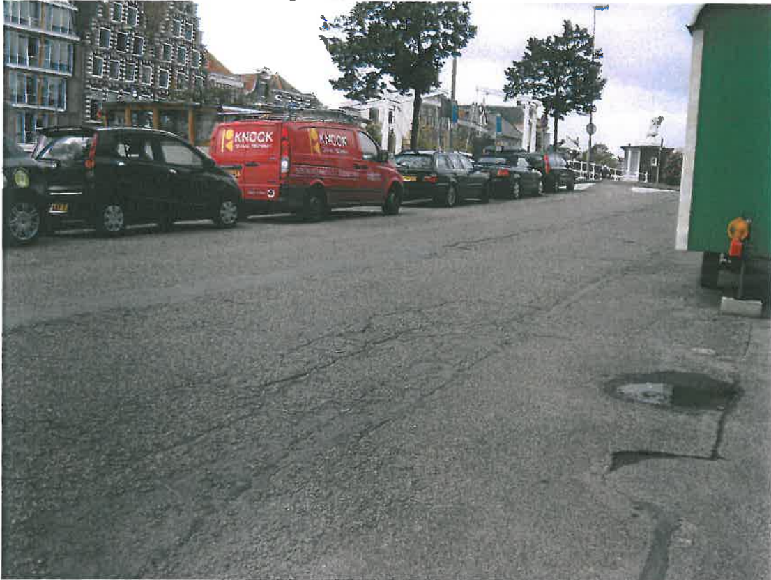
Foto 06 Donkere Spaarne richting Gravenstenenbrug/Wildemansbrug