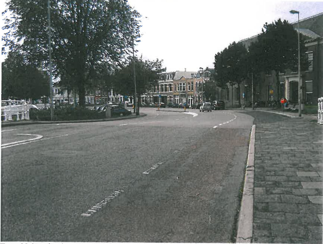
Foto 02 Zandersbrug in de richting van de Koudenhorn