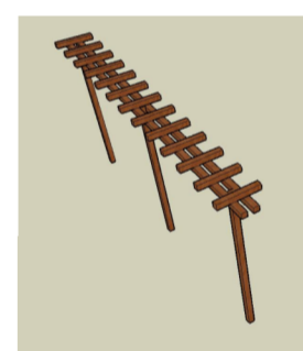
houten pergola firma Mijrvlinder te Vianen