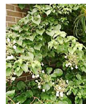
klimhortensia Hydrangea anomala s.sp.petiolaris