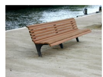
Erdi zitbank model canape retro