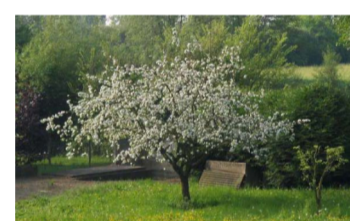
appelboom in bloei