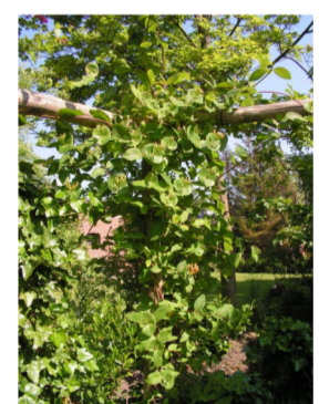
kamperfoelie loncera ( japonica en henryi )