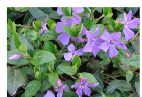
vinca minor maaigdenpalm