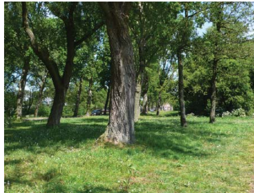
zicht naar begraafplaatsen, Haarlem-Noord