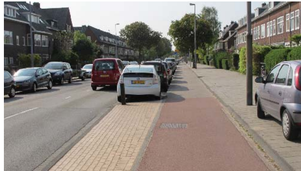
aansluiting Zaanenstraat met Spaarndamseweg

Zaanenstraat- Zaanenlaan is in het Bomenbeleidsplan 2009-2019 onderdeel van de hoofdboomstructuur. De bomen zijn wisselend van kwaliteit. Karakteristiek is de plaatsing van de bomen in trottoirs in plaats van in de parkeerstroken. Ter plaatse van het Huis te Zaanen heeft de Zaanenlaan een middenberm. De Orionweg heeft een royale middenberm met gegroepeerd solitaire boombeplanting.