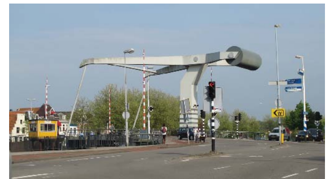
de Lange Brug