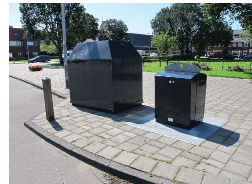
containers op plein