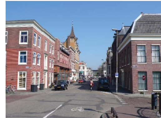
Nieuwe Gracht, zicht op de binnenstad