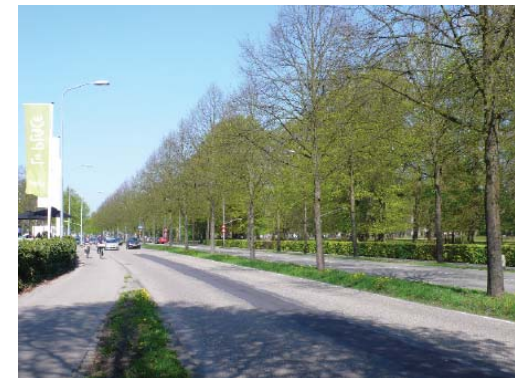
gezicht op de Dreef, bij Dreefzicht