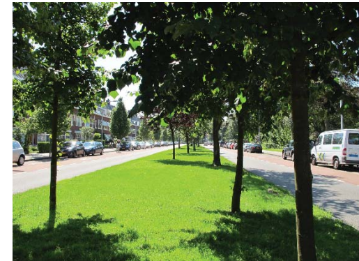
Orionweg met middenberm