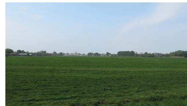
beeld bebouwing Zwemmerslaan vanaf de Ringdijk