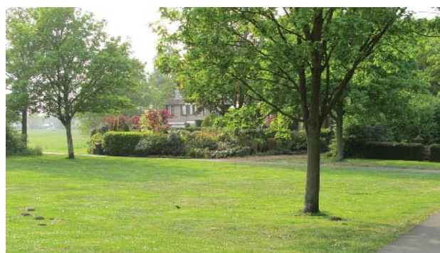
achtertuinten grenzen aan parkstrook