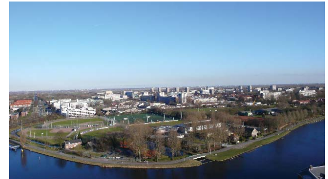
zicht op sportpark Overhout