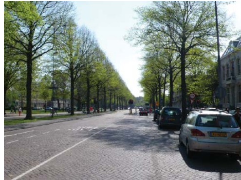
Dreef, bij Provinciehuis

De route is in het Bomenbeleidsplan 2009-2019 onderdeel van de hoofdboomstructuur. De aanwezigheid van de Hout vormt daar de basis voor. De bomenstructuur wordt gevormd door minimaal twee rijen lindenbomen, op sommige plekken uitgebreid met lindenbomen in de middenberm aangevuld met bomen in de zijbermen. Hierdoor ontstaat een monumentaal beeld met vier rijen bomen. Het kunstwerk de Lindenbogen langs de Fonteinlaan is een groen accent in het profiel. Met de opeenvolging van verschillende groene ruimtes van bos tot park tot villatuin is een lommerijk, groen en afwisselend beeld ontstaan.