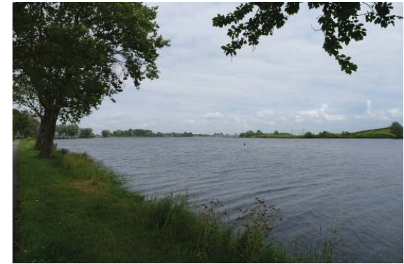
uitzicht over het Buiten Spaarne bij Spaarndam