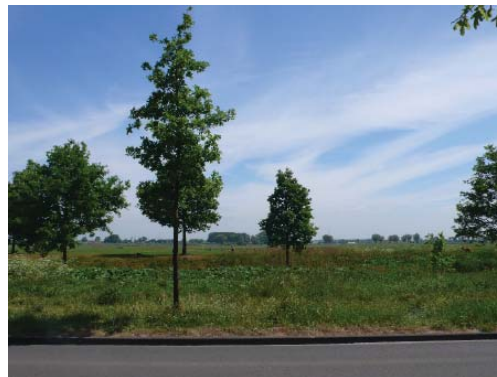
zicht op het onbebouwde gebied