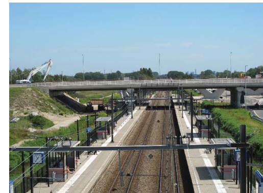
nieuwe ontwikkelingen langs de vaart