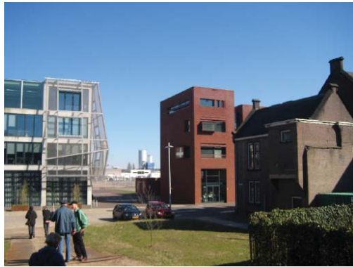
Historische panden en nieuwbouw langs het Spaarne