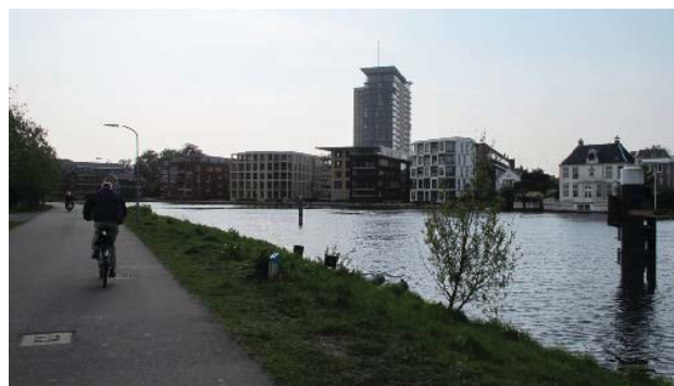
Mariastichting, een nieuwe ontwikkeling aan de oever van het Spaarne