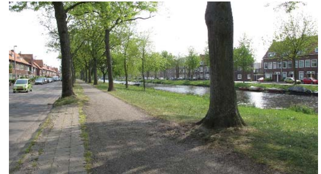
profiel Jan Gijzenvaart met wandelpad

De Jan Gijzenvaart is in het Bomenbeleidsplan 2009-2019 onderdeel van de hoofdboomstructuur. Er worden ecologische waarden gegeven aan de oevers. Langs de rijbaan in de groene oever zijn rijbomen geplaatst. In het oevertalud zijn aan de noordzijde groepjes boombeplanting in verschillende soorten geplaatst.