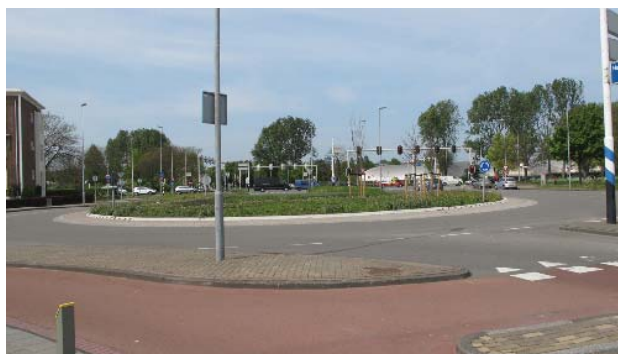
rotonde bij Kleverlaan en Westelijke Randweg