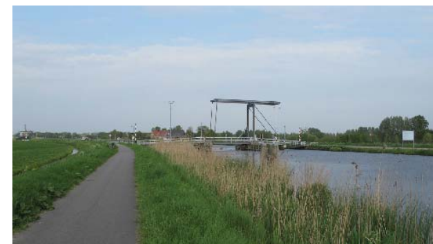
brug over Ringvaart verbindt Haarlem met Haarlemmermeer

De vaart is 35 tot 39m breed. De vaart wordt aan de Haarlemmermeerzijde begeleid door een rijbaan. Aan de Haarlemse zijde ligt gedeeltelijk een recent aangelegd recreatief fietspad (het Hommelpad) dat de Schalkwijkerweg verbindt met Schalkwijk. Over de vaart is vanaf de Schalkwijkerweg een fietsbrug over de ringvaart. Er staan twee molens: de Kleine Molen (Molen de Hommel) en Molen de Vijfhuis die tot 1938 in gebruik waren. Verder is er aan de Haarlemse kant geen begeleidende bebouwing langs de vaart. De zuidelijke rand van Schalkwijk wordt gevormd door twee zandafgravingsplassen: de Molenplas en Meerwijkplas. De bebouwingsrand wordt gecamoufleerd door parkachtige begroeiing.