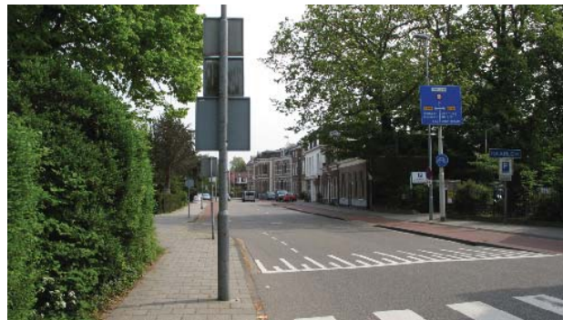
Zijlweg bij Overveen