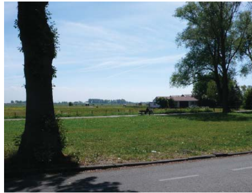
zicht op het landschappelijke groen aan de oostrand van Haarlem