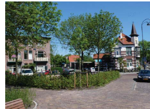
villa's in de Koninginnebuurt