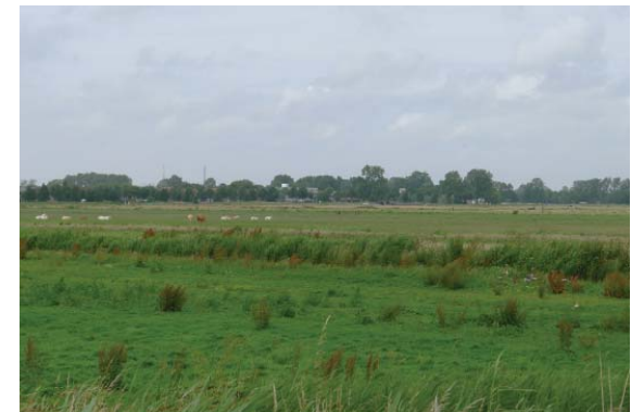
Oude Spaarndammer Polder