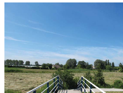
zicht naar het Ramplaankwartier