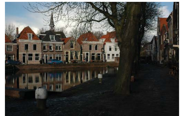
zicht op de Kolk