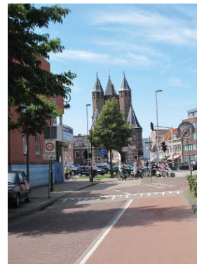
zicht op de Amsterdamse Poort