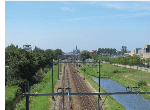
zicht op de St. Bavo; beëindiging waterloop

De Zuid-Schalkwijkerweg wordt beschreven bij de waterloop 'Tuinstad aan het Spaarne'.