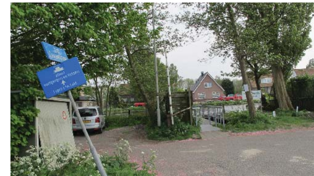
eindpunt van de Zuid-Schalkwijkerweg