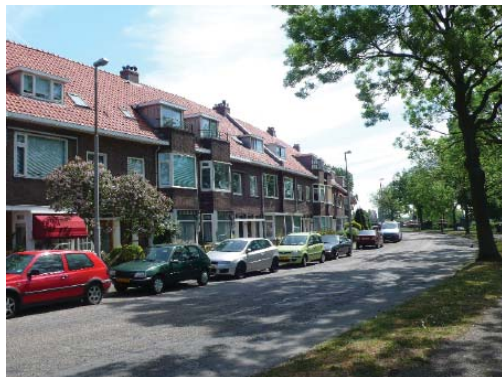
Dietsveld, Jan Gijzenkade