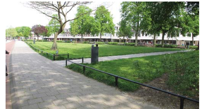
Julianapark als beëindiging Cronjéstraat