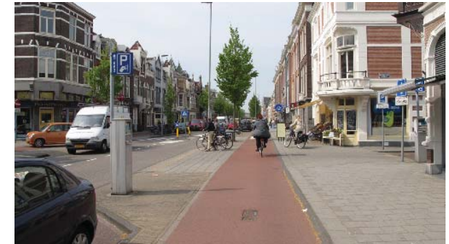
stadsstraat met winkelfuncties in plint