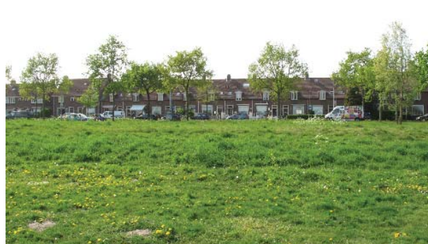
zicht naar bebouwingswand