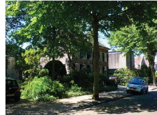
individuele villa's, Haarlem Zuid