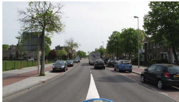
ruim opgezet profiel Kleverlaan