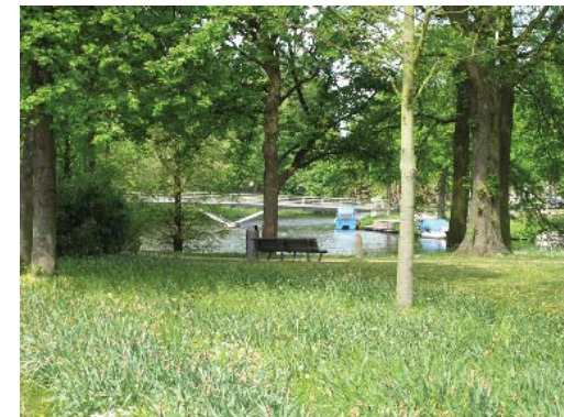
nieuwe brug over Kloppersingel