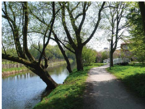
woonbebouwing en groenstructuur