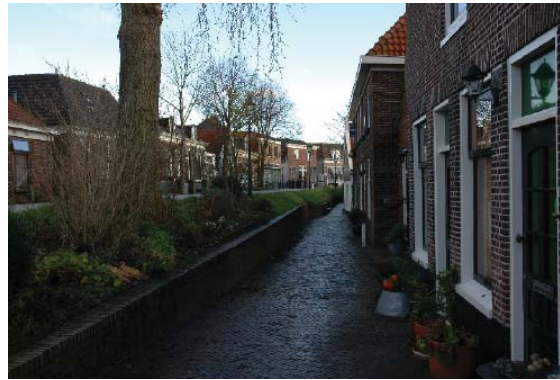
onderstraatje aan de Spaarndammerdijk