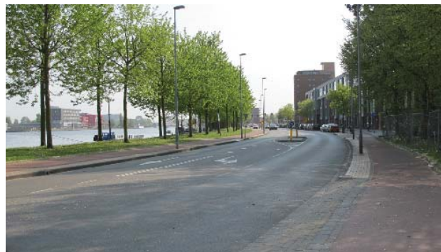
Spaarndamseweg, oude/huidige profiel