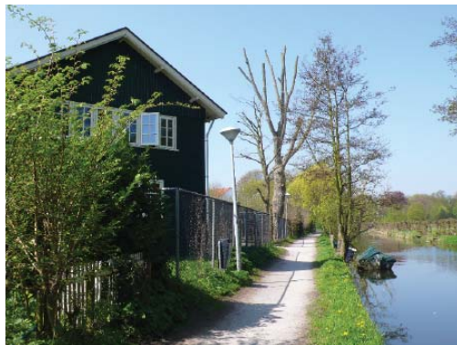
woonbebouwing in het binnenduinrandgebied