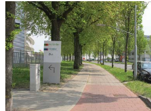
borden en andere objecten in grasberm