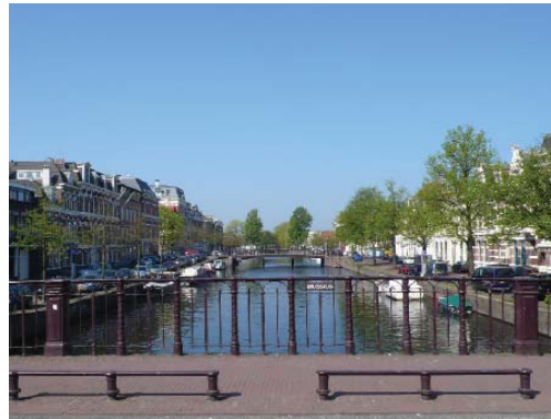
zicht over de Nieuwe Gracht