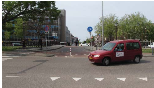
Zijlbrug; verbinding tussen Zijlstraat en Zijlweg