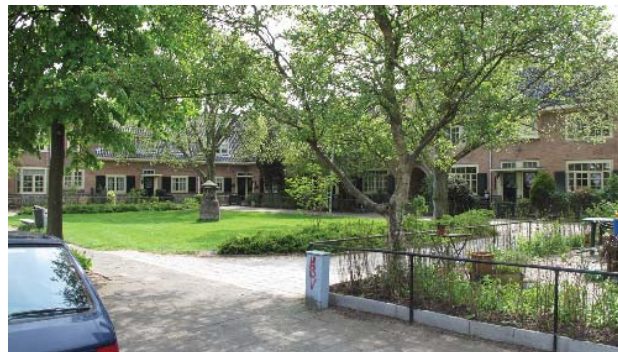
typische hofjes met sobere, maar gedetailleerde inrichting openbare ruimte