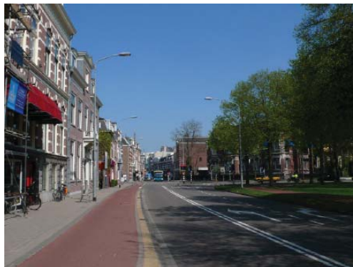
Wagenweg ter hoogte van fietspad