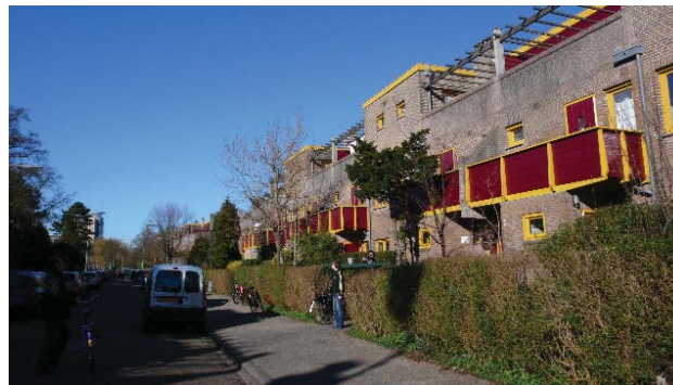
Tuinwijk, Haarlem Zuid