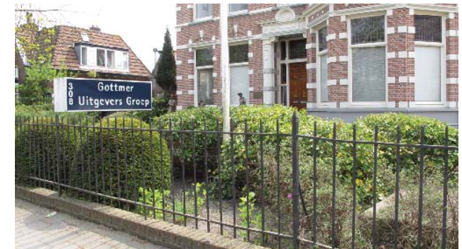
reclame-uitingen in voortuin