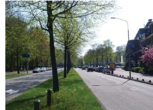
lindenbomen in de middenberm