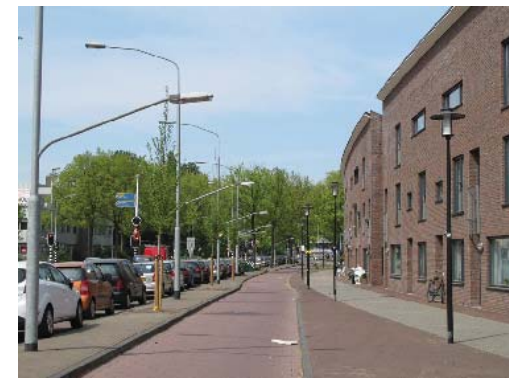
overgang buurt naar structuurlijn; conflict in verlichting