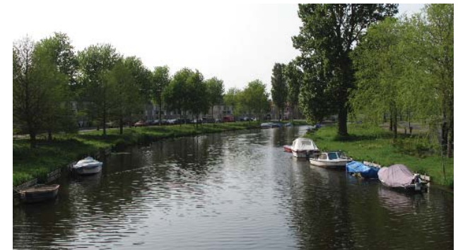
kromming in vaart