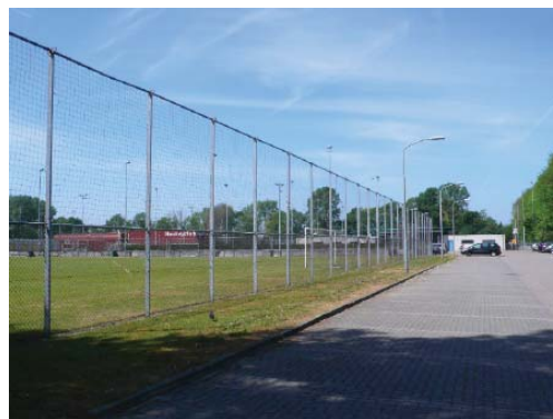
Van der Aart-sportpark