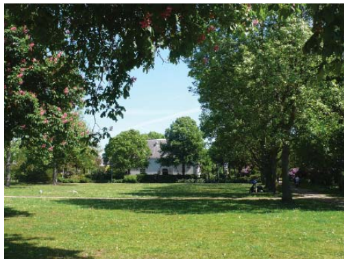
Bomenbuurt, Huis te Zaanen