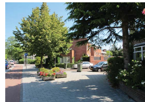
geforceerde aansluiting Zijlstraat