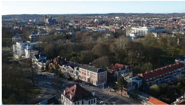
zicht op de binnenstad