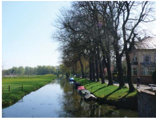
villa's in het binnenduinrandgebied