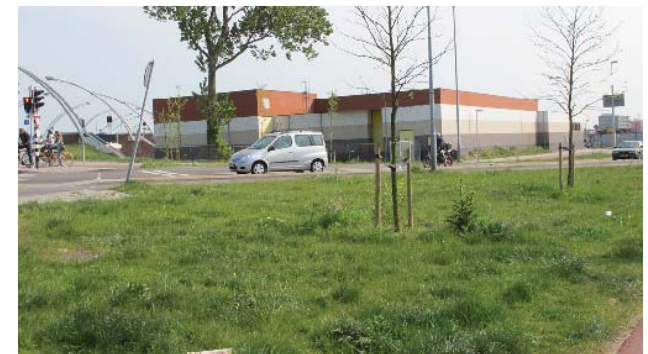
aansluiting Schoterbrug met Spaarndamseweg