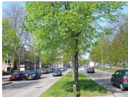
bomenstructuur in de middenberm