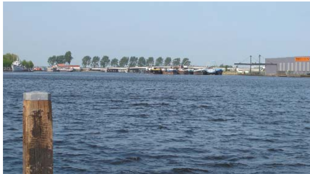
doorzicht over het Noorder Buiten Spaarne