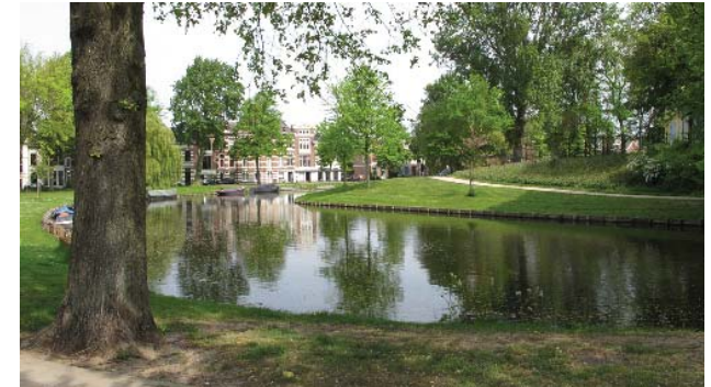
groene oevers met monumentale bomen

De bolwerken zijn in het Bomenbeleidsplan 2009-2019 onderdeel van de hoofdboomstructuur.