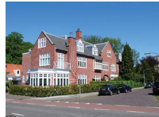
villa in Zuiderhout