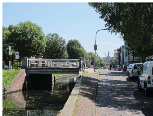
brug over Brouwersvaart