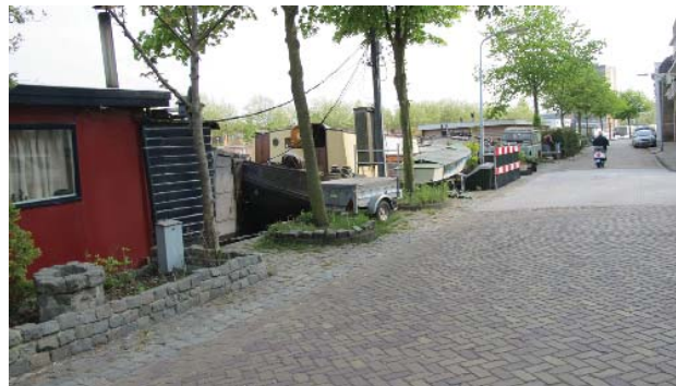
oever bij Rozenprieel, bepaald door woonboten