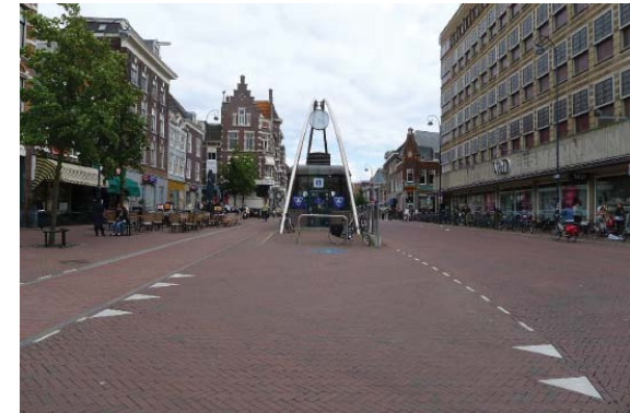
Gedempte Oude Gracht

De route heeft momenteel een 50km/h regime en is ook onderdeel van de Hoogwaardig Openbaar Vervoerlijn. Dit vraagt om een specifieke vormgeving van het straatprofiel. De breedte varieert van 18 tot wel 28m. Het profiel heeft vrijliggende fietspaden in een soort streetprint en een brede asfalt rijbaan met twee richtingen bus en één richting auto.