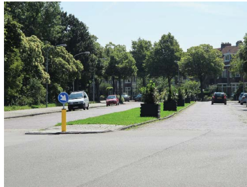
royaal profiel met middenberm