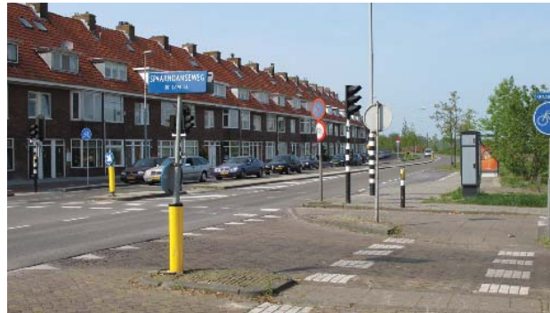
kromming in gevellijn

De route is in het Bomenbeleidsplan 2009-2019 onderdeel van de hoofdboomstructuur. Er zijn twee rijen bomen (eiken): in de grasberm aan de buitenzijde van het profiel en in de grasberm tussen ventweg en hoofdrijbaan. De laatste rij ontbreekt in het meest zuidelijk deel van de Vondelweg. In het langprofiel zijn de kronen van de bomen in de zijstraten als groene clusters zichtbaar. Tussen het straatprofiel en de polder is in het zuidelijk deel een 50m een vrij natuurlijk ingerichte brede groenzone aanwezig. Het fietspad en verschillende recreatieve functies zijn hier gesitueerd. Aan de noordzijde wordt het profiel begrensd door bosschages waarachter de sportvelden en begraafplaats zijn gesitueerd. Deze bosschages en de begeleidende bomenrij ontbreken bij het laatste deel van de weg in aansluiting op het Delftplein.