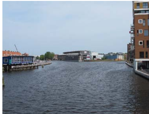
zicht over het water vanaf de Prinsenbrug