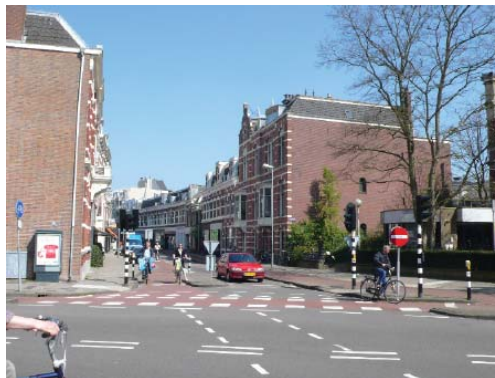
stedelijke wand in de rooilijn