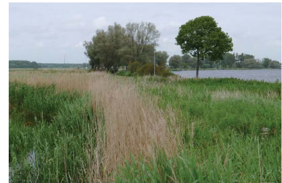
veenweidegebied bij Spaarndam