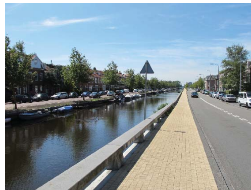
vaart met nieuwe kade