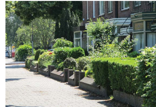
karakteristieke overgang tussen tuin en straat