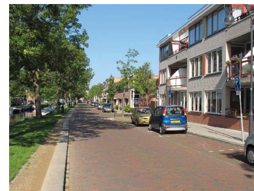
gevarieerde bebouwingstypologie langs de Zomerkade

deel bepalen de plantsoenen het groenbeeld, deels begeleid door rijen bomen, deels door solitaire bomen in de glooiende oevers met heesterbeplanting.