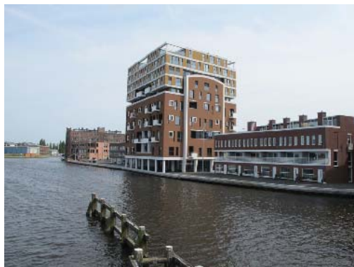
nieuwbouw op voormalig Droste-terrein