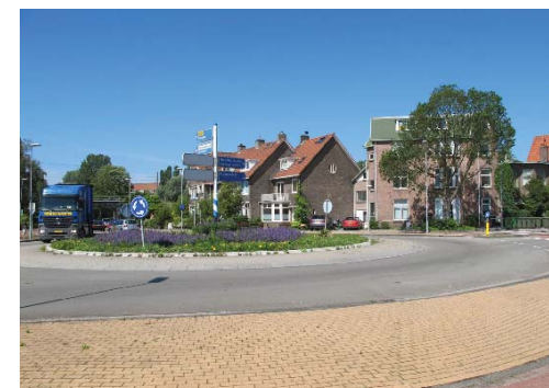
rotonde naar Korte Verspronckweg