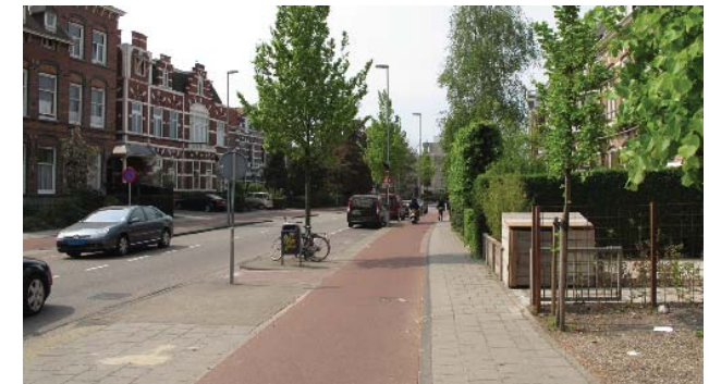
stadsstraat met voortuinen