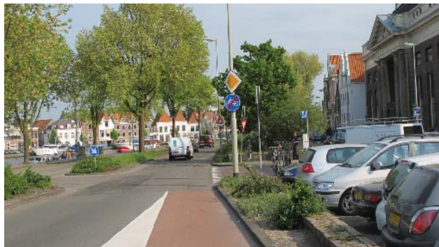
verkeerskundige inrichting langs het Binnen Spaarne