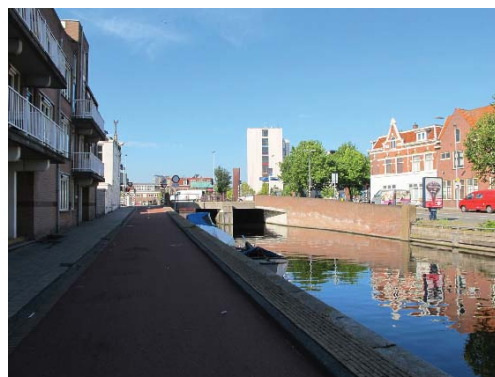
aansluiting op het Spaarne