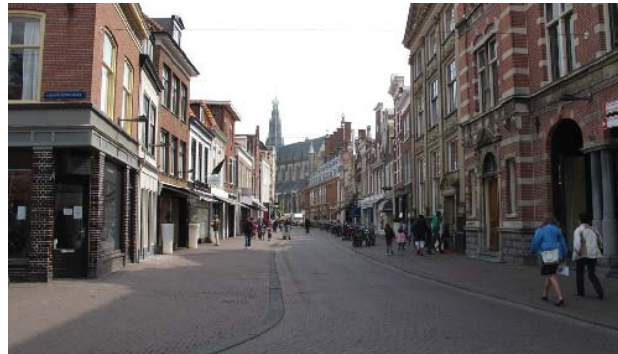
Zijlstraat in Centrum met uitzicht op Grote Kerk

De Zijlweg is in het Bomenbeleidsplan 2009-2019 onderdeel van de hoofdboomstructuur. De Zijlweg-Oost heeft twee rijen bomen in de parkeerstrook. In de Zijlweg-West ontbreekt aan de zuidzijde de bomenrij.