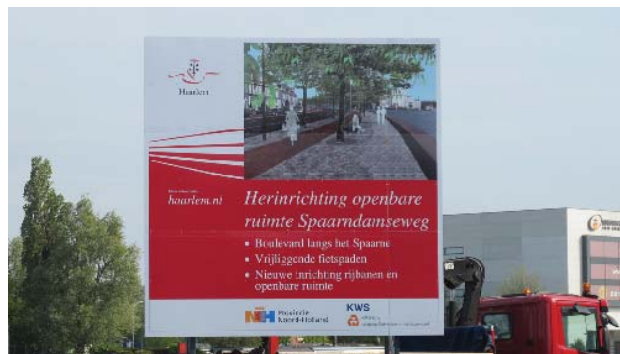
herinrichting van de Spaarndamseweg