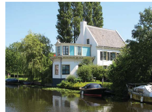
hofstede Vaartzicht (voormalige kwekerij Tubbergen)