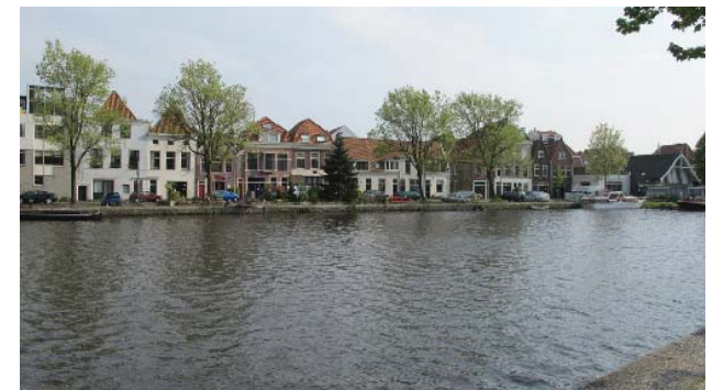
met informele inrichting van de kade oever