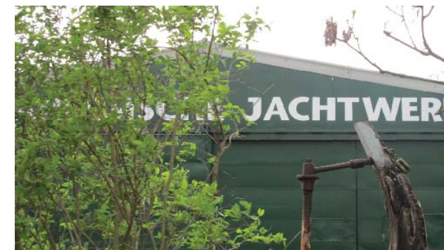
Spaarne-gerelateerde functies, o.a. jachtwerf