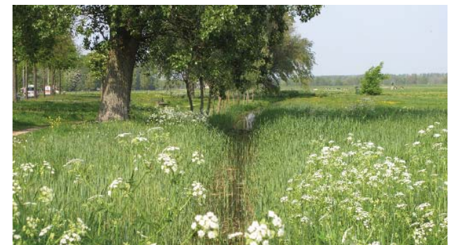
landschappelijk beeld groene rand