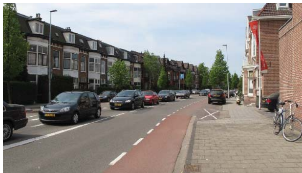
gekromde loop Verspronckweg

De Verspronckweg is in het Bomenbeleidsplan 2009-2019 onderdeel van de hoofdboomstructuur.