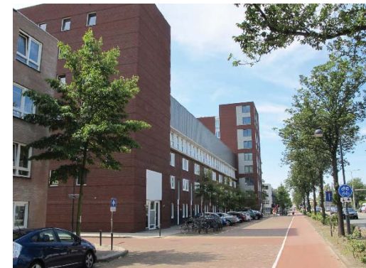
complex 'De Triangel'