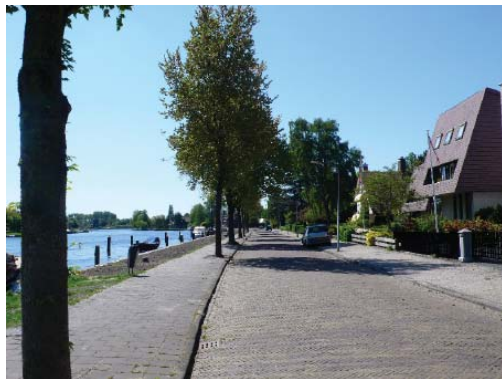
woningen langs het Spaarne