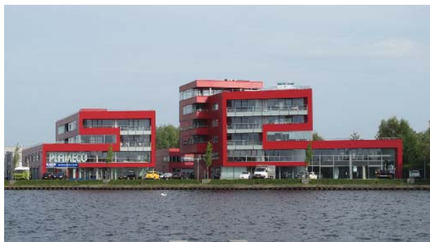
nieuwbouw Waarderpolder aan het Spaarnegevelbeeld langs het Binnen Spaarne