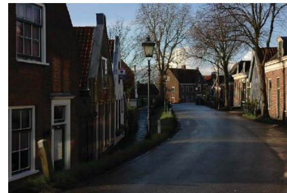
panden aan de noordzijde van de Spaarndammerdijk staan hoger

De Spaarndammerdijk is geen onderdeel van de in het Bomenbeleidsplan omschreven hoofdboomstructuur.