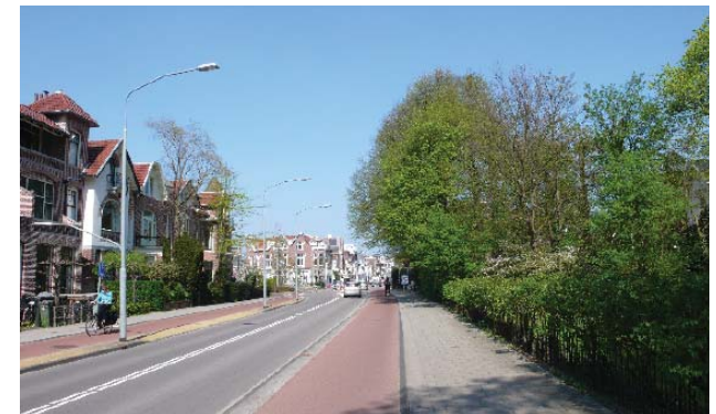
villagegebied met monumentaal groen