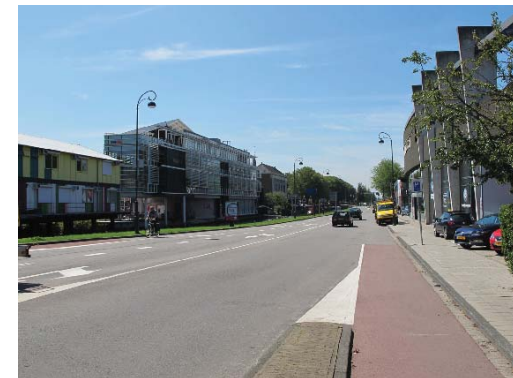
grote schaal aan de Zijlvest