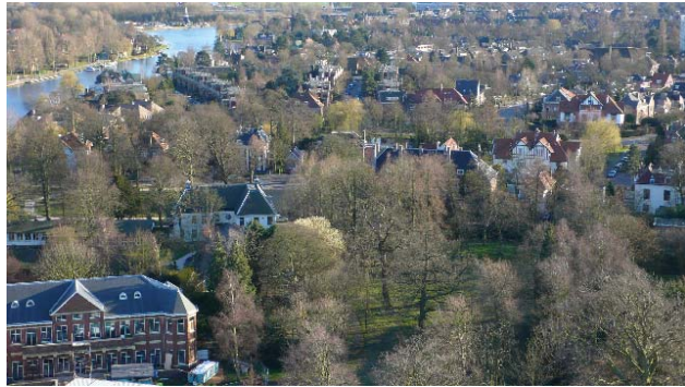
zicht over Haarlem Zuid