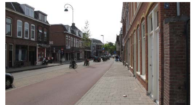
smalle stadsstraat in Frans Halsbuurt