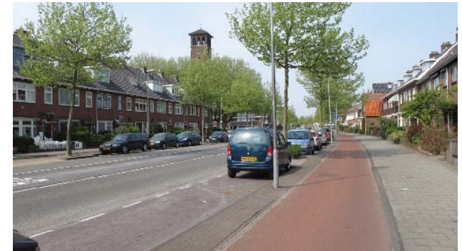
Rijksstraatweg met busbaan

naast de parkeerstrook. Aanvullen van de bestaande boomstructuur is het uitgangspunt.