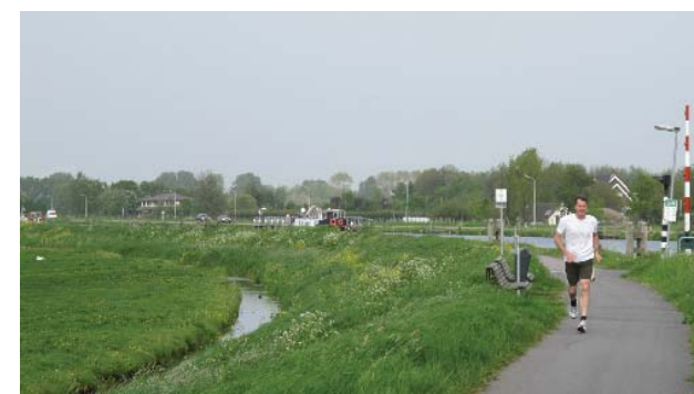
recreatieve route langs de dijk