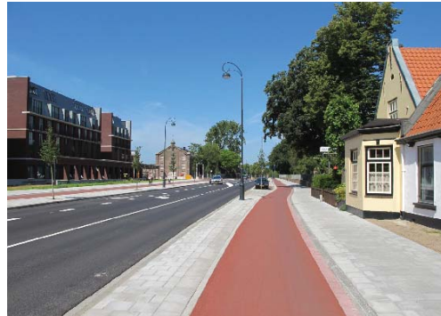
nieuwe inrichting ter hoogte van Ripperda

De route is in het Bomenbeleidsplan 2009-2019 onderdeel van de hoofdboomstructuur. De combinatie van voortuinen met straatbomen is van belang in het totaalbeeld. De bomen staan in twee rijen op sommige delen in de parkeerstrook, op andere delen in het trottoir. Daarnaast vormt de structuurlijn met zijn een aaneenschakeling van verschillende groengebiedjes - de stadkwekerij, de begraafplaats en de relictten van de oude Veerpolder met de molen - de brede groene dwarsverbinding tussen Spaarne en binnenduinrand. Een gebiedsvisie is voor deze groene dwarsverbinding is in voorbereiding.