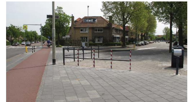
meer ontwerpaandacht voor aansluiting zijstraten