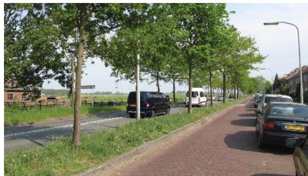
doorzicht vanaf Vondelweg naar open polderinrichting recreatiestroom