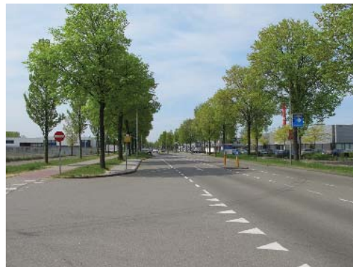
kenmerkend profiel met bomen in grasberm