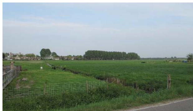
zicht over de Vereenigde Polder, richting Molenwijk