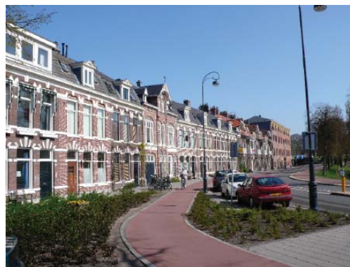
Garenkokerskwartier, langs de Vestinggracht