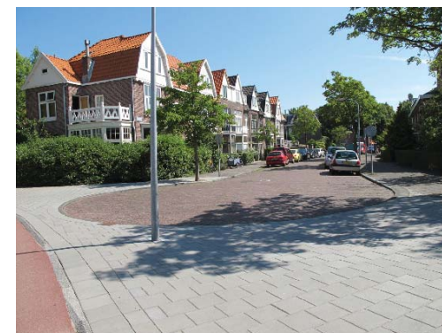
meer vanzelfsprekende aansluiting