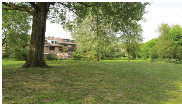
bebouwing langs parkstrook Molenwijk