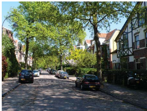
villa's in de Koninginnebuurt