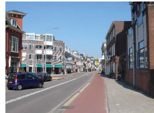
Wagenweg met fietspad