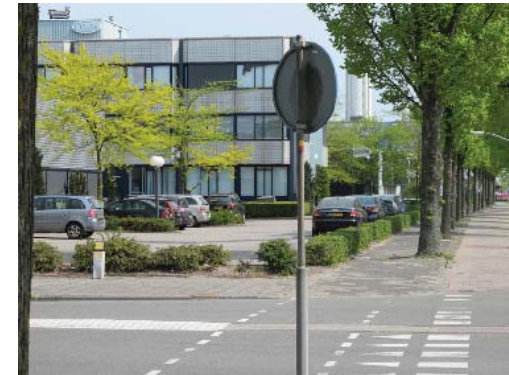
overgang openbaar-privé met haag

De Oudeweg is in het Bomenbeleidsplan 2009-2019 onderdeel van de hoofdboomstructuur. Op de Oudeweg zijn de royale doorgaande grasbermen naast de bomen bepalend voor het groene karakter van de weg.