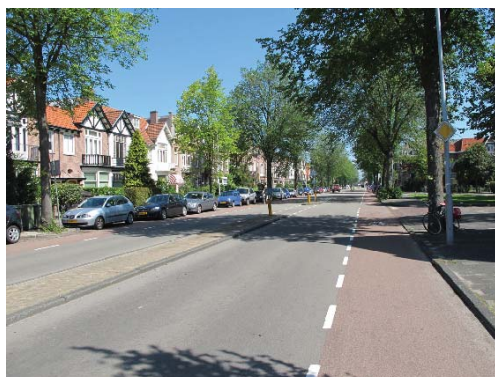
royaal profiel met groene voortuinen