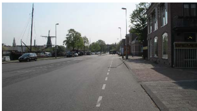
inrichting van het openbaar gebied, niet des binnenstads