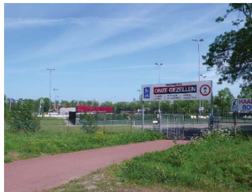
Van der Aart-sportpark