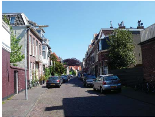
noordelijk deel Koninginnebuurt