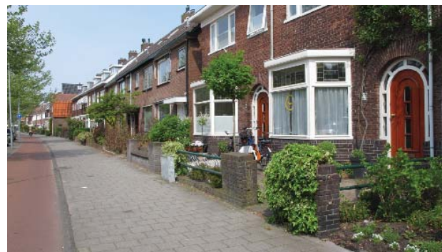
bebouwingsbeeld met voortuinen, Rijksstraatweg