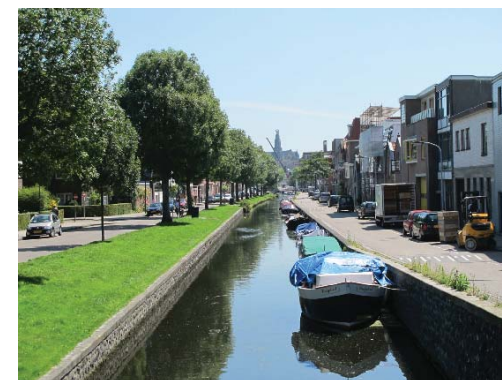
Brouwersvaart met zicht op de Grote Kerk

De Brouwersvaart is in het Bomenbeleidsplan 2009-2019 onderdeel van de hoofdboomstructuur. De Houtmankade en het Houtmanpad vormen een mooie verbinding met het veenweidegebied en de landgoederen. Een meer landelijke inrichting met elzensingels en ruige grasbermen is hier op zijn plaats.