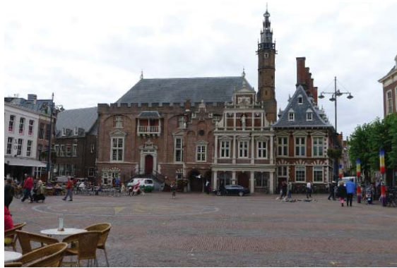
Stadhuis aan de Grote markt