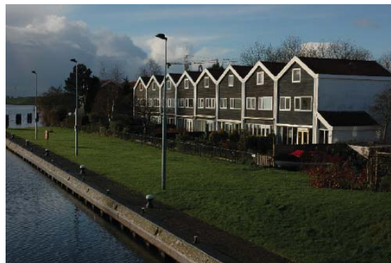
20e eeuwse invulling met zadeldak