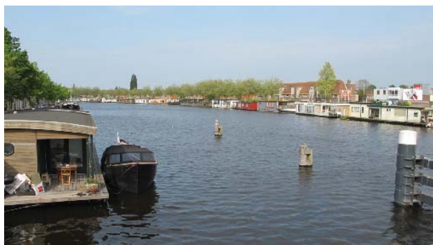
zicht over het Spaarne, richting Slachthuisbuurt