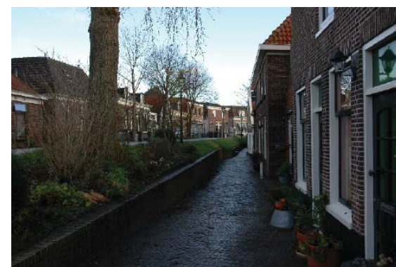
onderstraatje aan de Spaarndammerdijk