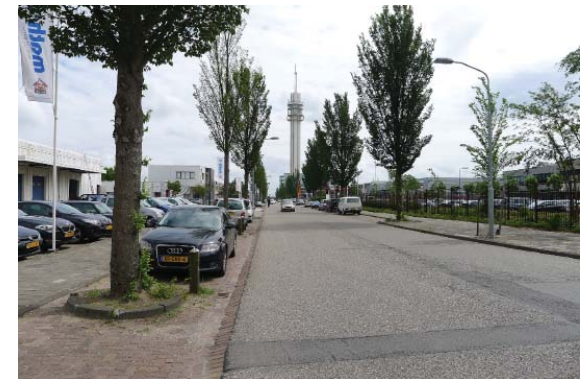
Straatprofiel in de Waarderpolder