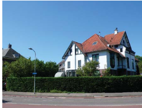
individuele villa aan de Churchillaan