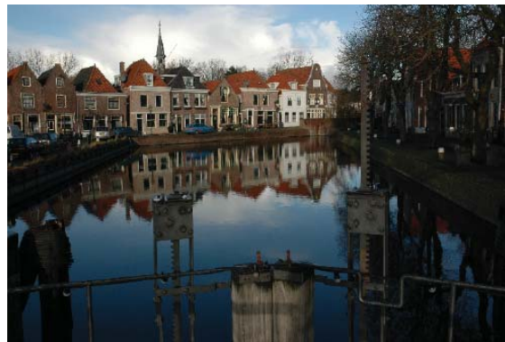
de Kolk in Spaarndam