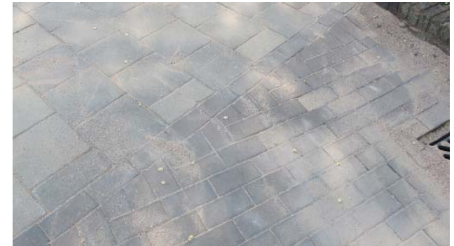
materiaalovergang op de Spaarndamseweg