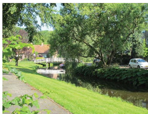
lommerrijk beeld langs de Zomervaart