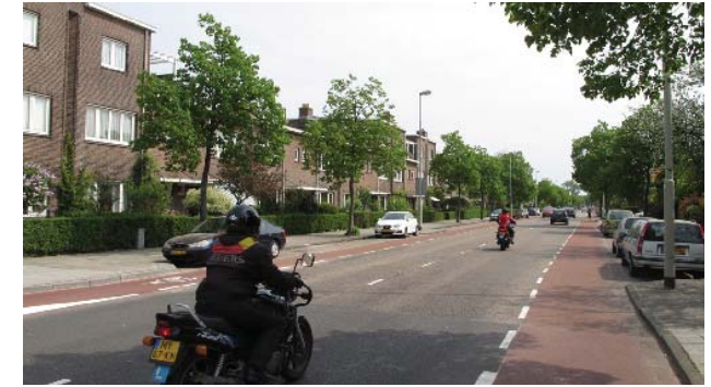
wooncomplex J.B. van Loghem, met 3-laagse hoogte-accnten