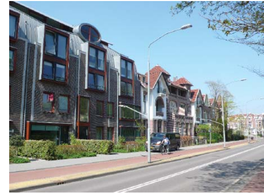
nieuwe invulling aan de Wagenweg