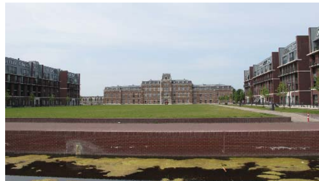
St. Jorisveld, Ripperdakazerne