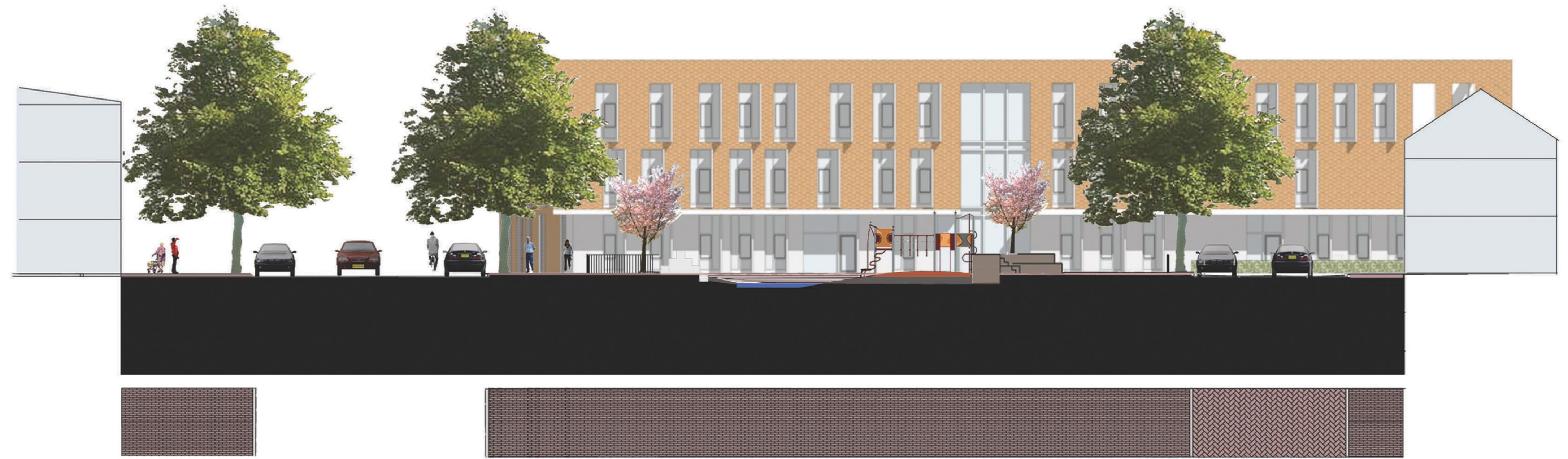
PRINCIPEPROFIEL/AANZICHT WESTGEVEL SCHOOL