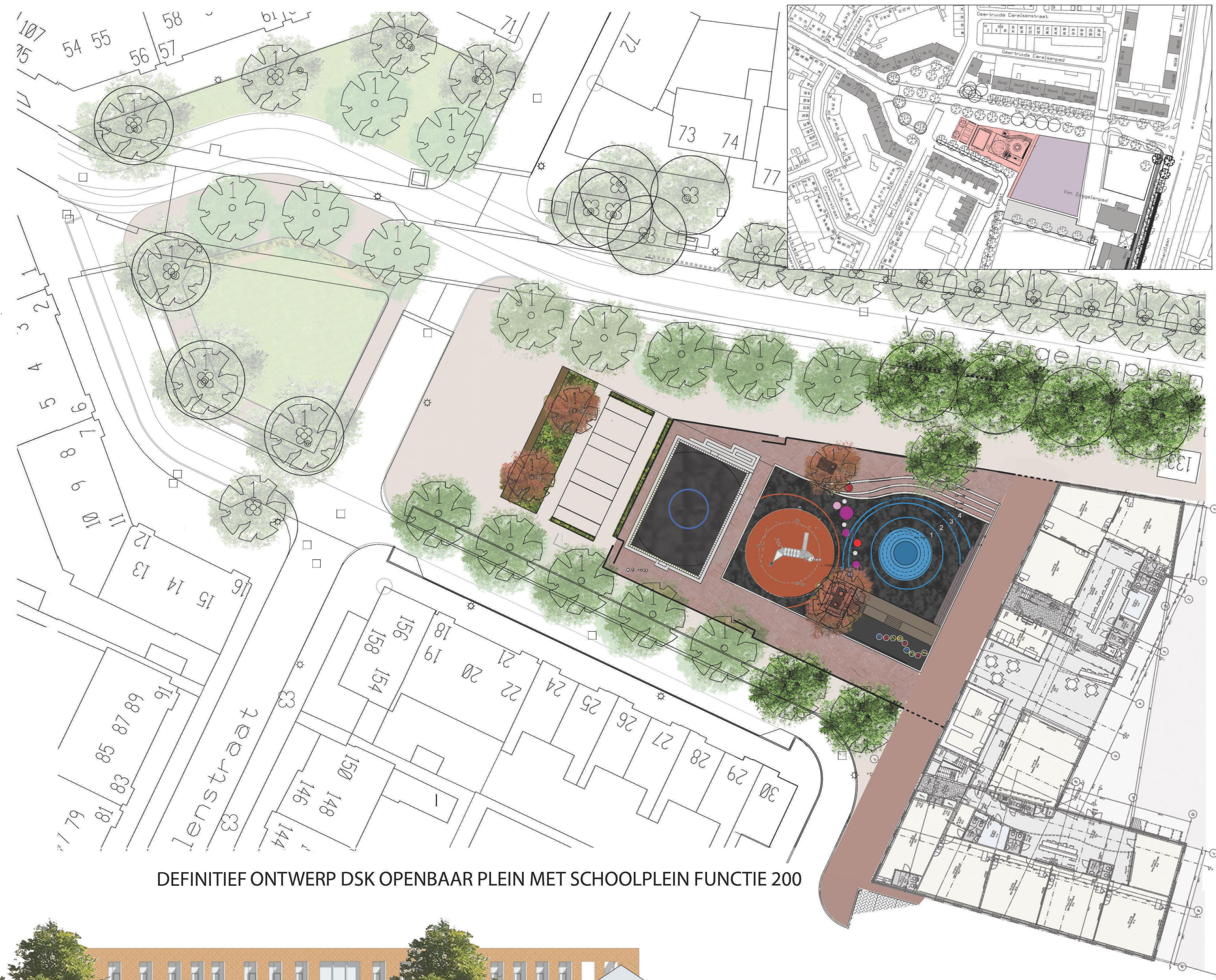
DEFINITIEF ONTWERP DSK OPENBAAR PLEIN MET SCHOOLPLEIN FUNCTIE 200