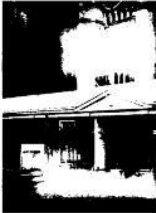
Stoepbord zo niet toegestaan

Hieronder een aantal voorbeelden in foto's van wat wel en niet is toegestaan met dit nieuwe reclame beleid.