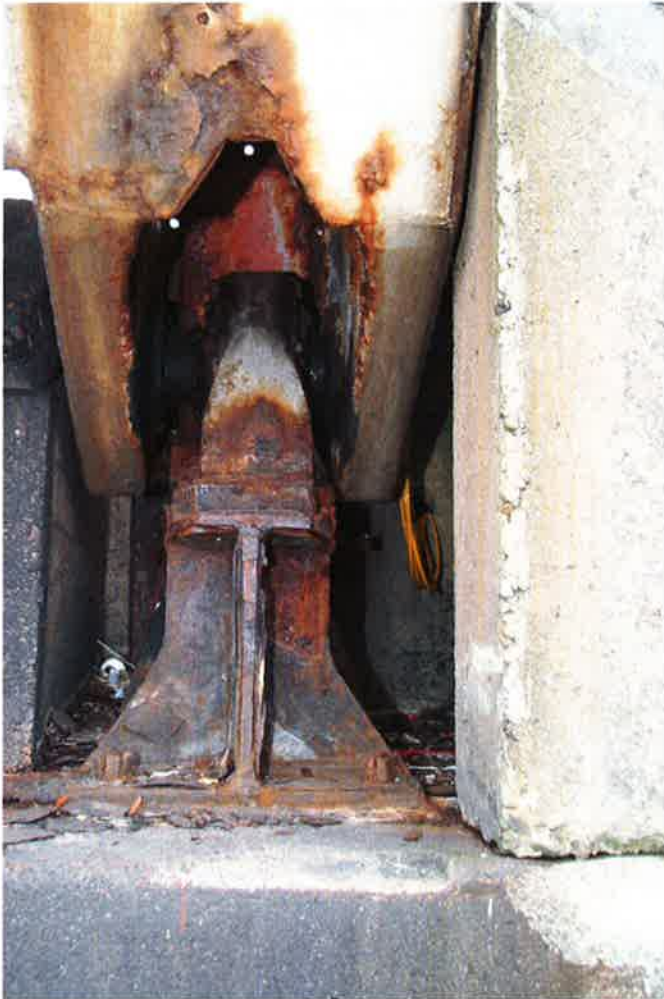
Draaipunt brug verankering grondplaat vertoont veel corrosie. (foto boven en onder)