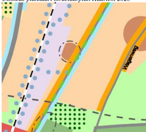
Uitsnede plankaart Structuurplan Haarlem 2020