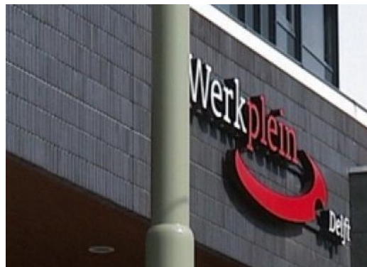
Voorbeelden van Werkpleinen elders in Nederland