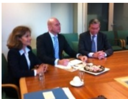
Ondertekening VSV convenant

Het tijdig aanpakken van verzuim, het voorkomen en bestrijden van schooluitval en het streven om zoveel mogelijk jongeren een startkwalificatie te laten behalen is zowel landelijk als regionaal een beleidsspeerpunt en zal dit ook de komende jaren blijven, mede gezien de recent afgesloten nieuwe VSV convenanten en de door het ministerie van OCW gehonoreerde aanvragen voor extra VSV-maatregelen over de periode tot en met 2015.