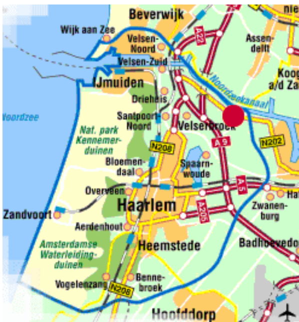
De regio Zuid-Kennemerland