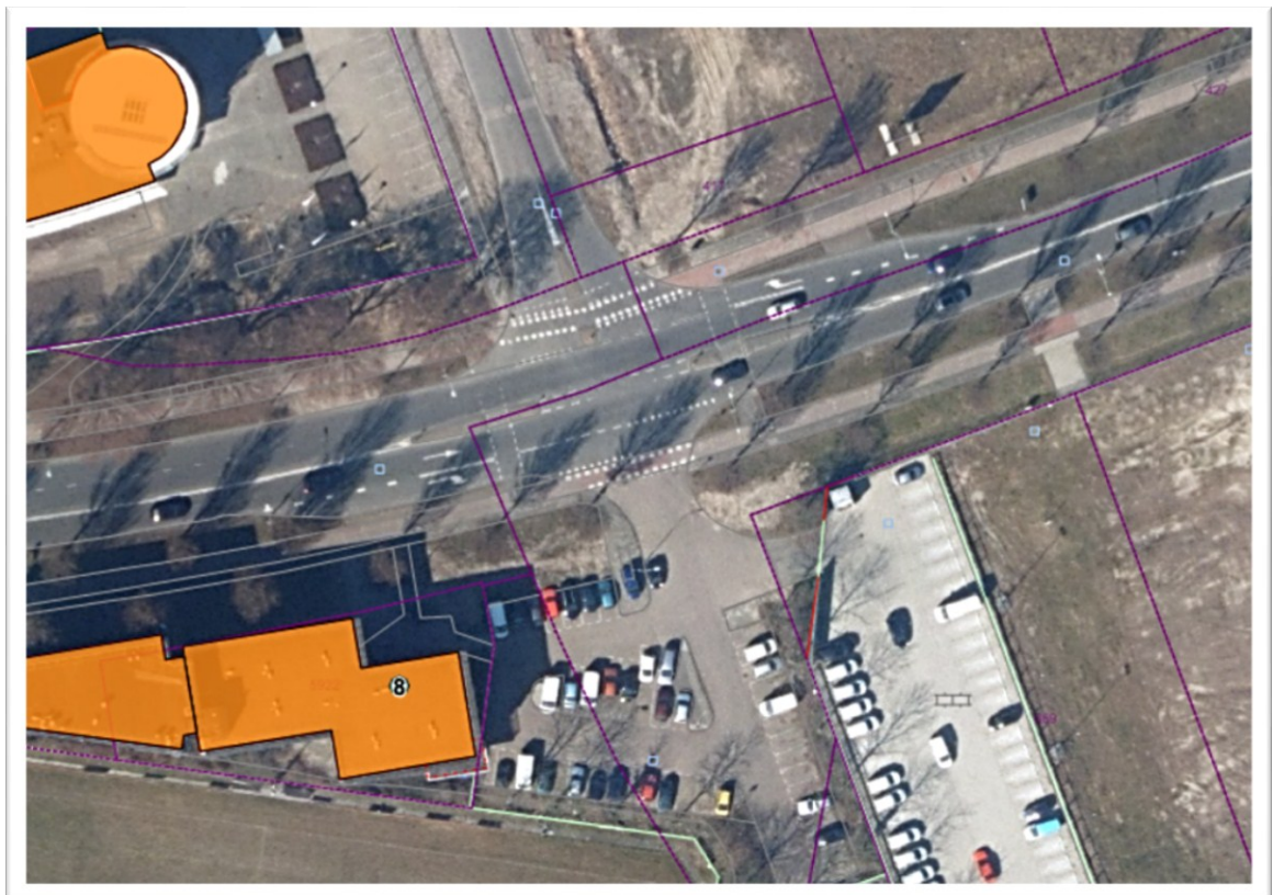
Huidige situatie kruispunt Oudeweg - Minckelersweg

Het noordelijke fietspad wordt in twee richtingen bereden en aan de zuidzijde blijft het een éénrichting fietspad. De ligging van de fietspaden past in de gewenste eindsituatie.