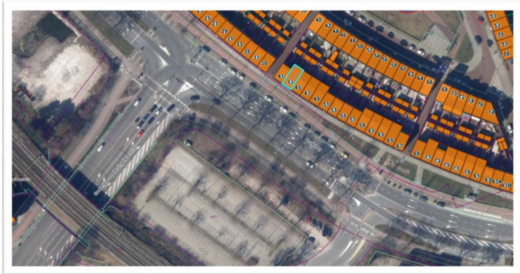
Huidige situatie kruispunt Oudeweg-Gedempte Oostersingelgracht