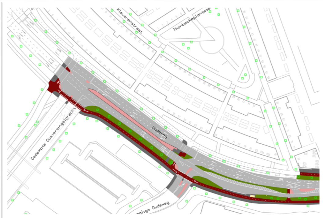
Ontwerp kruispunt Oudeweg-Oostersingelgracht