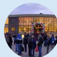
Prof. dr. Gunningschool (V)SO (incl.VDG) vmbo-bb, vmbo-tl voor kinderen met gedrags- of ontwikkelingsproblemen Aantal leerlingen: 374