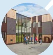
Daaf Gelukschool vmbo-kb, vmbo-tl Aantal leerlingen: 177