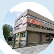
Het Schoter vwo, havo, vmbo-tl Aantal leerlingen: 843