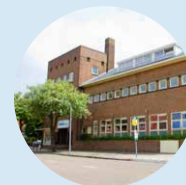
Paulus Mavo vmbo-tl, vmbo-kb Aantal leerlingen: 336