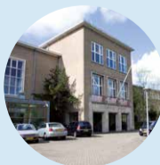
Coornhert Lyceum Gymnasium, vwo, havo, vmbo-tl Aantal leerlingen: 1.722