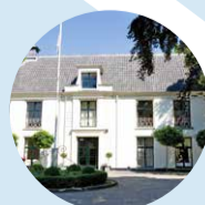
Praktijkschool Oost ter Hout Praktijkonderwijs Aantal leerlingen: 194