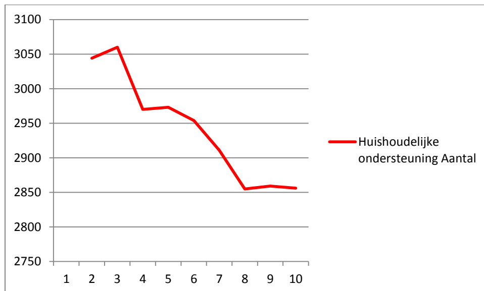
Figuur 1 Huishoudelijke ondersteuning

Bij de nieuwe taak begeleiding in groepsverband (dagbesteding) zet de stijging in het tweede kwartaal zich door in het derde kwartaal (figuur 2). Individuele begeleiding stijgt licht in het derde kwartaal. Van de Huishoudelijke Hulp Toelage (HHT) wordt nog steeds beperkt gebruik gemaakt. Onderzocht wordt of de bijdrage die cliënten zelf moeten betalen verlaagd kan worden om het gebruik van de HHT te stimuleren.