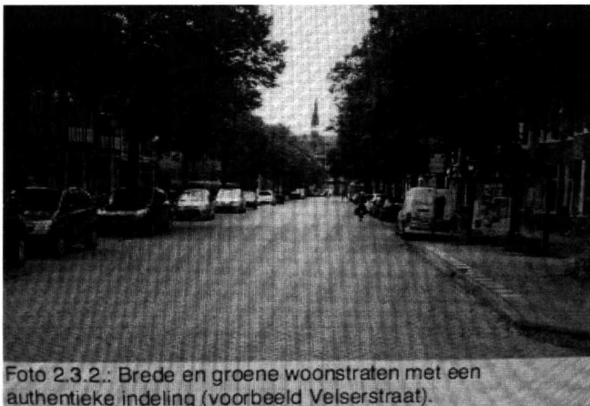
Foto 2.3.2.: Brede en groene woonstraten met een authentieke indeling (voorbeeld Velsersstraat).

De Velsersstraat wordt in het concept HIOR getoond als brede en groene straat met een voor de wijk kenmerkende authentieke wegindeling, zie afbeelding 1.