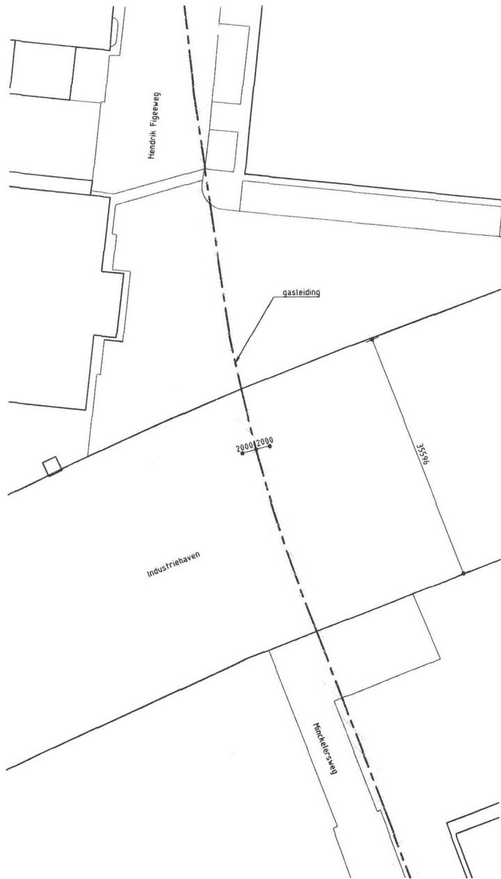
SITUATIE BESTAAND SCHAAL 1:500