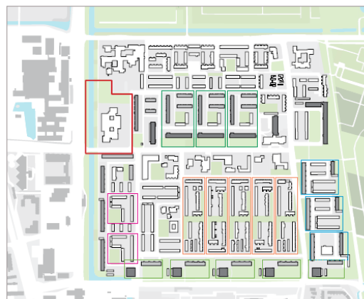
Figuur 2: Ligging Poort van Boerhaave Damiatelocatie

gemeenteraad van Haarlem in 2012 de Gebiedsvisie Boerhaavewijk (bijlage 3) vast, die later is uitgewerkt tot de Stedenbouwkundige Randvoorwaarden Poort van Boerhaave – Damiate (vastgesteld door de gemeenteraad d.d. 17 november 2016) (bijlage 4) . Hoewel de Poort van Boerhaave een groter gebied beslaat, hebben de genoemde stedenbouwkundige randvoorwaarden, net als deze Aanbestedingsleidraad, uitsluitend betrekking op het zuidelijk deel van deze zone. In de volksmond ook wel bekend onder de naam Damiate(locatie).