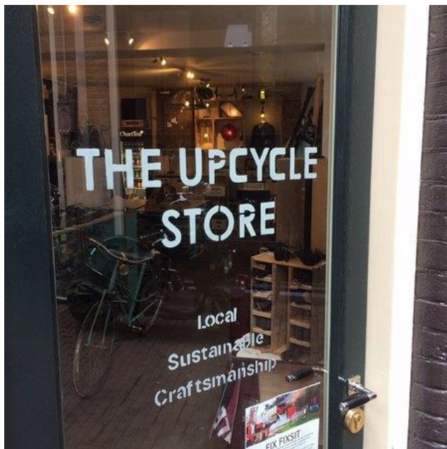
The Upcycle Store in Amsterdam

Startpunt voor iedere werkgroep vormen de grondstofstromen waarvan de gemeente eigenaar is via de inzameling van huishoudelijk afval en het onderhoud en beheer van de openbare ruimte. De context per grondstofstroom loopt echter uiteen, evenals de samenwerkingspartners en de uitdagingen. Daarom zal de voortgang per stroom verschillen.