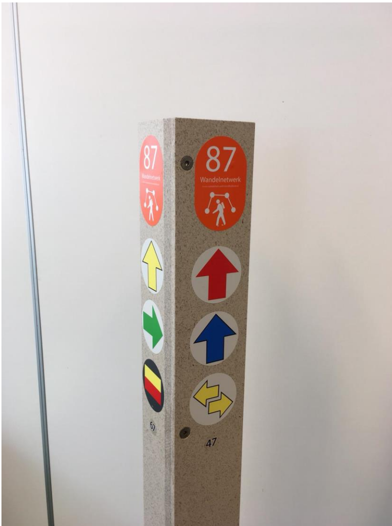
De Gooi en Vechtstreek wil via Circulair Inkoop het hele toeristische wandelroutenetwerk bewegwijzeren met 100% circulaire routepalen

Een aantal gemeenten heeft al een start gemaakt met circulair inkopen, waardoor er goede voorbeelden van geslaagde aanbestedingen voorhanden zijn. Van een MRA-brede aanpak is echter nog geen sprake. Indien deze afstemming tussen de 36 partners van de grond komt, geeft dit een belangrijke impuls aan het ontwikkelen van een omvangrijk circulaire inkoopprogramma.